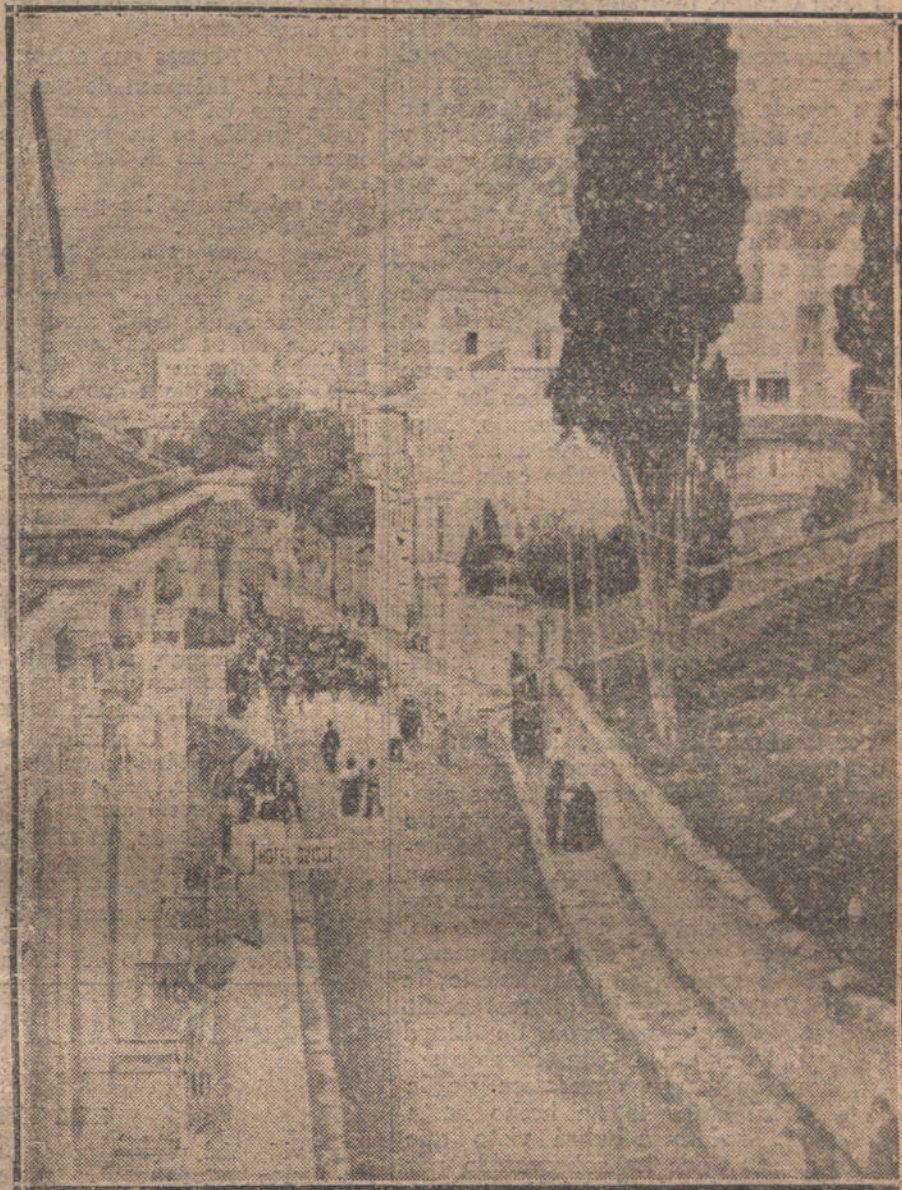
LA GUERRA EN ORIENTE.—Persecución de armenios en las calles de Trebizonda, localidad ocupada por los rusos.

Peró también las «protecciones comerciales» hechas por Grey el 3 de Agosto de 1914 en un momento de ceguera incomprensible, han sido desmentidas luego por el desarrollo de los acontecimientos. Nadie lo ha comprobado mejor que el propio Lloyd George en el discurso que pronunció el 4 de Mayo de 1915 en el Senado inglés. Empezó recordando que, tanto Alemania como Inglaterra tienen un poderoso comercio exterior que termina casi siempre con un excedente de importación. Comparando luego la situación económica de ambos