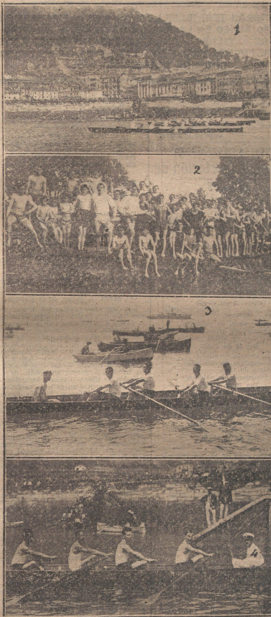
Núm. 1, Momento de salir las yolas que tomaron parte en las últimas regatas.— Núm. 2, Grupo de nadadores que figuraron en el concurso verificado con motivo de las fiestas de San Ignacio.— Núm. 3, La yola catalana «Manelika», que ganó la copa de D. Mariano Foronda en la regata «Zumaya».— Núm. 4, La yola «Donostia», que ganó la copa del Club Náutico.

Grave cogida de Varellito, Charlot's, Llapisera y el Botones.