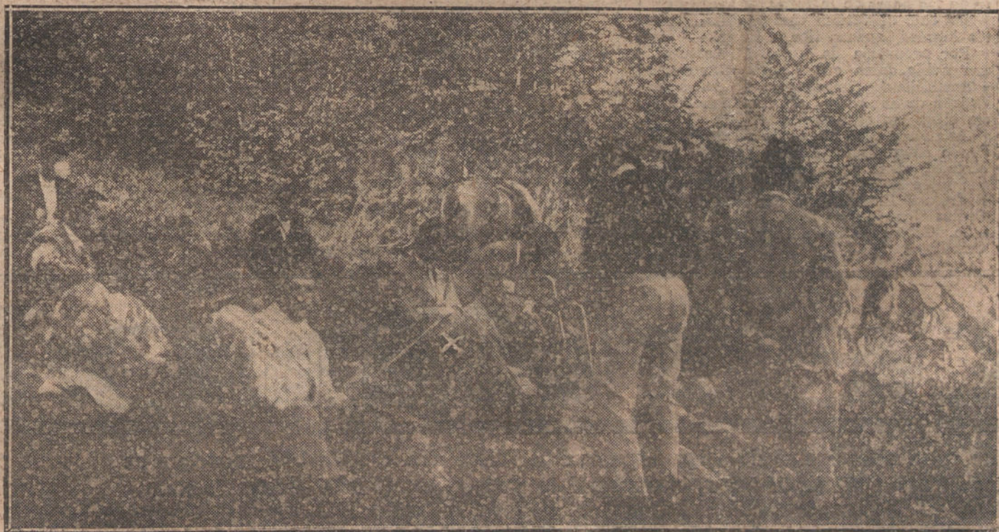
LA CACERIA DE OSOS EN LOS MONTES DE SAJA.—S. M. el Rey (x) en un descanso, durante la cacería.

La diferencia entre los dos problemas debería ser tomada en consideración por la Comisión (el Senado se había constituido en Comisión). Desde el punto de vista del ministro de la Guerra, se encuentra la Gran Bretaña en situación favorable. «Desde el punto de vista del ministro de Hacienda, nuestras dificultades son ahora mayores que nunca. A medida que más dure la guerra, mayores serán las ventajas obtenidas por el ministro de la Guerra con respecto de su colega alemán. El ministro de Hacienda alemán, sin embargo, no tropieza con las mismas dificultades al proceder a la catalogación de los productos recibidos de Ultramar. Veamos ahora la cuestión financiera. El excedente que arroja la importación inglesa es de unos ciento treinta millones de libras esterlinas en años normales. Este año será, seguramente de cuatrocientos cuarenta y ocho millones de libras. En esta suma no están incluidas las compras que el Gobierno y los aliados han hecho en Ultramar. «El caso es que nosotros tenemos que capitalizar en Ultramar las compras efectuadas por la mayor parte de nuestros aliados», de suerte que en lugar de capitalizar un excedente de importación de 130.000.000