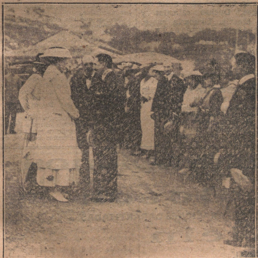
LOS REYES EN SANTANDER.—S. M. la Reina Victoria conversando con algunos aristócratas que asistieron al partido de polo jugado recientemente en el Campo de la Magdalena.