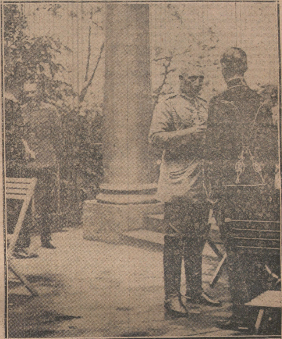
El Emperador de Alemania conversando con sus ayudantes en el Cuartel general del frente ruso.

Después de lo expuesto, y refiriéndonos al combate de Jutlandia, se ocurre preguntar: ¿Qué clase de proyectiles usaron uno y otro combatiente? Desde luego, y siendo los ingleses padres de la criatura, no hay que decir que su siste-