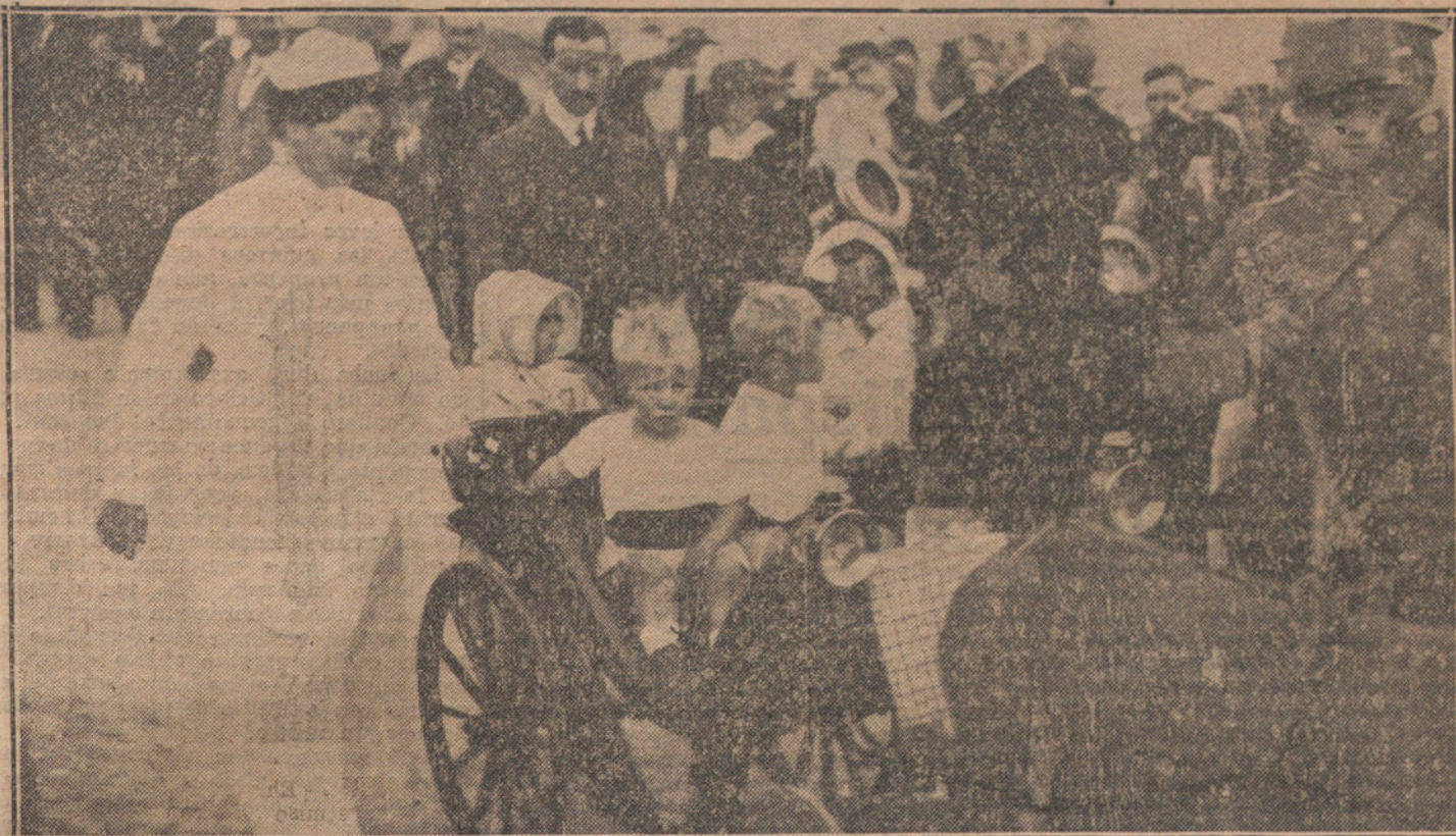
LA FAMILIA REAL EN SANTANDER.—SS. AA. los Infantitos Doña Beatriz, Doña Cristina, Don Gonzalo y Don Juan, a su regreso a Palacio después de pasear por el Campo de Polo de la Magdalena.