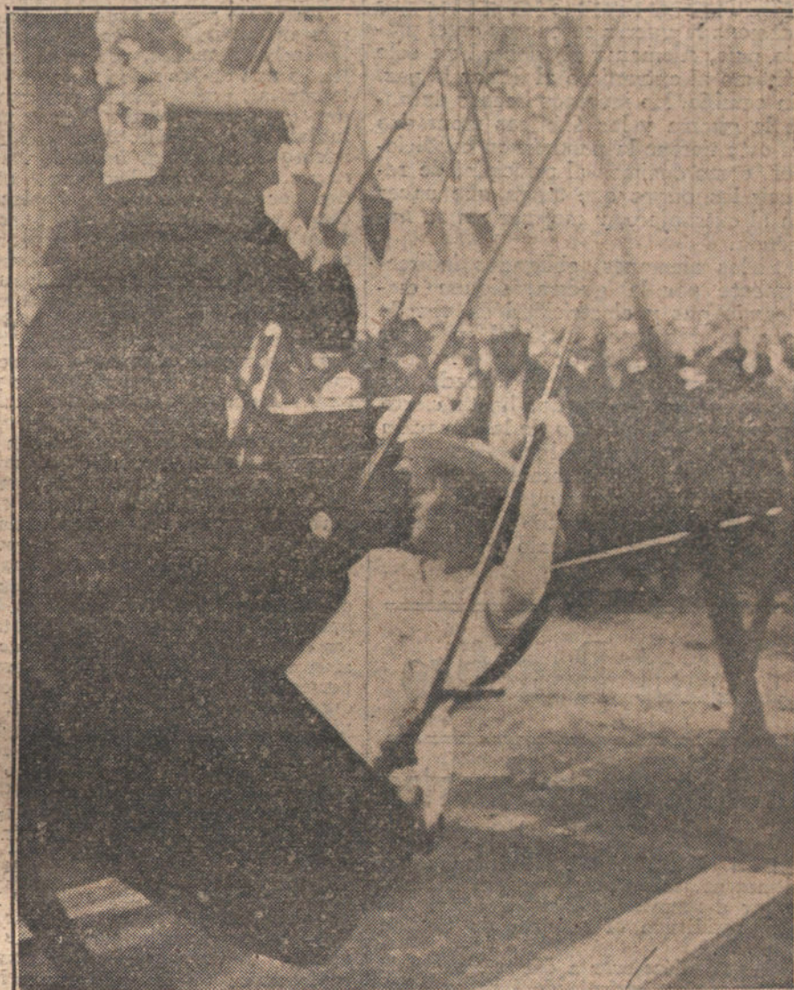
S. M. la Reina Victoria en uno de los columpios de la feria de Santander.

Estos descubrimientos, a los que indudablemente seguirán otros durante el curso de la guerra, se pondrán de manifiesto en el terreno financiero. Los enemigos de Alemania están obligados a comprar en el extranjero una gran parte de sus municiones y armas, así como los viveres que necesitan para el sustento de su población. Si tenemos ahora en cuenta que la capacidad de adquisición y el bienestar de muchas naciones de Ultramar sufren y siguen sufriendo los efectos de la conflagración europea, se comprenderá que las