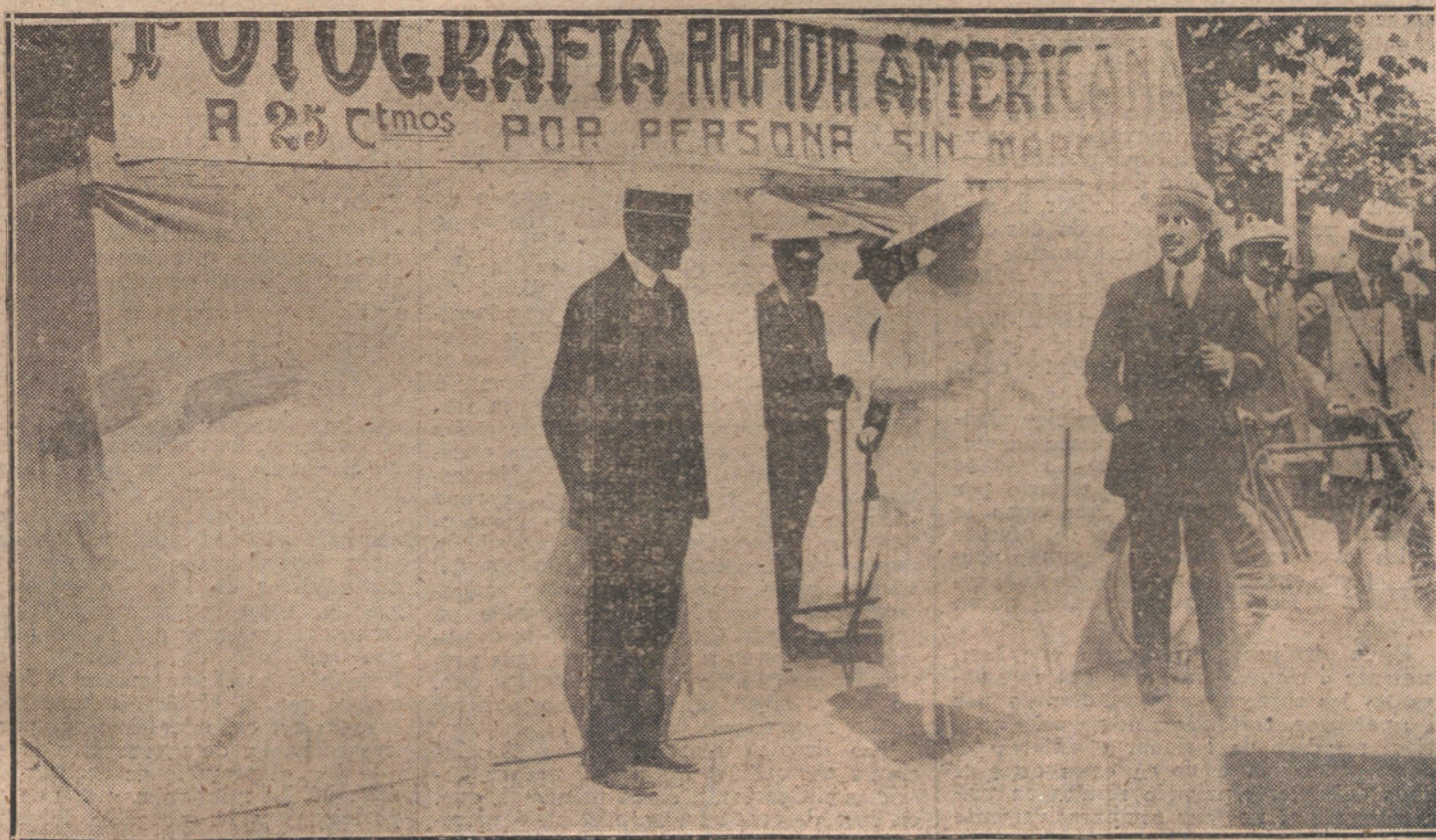
S. M. la Reina Victoria saliendo de hacerse una fotografía en una de las barracas de la feria de Santander.