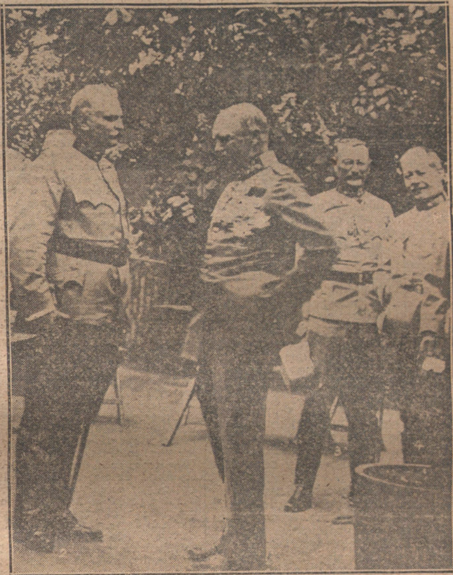
El Rey de Sajonia en el cuartel general austrohúngaro hablando con el general von Höfer.

«Yo no puedo afirmar, ni nadie, á conciencia, que esos crímenes se cometieran, porque sí, por desenfreno de innata crueldad. Por eso no he querido firmar el manifiesto, porque sin un santo padre de la Iglesia, me