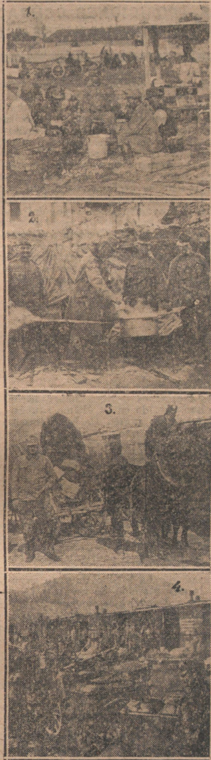
Num. 1, Soldados austriacos pelando patatas en un campamento de la Polonia rusa.—Num. 2, Cocina austriaca de campaña.—Num. 3, Llegada de géneros al campamento.—Num. 4, Transporte de cocinas de campaña.