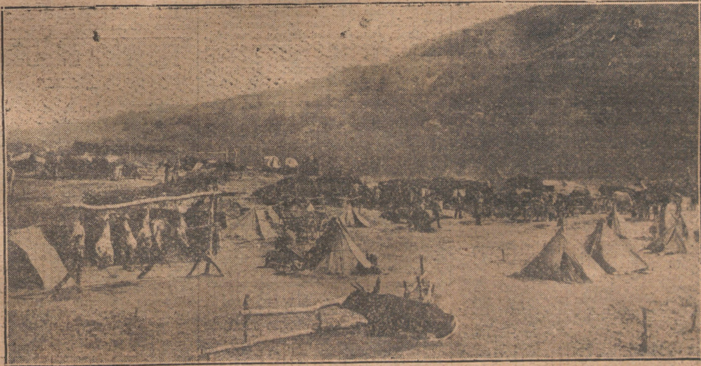
LA VIDA EN CAMPAÑA.—Un campamento austro-húngaro en la Galizia.

Las conclusiones son: Que continúa suministrándose el gas a 25 céntimos el metro cúbico; que se suprima el pago de cinco pesetas por colocación de contador; que el kilovatio eléctrico para alumbrado no exceda de 40 céntimos si se trata de corriente proveniente de fuerza hidráulica, y de 60 céntimos si es de corriente continua procedente de fabricación con carbón; que no se exija cantidad por alquiler de contadores ni de gas ni de electricidad, y que procure el Ayuntamiento municipalizar los servicios.