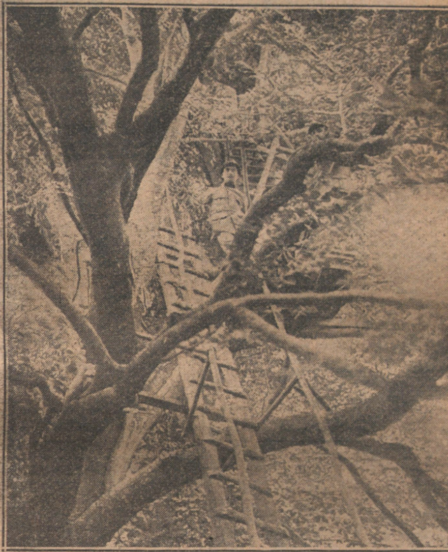
Soldados ingleses en un puesto avanzado de observación.

Por otro lado, vemos los titánicos esfuerzos de los aliados en busca de primeras materias. El Gobierno inglés ha