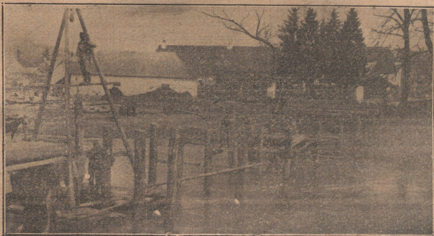
Soldados austriacos construyendo un puente sobre el Isarco.