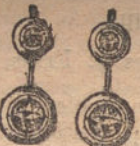
Núm. 2. — Pendientes 4 brillantes. Ptas. 250.