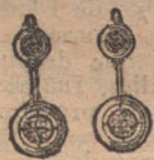
Núm. 1. — Pendientes 4 brillantes. Ptas. 175.

Montados sobre platino y oro de ley 18 quilates contrastado