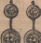
Núm. 5. — Pendientes 4 brillantes. Ptas. 925.