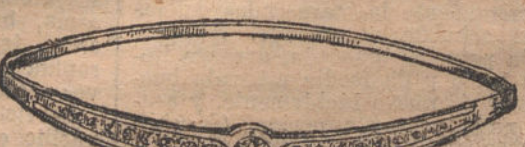
Núm. 12. — Pulsera diez y nueve brillantes. Ptas. 625.

Factura de garantía en todas las compras