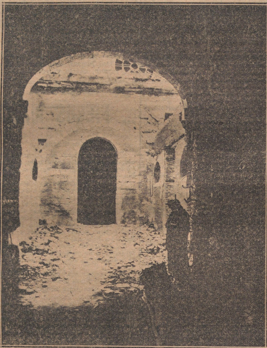
Curiosa fotografía de la destruida catedral de Arras, de la que han quedado intactas unas imágenes que aparecen a la derecha del arco.

Roto el plan, se reduce la acción, tanto de las tropas de Joffre como de las de sir Douglas Haig, a operaciones aisladas, a ataques de tanteo, a avances parciales, a todo menos a una ofensiva metódica. Los franceses acusan algunas ventajas en sus últimos partes; pero estas mismas ventajas nos dan la razón; no se relacionan con una decisión estratégica con avances tácticos.