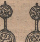
Núm. 6. — Pendientes 4 brillantes. Ptas. 1.375.