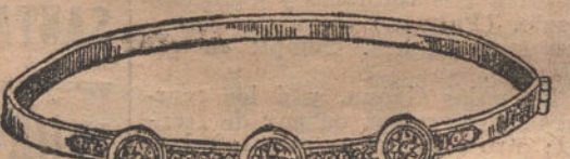
Núm. 11. — Pulsera tres brillantes y diamantes. Ptas. 525.