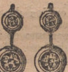
Núm. 3. — Pendientes 4 brillantes. Ptas. 375.