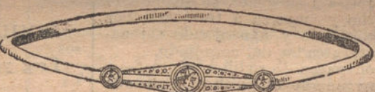
Núm. 8. — Pulsera tres brillantes. Ptas. 250.