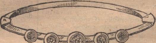
Núm. 9. — Pulsera cinco brillantes. Ptas. 325.