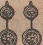
Núm. 4. — Pendientes 4 brillantes. Ptas. 625.