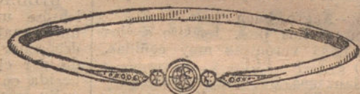
Núm. 7. — Pulsera tres brillantes y diamantes. Ptas. 200.