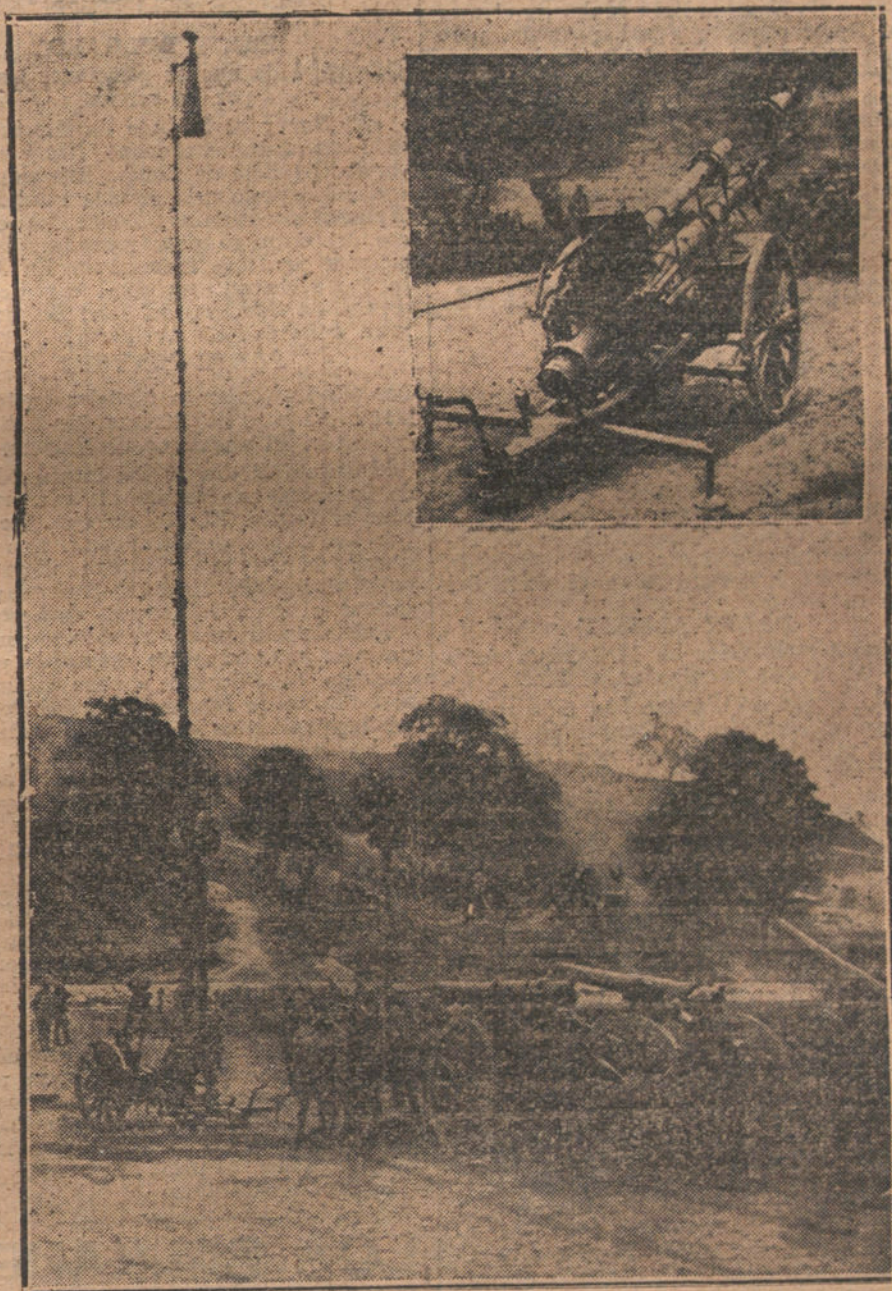
Periscopio gigante de campaña, modelo alemán, que está prestando excelentes servicios en el Ejército francés.

Repington, el coronel crítico militar de «The Times», sospecha que la presencia de los turcos en Rusia es señal inequívoca de desgaste. Pues, entonces, ¿de qué es señal la presencia en Francia de rusos,