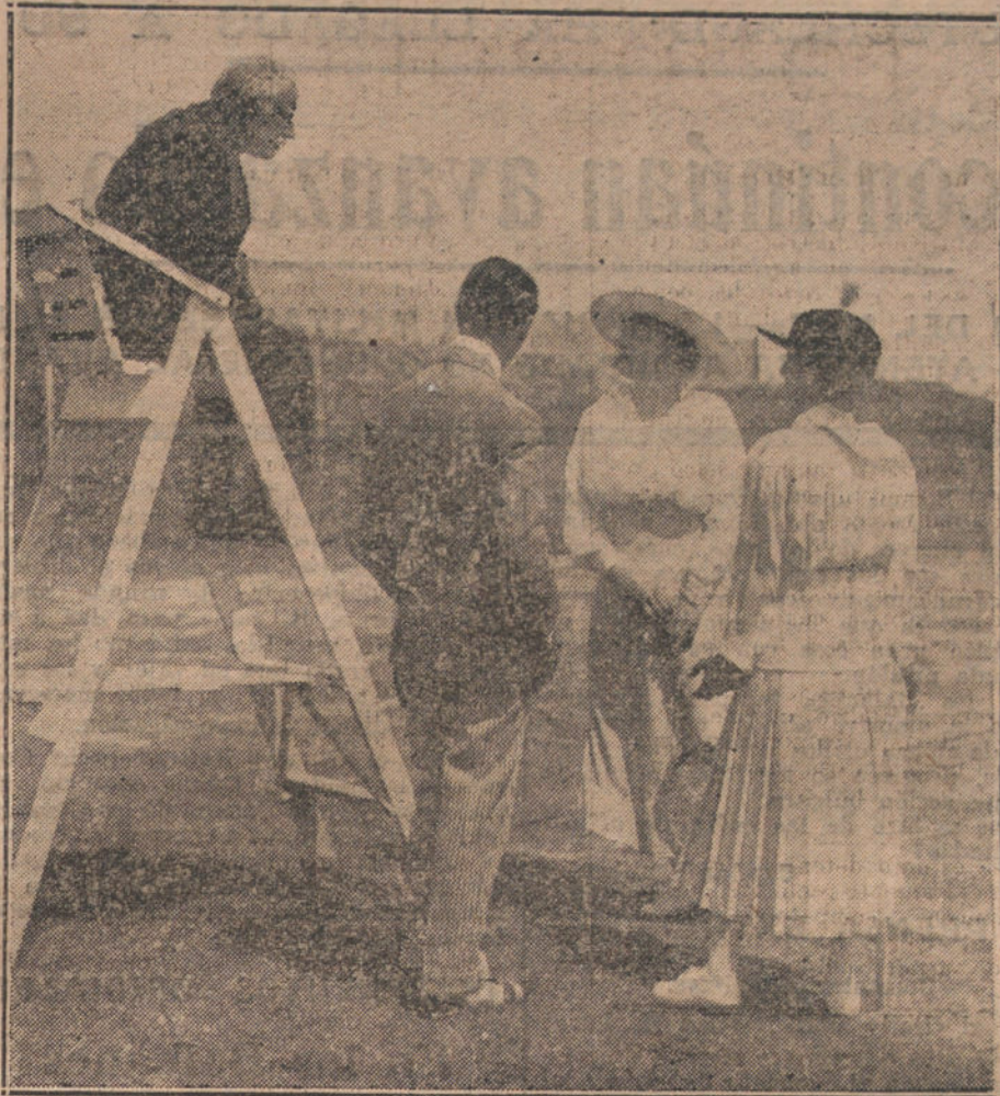
EL VERANO EN SANTANDER.—S. M. la Reina Victoria, en el partido de «tenis», hablando con el juez de campo durante un descanso.