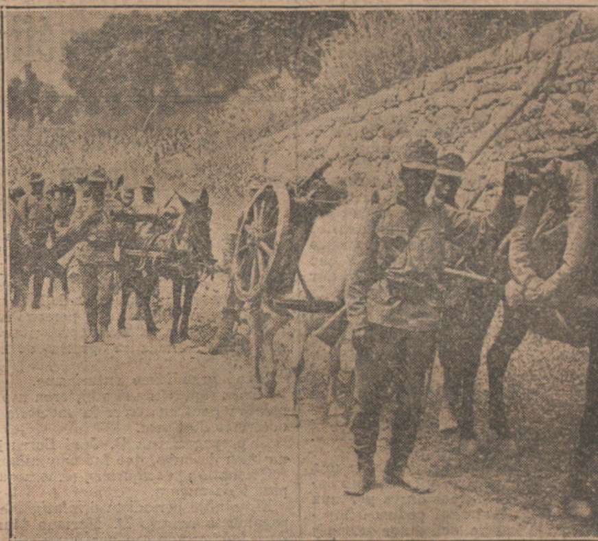
LA GUERRA EN ORIENTE.—Columna de montaña austrohúngara en marcha hacia la línea de fuego.

Los hombres que, como D. Melquiades Alvarez, mantienen esa clase de tedrias, son españoles porque han na-