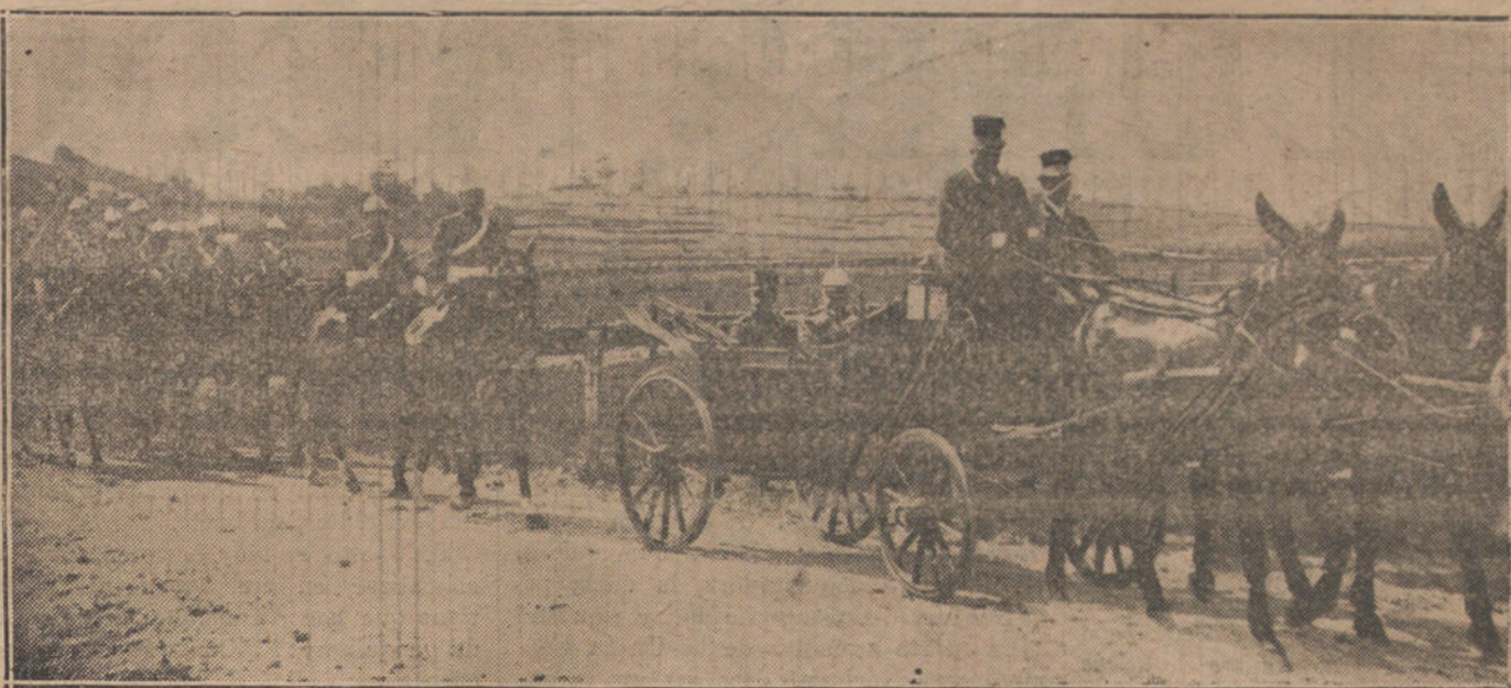
EL VERANO EN SANTANDER.—S. M. el Rey, acompañado del general Aznar, á su llegada al campo de la Albericia para presenciar las maniobras de las fuerzas de Santander.

El crítico militar de la «Zuercher Post» escribe que la anunciada ofensiva