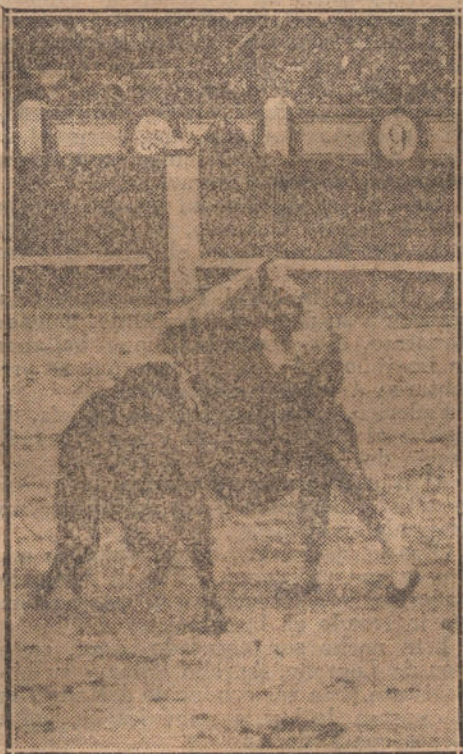
Una de las emocionantes verónicas de Carpio.

Volvió a Valencia, y terminó su carrera.