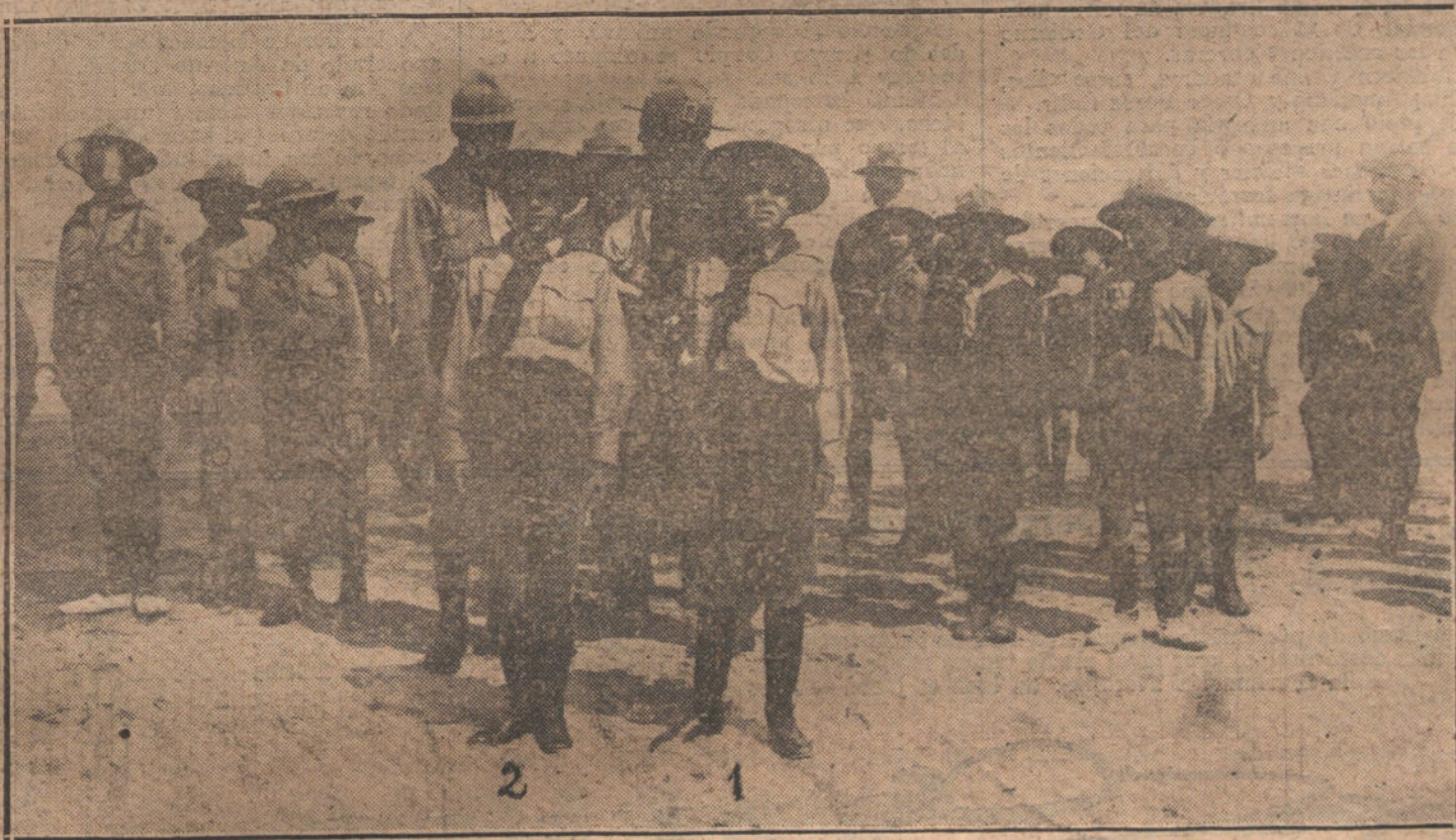
EL VERANO EN SANTANDER.—Sus Altezas el Príncipe de Asturias y el Infante Don Jaime (1 y 2) vestidos de exploradores durante su visita a los exploradores montañeses, acampados en los pinares del Sardinero.

En otro artículo comentando la ejecución de Mr. Casement y el fusilamiento de una señorita alemana en Marsella, demostraremos como para esos francofilos no tienen importancia las crueldades que cometen Francia e Inglaterra, aunque incluso se negan contra la misma España.