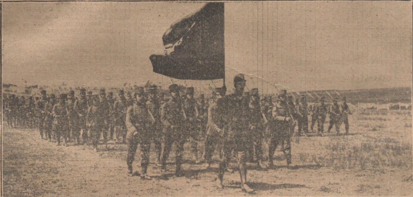
EL VERANO EN SANTANDER.—Las fuerzas de guarnición en Santander, desfilando ante el Rey, en el campo de la Albericia.