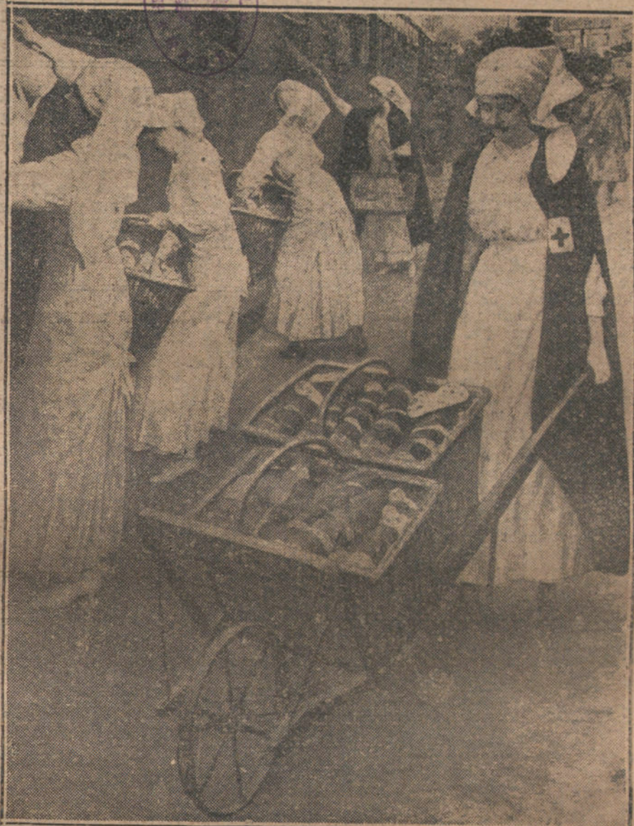
Enfermeras francesas repartiendo pan a los soldados al paso de un tren militar. (De un dibujo de Sabattier.)

En este folleto se dice, en primer término, que hasta ahora los aviadores aliados habían tratado de respetar la población civil trabajadora de los territorios ocupados por los alemanes. Pero que ahora la población se había hecho indigna de esta protección, porque estaba ganando su pan por su trabajo, en vez de cometer actos de «sabotaje» y de ser perezosos. Por este motivo, las naciones aliadas, completamente de acuerdo, habían decidido ahora que desde aquí en adelante no se limitarían en su acción por ninguna consideración de humanidad o de sentimientos. Después anuncia el folleto, a partir de 1 de Agosto, numerosos y violentos ataques aéreos, y concluye diciendo que todas las personas que en