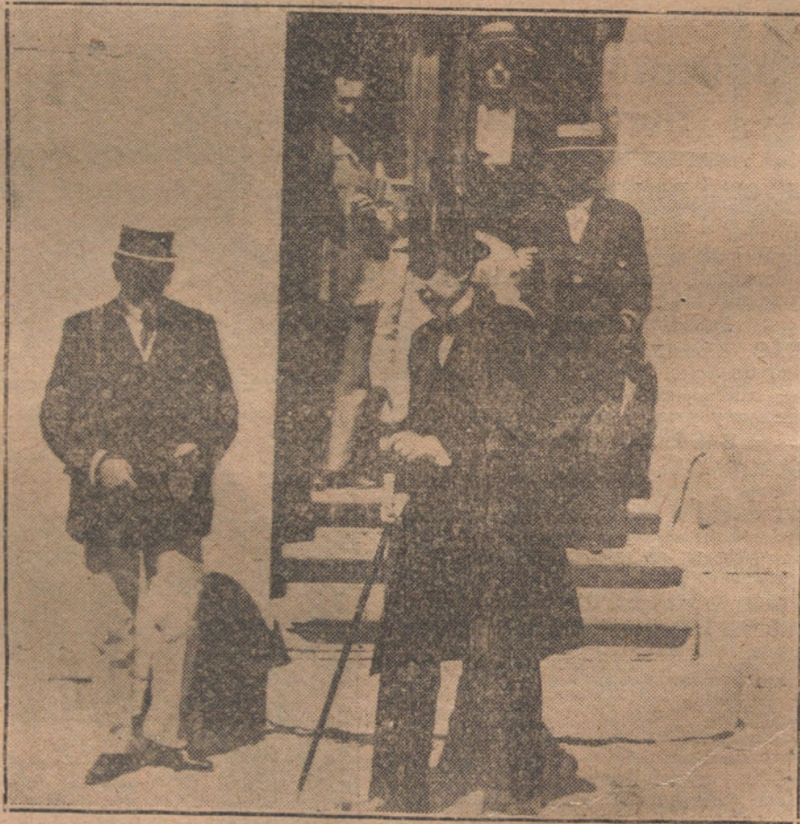
El Juzgado saliendo del Depósito judicial, después de presenciar la autopsia del cadáver del Sr. Ferrero.

cepción Jerónima, que le vendió los azulejos.