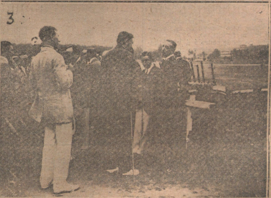
EL REY EN BILBAO.—Núm. 1, S. M. el Rey y los Infantes Don Carlos y Don Raniero en el «Ara», dirigiéndose á Bilbao.—Núm. 2, S. M. durante la visita á los Altos Hornos.—Núm. 3, S. M. el Rey conversando con algunos concursantes en el Tiro de Pichón.

á Las Palmas para entrar en un varadero y proceder á las más indispensables reparaciones.