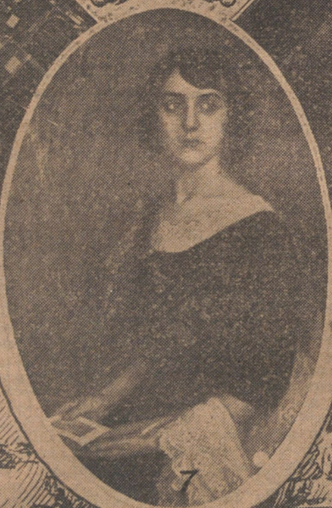
Núm. 1, Vista general de la entrada de la Exposición.—Núms. 2, 3 y 5, Aspecto de algunas de las salas donde se hallan expuestos los productos comerciales.—Número 4, Un ángulo del jardín.—Núm. 6, Una de las salas destinadas a Exposición de pintura.—Núm. 7, Cuadro de Julio Moisés, que figura en el Certamen.

n. XIII, de la Reina Doña Victoria Eugenia, del Infante Don Fernando de Baza y de D. Eduardo Saavedra.