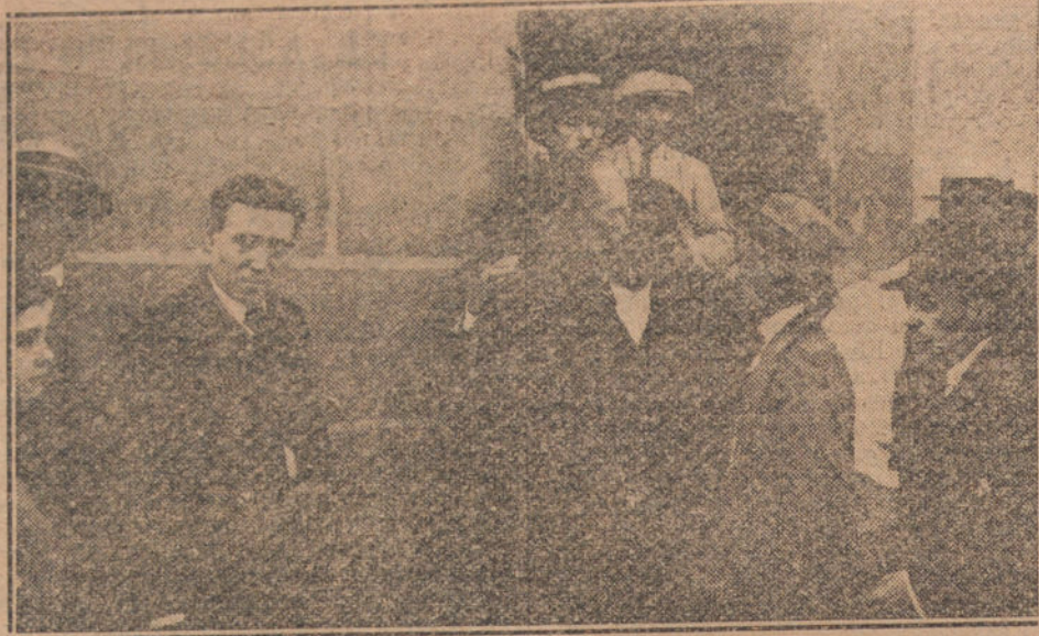
El cuñado del Sr. Ferrero abrazando a un sobrino suyo en la puerta del Depósito judicial.

El cadáver ha recibido cristiana sepultura en el cementerio del Este.