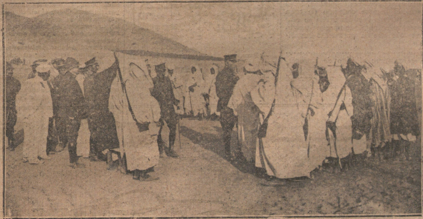
Moros de las cabilas de M'Talza y Beni-ben-Yahi saludando al general Jordana, para mostrarle su agradecimiento por la instalación de los pozos abiertos alrededor de la posición de Bala. (llanura de Garet).

¿Y tan demostrado! Como que si no hubiera otras razones más poderosas: