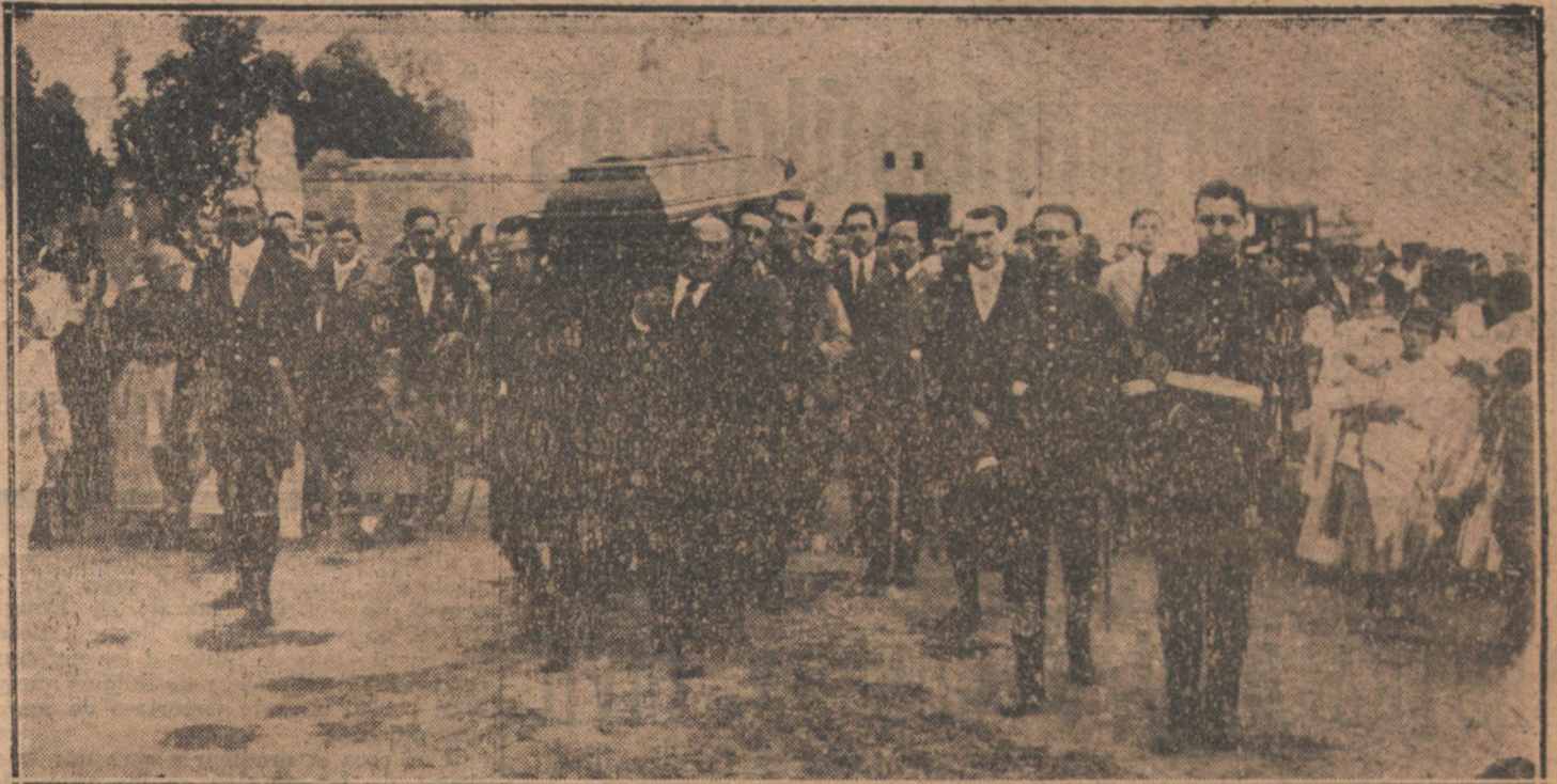
EL ENTIERRO DE FELIPE TRIGO.—La comitiva fúnebre saliendo del Depósito judicial.

Algo, sin embargo, tengo en planta. Uno de los autores de «La peseta enferma», aquella revista que en 1905 tuvo un éxito formidable, al que contribuyeron con su arte genial Loreto y Chicote, don José Pontes, me ha dado un libro, oportuno, gracioso, y que será un éxito tal, que diez temporadas serán pocas para agotar la obra. En él tengo mis esperanzas, las únicas concretas. Y si tam-