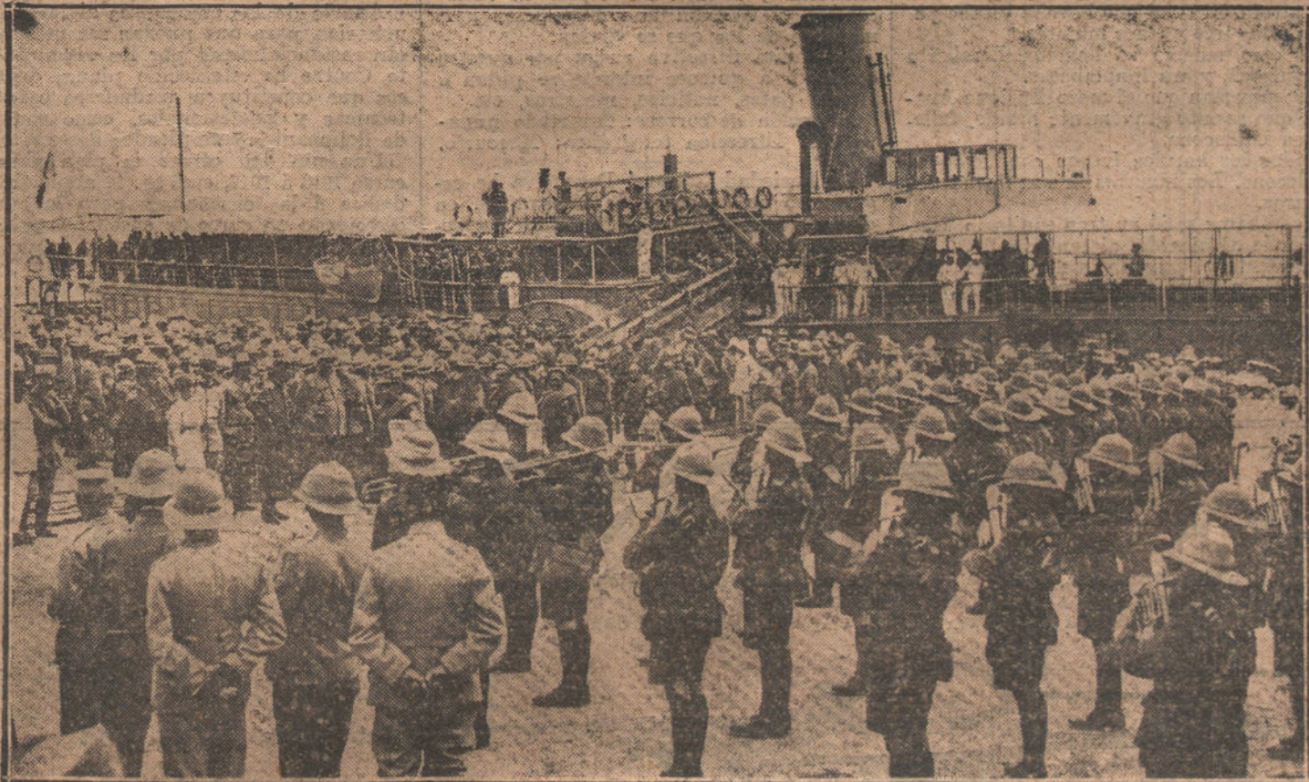
LA GUERRA EN LOS BALKAN ES.—Tropas rusas desembarcando en Salónica.