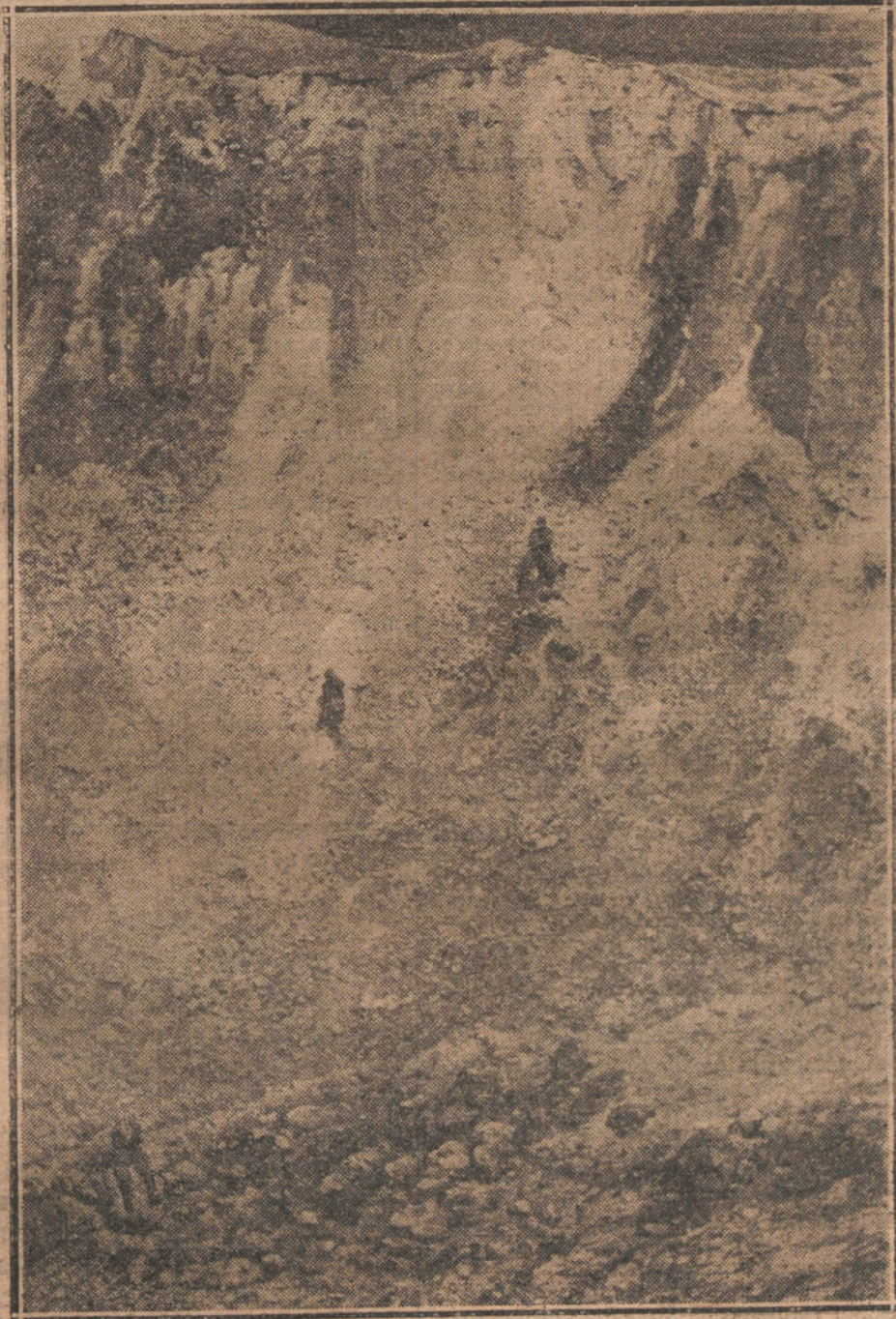
EL HORROR DE LA GUERRA.—Hoy producido por el proyectil de una mina alemana en las trincheras francesas.

festaciones. Pero esto significa precisamente un aumento de peligro, y á la vez una disminución de confianza en el Gobierno. No es difícil reconocer que los intervencionistas—sean los responsables ó los irresponsables—tienen la intención de evitar una alarma de la opinión pública, y que á un procedimiento violento prefieren una política prudente de aproximación a la Entente.