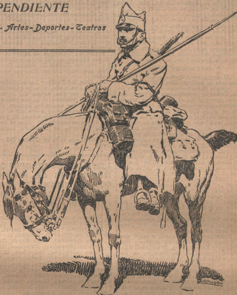
LOS NUEVOS BELIGERANTES.—Soldado romano de Caballería. (Dibujo de AGUSTIN)

El gran movimiento á favor de la neutralidad, iniciado tan espontánea como poderosamente, y apoyado por todos los verdaderos patriotas, ha tenido como consecuencia que los partidarios de los aliados y de la intervención sean ahora más prudentes en sus mani-