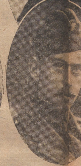
LA FAMILIA REAL RUMANA.—El Rey Fernando; su esposa, Maria, y su hija Elena; e Princesa Maria y el Príncipe