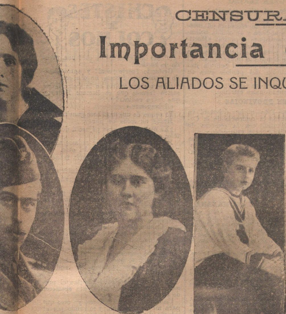
La Tsarina; el Príncipe Carlos, heredero del Trono (arriba, su esposa, Isabel); la Princesa María; y el Príncipe Nicolás.

LOS ALIADOS SE INQUIETAN POR LA TOMA DE TUTRAKAN