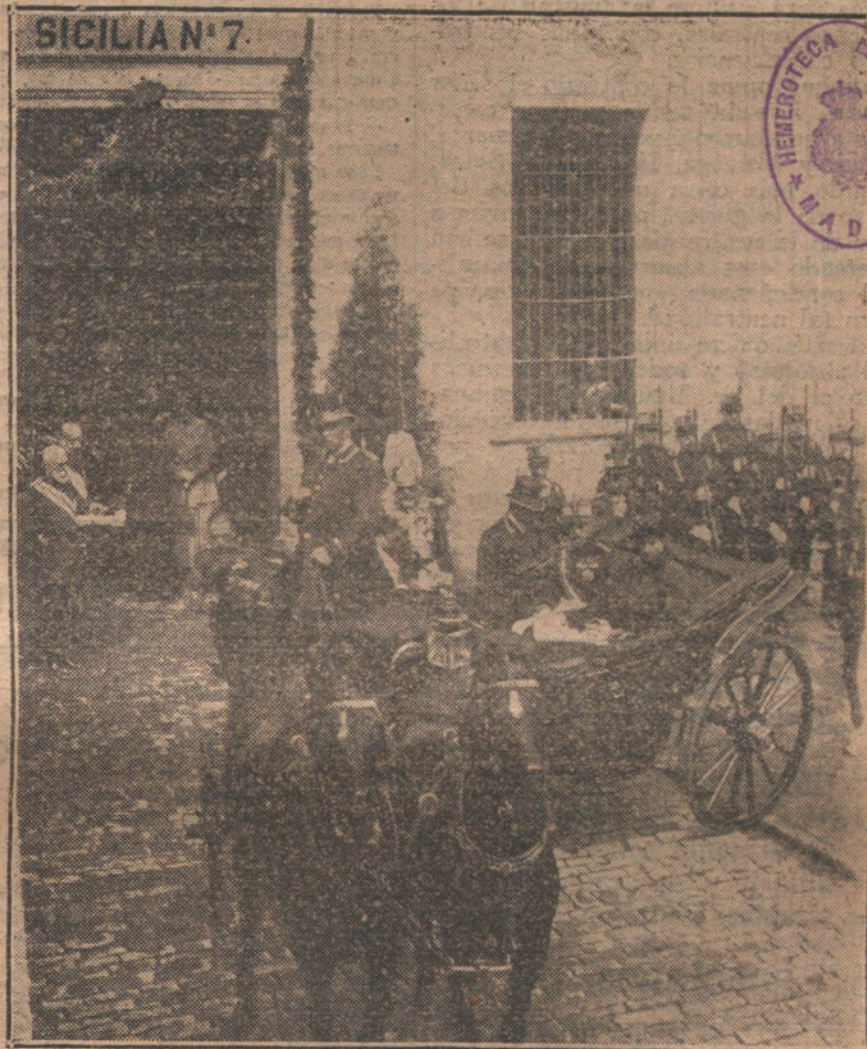
SAN SEBASTIAN—SS. MM. al salir de su visita al cuartel de San Telmo, donde se aloja el regimiento de Sicilia.

tivo de su orientación francófila, lo publica el órgano oficial del maurismo en letra bastardilla, para que no quede lugar á duda.