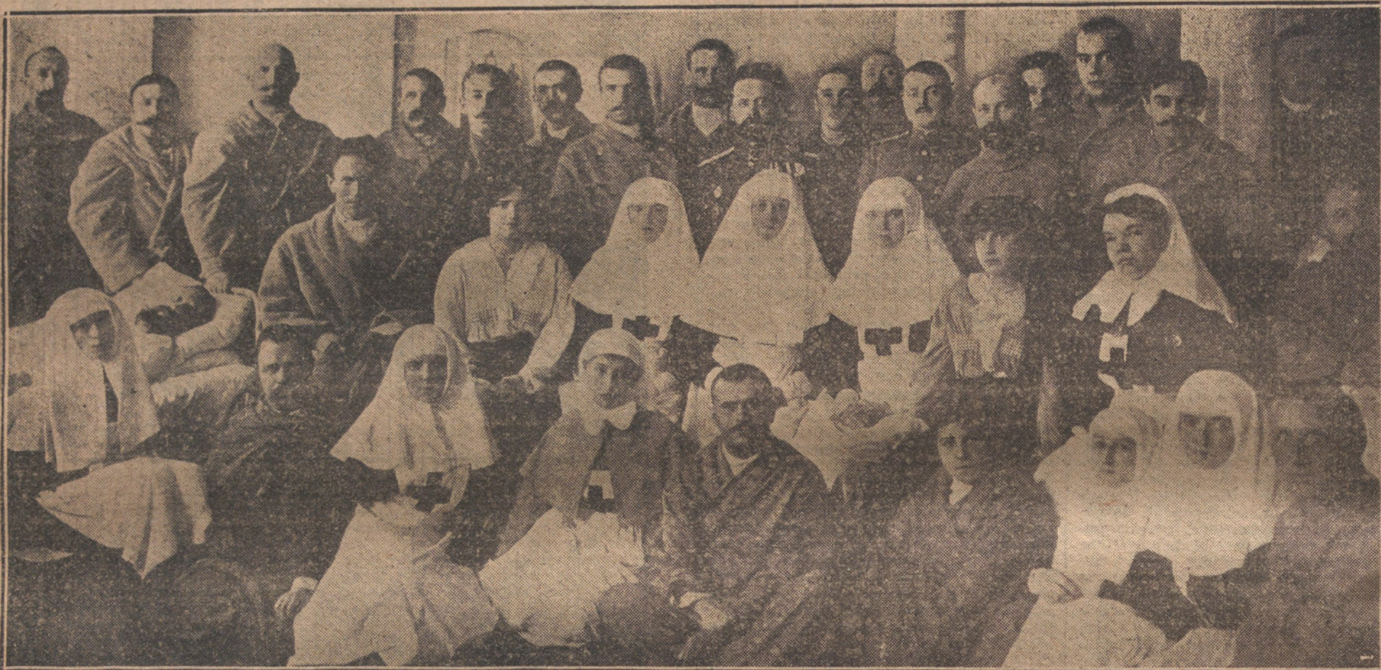
La Emperatriz Alejandra de Rusia, con sus hijas las grandes Duquesas Maria, Olga, Tatiana y Anastasia, en el hospital de heridos donde prestan sus servicios de enfermeras.

EL GABINETE GRIEGO PRESIDIDO POR ZAIMIS DIMITIÓ POR CAUSA DE LAS EXIGENCIAS DE LOS ALIADOS.— TODAS LAS NACIONES DE LA ENTENTE ENVIAN SU ORO A INGLATERRA.— GENERALÍSIMO RUMANO.— LOS SOCIALISTAS ITALIANOS CONTRA LA GUERRA.— INFORMES BULGAROS SOBRE LA OFENSIVA DE SARRAIL.— LA EXPLOSION DE BAYONA