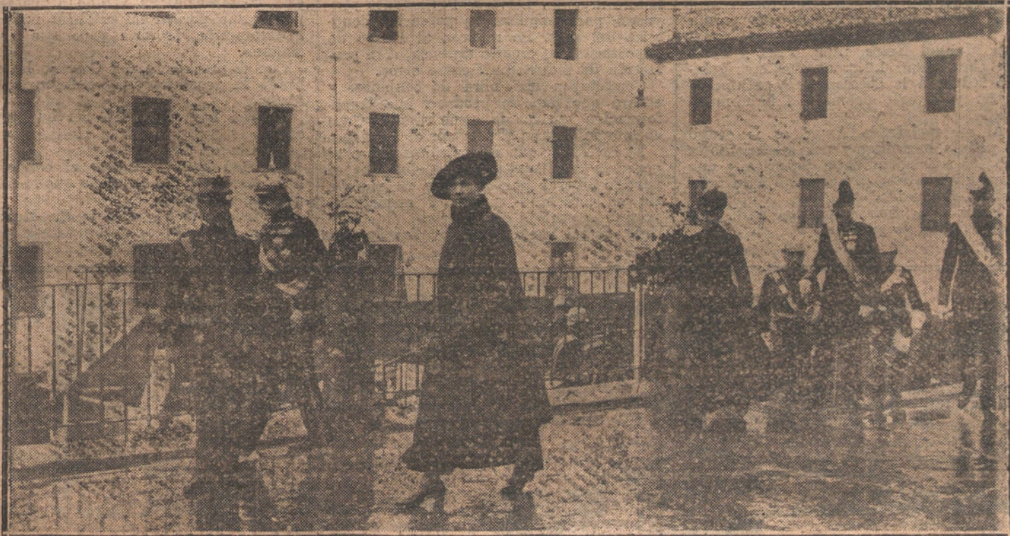
visita de los Reyes al cuartel de San Telmo, en San Sebastián.