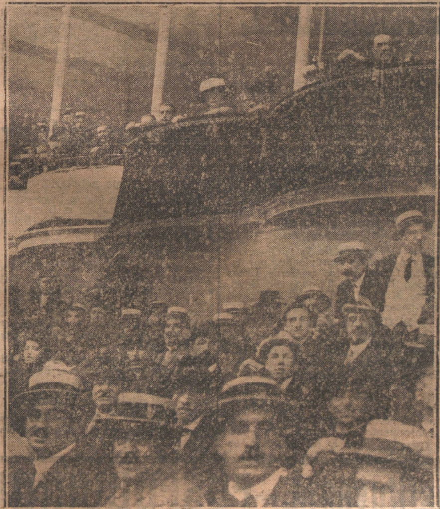
SAN SEBASTIAN. — La familia Real en el frontón del Hotel de Ville, durante el partido de pelota jugado ayer por la tarde a beneficio de la Prensa.

Venían de recorrer el Principado de Andorra, donde visitaron varias poblaciones.