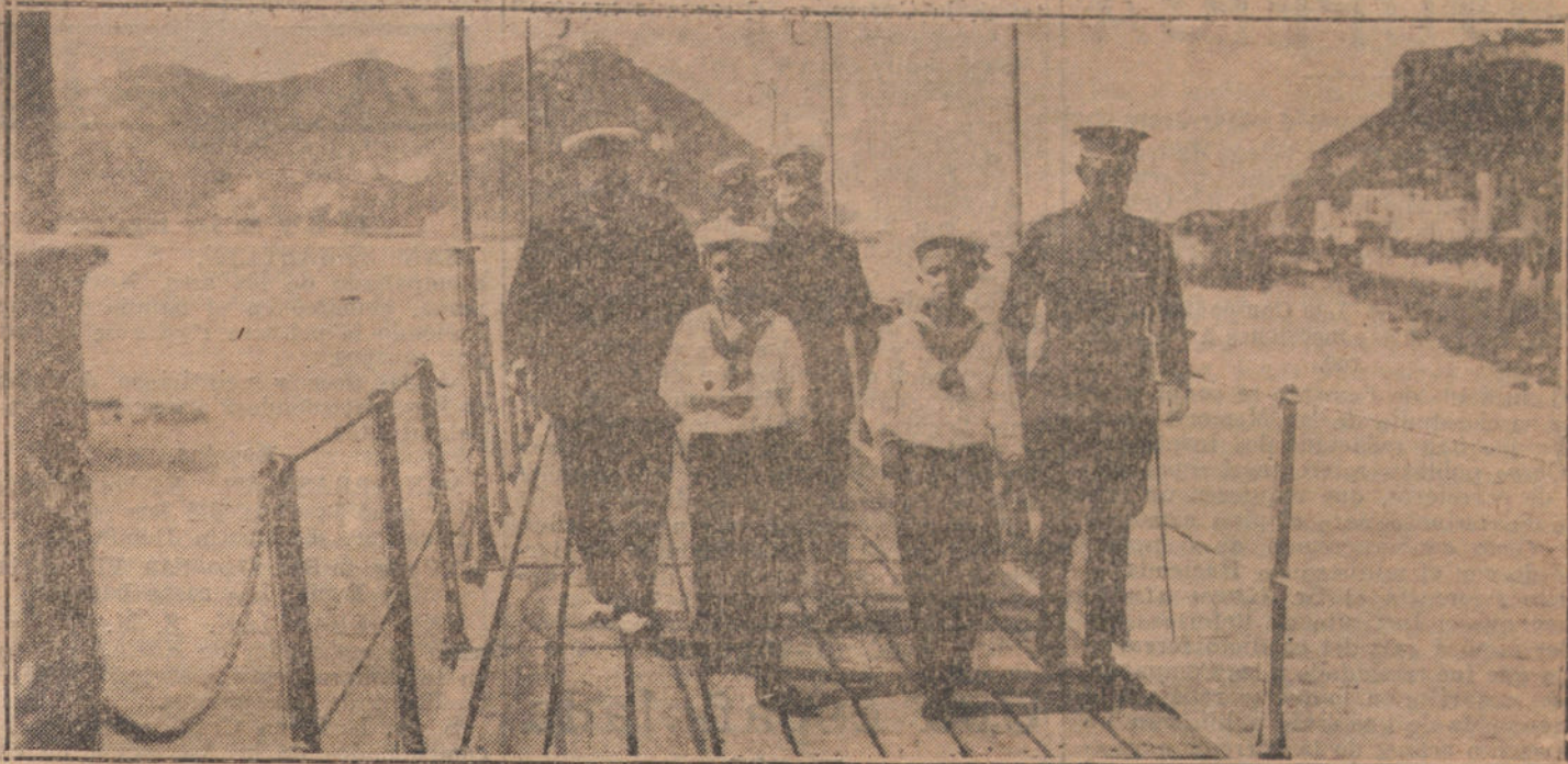
SAN SEBASTIAN. — Sus Altezas el Príncipe de Asturias y el Infante Don Jaime al desembarcar, después de haber presenciado las regatas en que tomó parte el Rey, ayer por la mañana.

D'Annunzio, que debió defender a la Belleza contra todo ataque, ha sido precisamente el que hizo salir al sol las espadas italianas, y a él habrá de deberle Venecia los destrozos que la causen las bombas enemigas. ¿Cómo explicará el autor de «La Nave» su cambio de postura? Todos