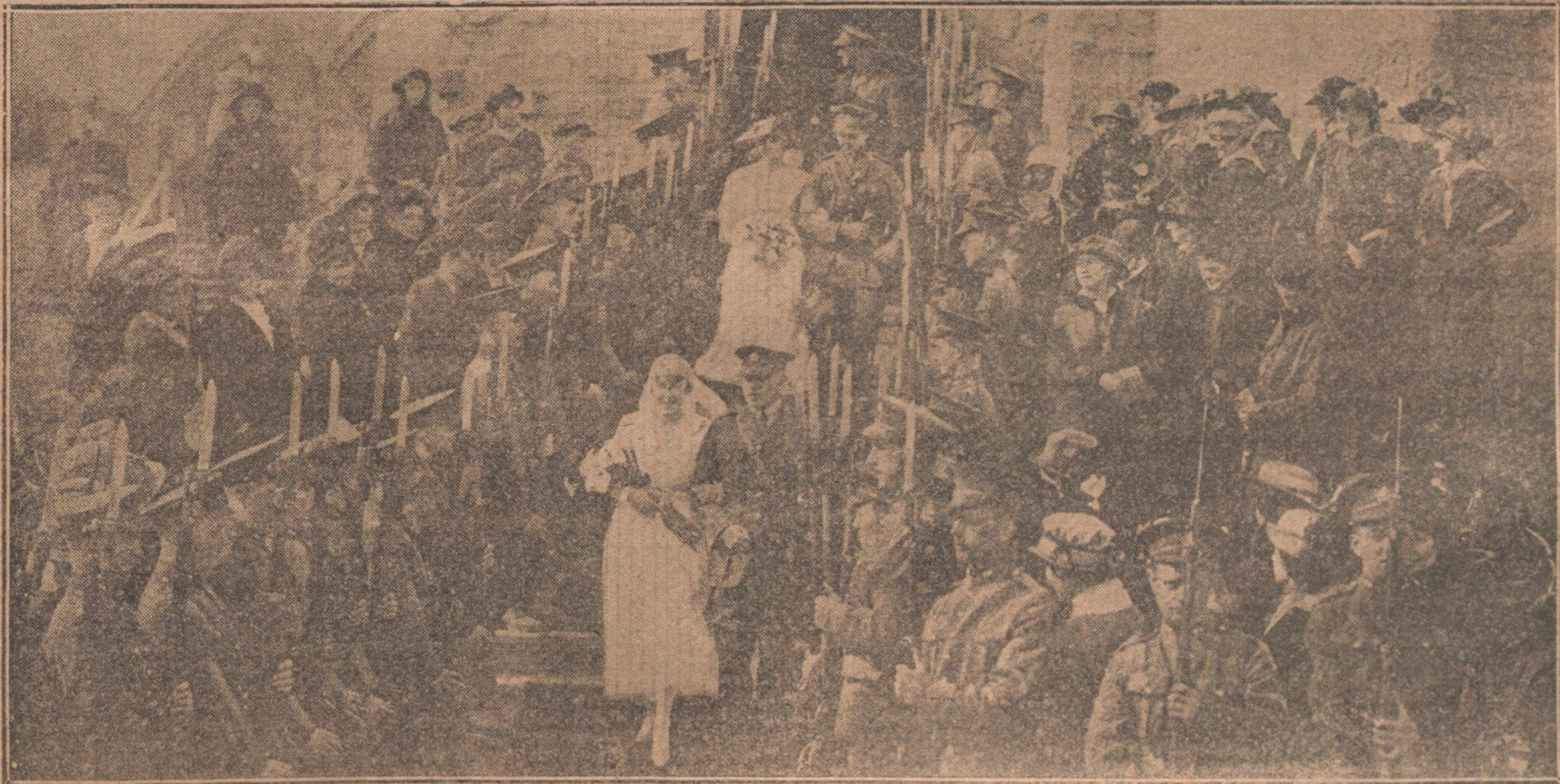
EN LA LINEA INGLESA.—Casamiento de un alto oficial, á cuyo acto asiste todo su regimiento.

Un despacho de San Malo comunica el hundimiento del vapor danés «Hans Tave», salvándose la tripulación.