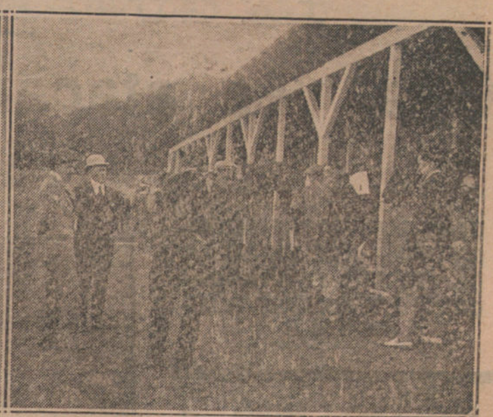
SAN SEBASTIAN.—Aspectos de una carrera de caballos.—S. M. el Rey hablando con su «jockey», que le ganó el primer premio en las carreras del viernes.—Salida de los caballos al terminar una carrera.—Don Alfonso visitando las caballerizas.