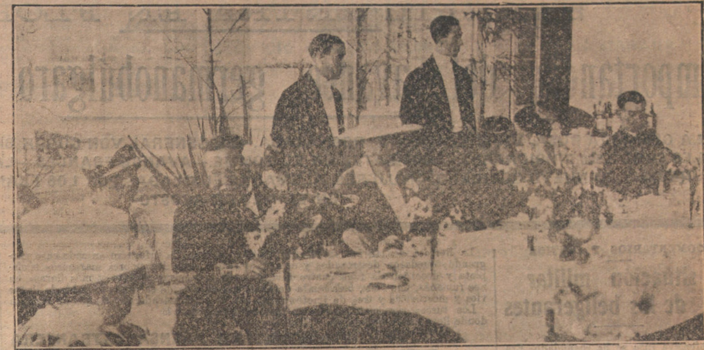
EL VERANO EN ZARAUZ.—SS. MM. los Reyes presidiendo el banquete celebrado después de las regatas San Sebastián-Zarauz.

¿Qué pueden importarle a Babilonia las ridículas palabras del creyente? ¿Qué co ha de hallar en Bizancio la exposición