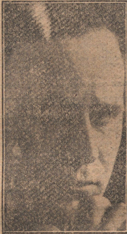
EL SEÑOR PSILANDER, notable primer actor de la compañía cinematográfica de la Casa Nordisk.