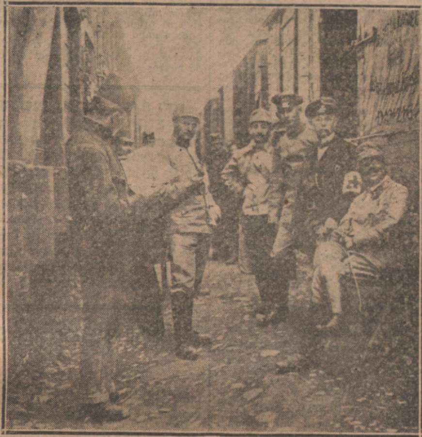
Soldados austrohúngaros en la población de Danzig leyendo la Orden del día.

Ahora se comprende la razón que asistía á los periódicos aliadofilos pa-