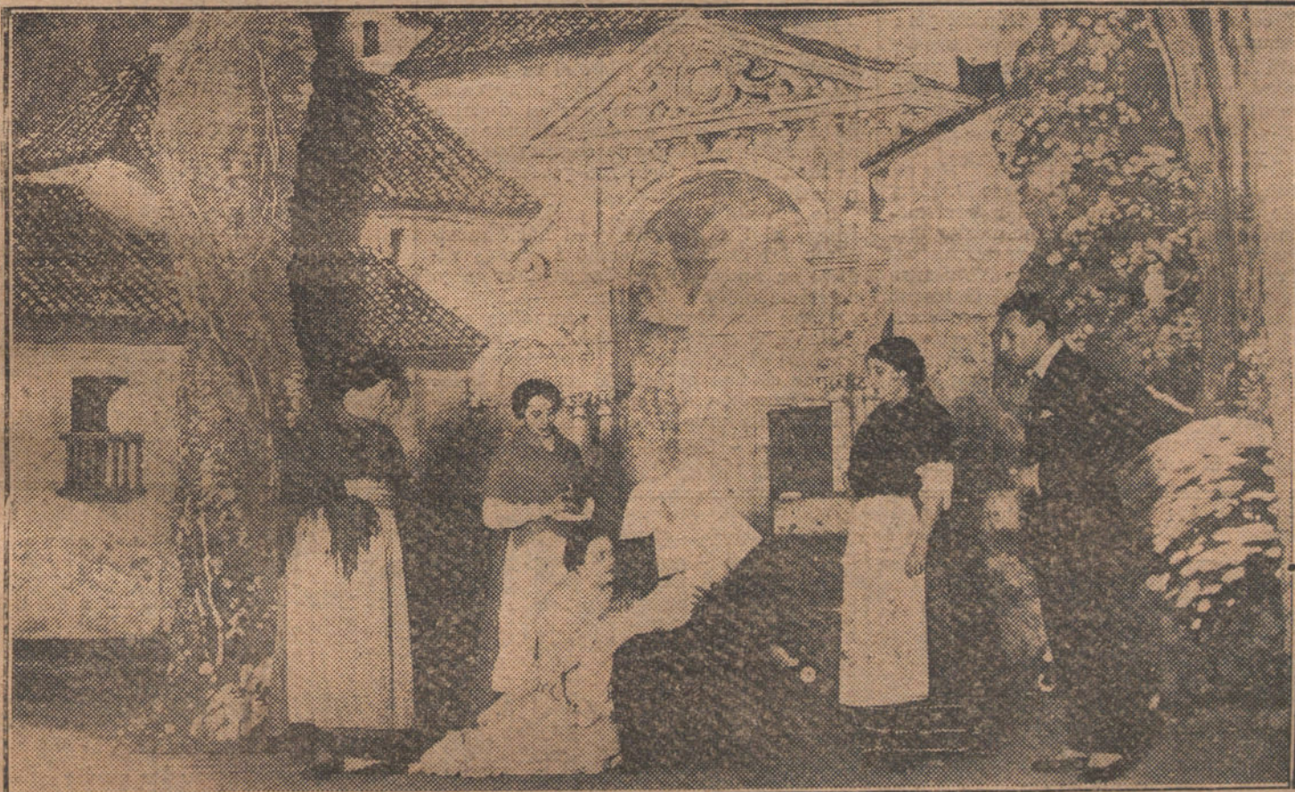
Una escena del segundo acto de «El reino de Dios», comedia de Martínez Sierra, estrenada anoche en el teatro de Eslava.

España señaló en 1860 linderos estrechos; el penal de Ceuta limitó el espíritu de leyes que debieron ser expansivas y protectoras, manumitiendo la iniciativa particular; Tánger internacional invade moralmente la cabila fronteriza; espíritus de cierta presvicia política quieren imponer sus voluntades en una audacia irreflexiva e inconsciente, creando hoy Aduanas, mañana rebeldía, otra vez consecuentemente alejamiento... y nunca recorda