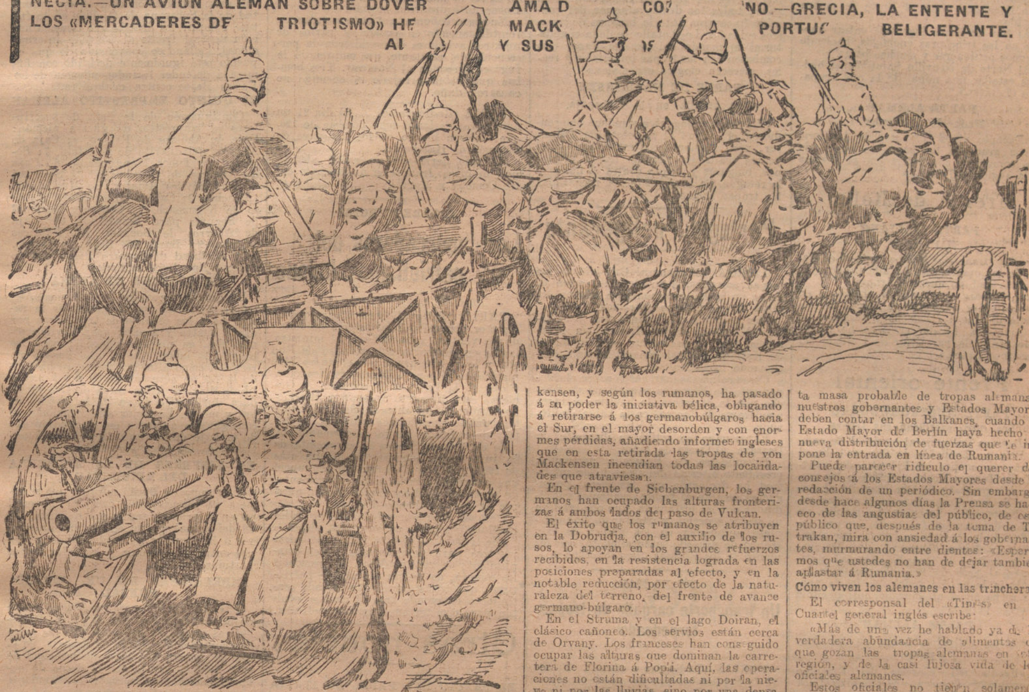
Artillería alemana dirigiéndose a la línea de fuego en el frente rumano. (Dibujo de AGUSTIN.)

LA GUERRA EN RUMANIA. — RECONQUISTAS A LA ROHUNGARA EN TRANSILVANIA. — BOMBARDEO DE VENECIA. — UN AVION ALEMAN SOBRE DOVER. — GRECIA, LA ENTENTE Y LOS «MERCADERES DE TRIOTISMO» HE AL MACK Y SUS CO? NO — PORTU? BELIGERANTE.