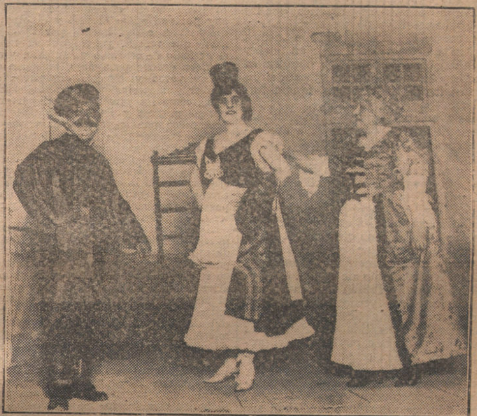
Una escena de «La Europea», obra que se estrena esta noche en el teatro Martín.

El expediente del campo exterior de Ceuta ha sufrido, y sufre, una peregrinación dolorosa y estéril. Ha rodado por los ministerios, ha soportado la pesadumbre de centenares de informes opuestos, se ha extraviado á veces durante largo tiempo en los archivos polvorientos de las oficinas, ha salido otras á la luz pública para exponer ante el Consejo Supremo su abultada y hue-