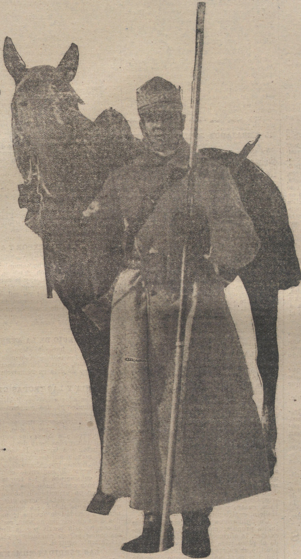
LOS NUEVOS FACTORES DE LA GUERRA Lancero del Ejército rumano.

submarino alemán en aguas mediterráneas, hundiéndose en menos de un minuto a un transporte de fuerzas aliadas, está sintetizado cuanto ocurrió en la jornada última.