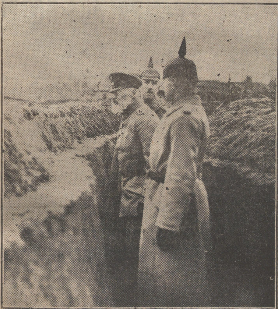
EN EL FRENTE OCCIDENTAL.—El Principe Leopoldo de Baviera visitando las trincheras alemanas de la primera línea. (Fot. HOFFER.)

á prodigar á Wilson ditirambos, confiando en que no habrá de apresurarse á poner en práctica las medidas indicadas. Ahora no vale empujar, porque los Estados Unidos no se cruzarán de brazos ante el empujón. Si acaso, algunas notas; palabras, argucias, sofismas, dilaciones, á ver si entretanto cambian las circunstancias.