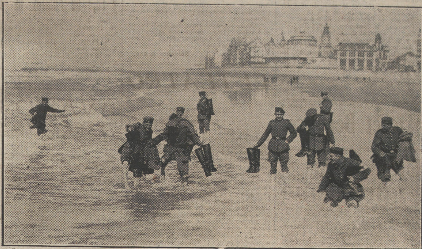
LA VIDA EN CAMPAÑA.—Soldados alemanes bañándose en las playas de Flandes.

guerra germanodanesa en 1849 como artillero en el regimiento de Schleswig-Holstein, y gracias a la ayuda que le prestaron las autoridades militares y también algunos particulares, consiguió llevar sus ideas al terreno de la práctica en 1850, en el puerto de Kiel, mediante la construcción de un submarino. El objeto de esta nave era atacar los buques daneses que cerraban entonces los puertos alemanes; pero no llegó a utilizarse para ello, pues que al hacer ciertas pruebas en 1851, el submarino se perdió, aunque los tripulantes consiguieron salvarse.