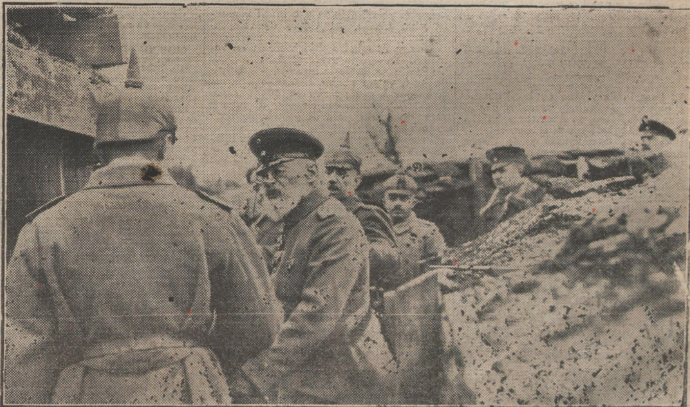
LOS JEFES DE ESTADO EN EL FRENTE DE BATALLA.—El Príncipe Leopoldo conversando con oficiales alemanes en las líneas del frente occidental