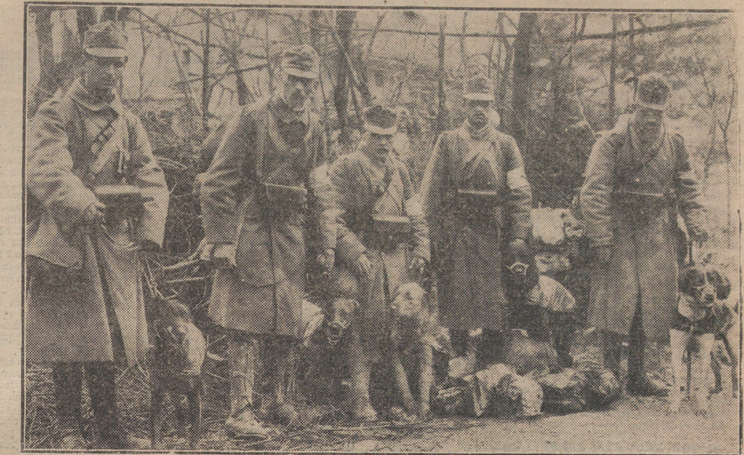
LA LUCHA EN ORIENTE.—Soldados de Sanidad austrohúngaros con sus perros amaestrados.

«¿Cómo este pueblo, rico, próspero, fuerte en otros tiempos, ha llegado en los modernos al aniquilamiento y la ruina?»—pregunta «Azorín» espantado al contemplar un cadáver de ciudad. Luego hace (véase «Antonio Azorín») una enumeración de las causas que se le ocurren. Aquel pueblo es un pueblo de señores que se apartan de la tierra, mal cultivada por ese apartamiento, sin agua y sin labor. El centralismo ha llenado ese pueblo de esquilmadores funcionarios. La ganadería y la industria también se han ido poco a poco abandonando. Los hidalgos no se ocupan de esos menesteres. Las plagas, singularmente las de langosta, devoran las cosechas. La amortización pone en pocas manos muchos bienes. La burocracia y