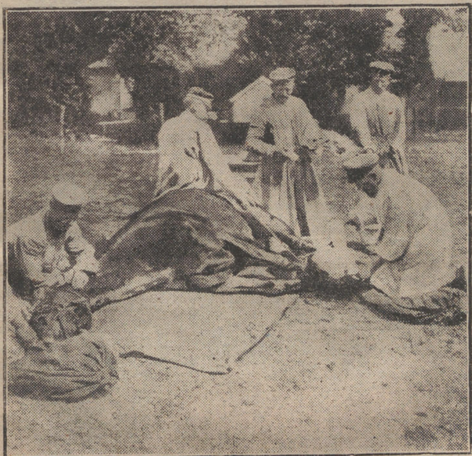
LAS NECESIDADES DE LA GUERRA. —Ambulancia alemana en el teatro occidental de operaciones para la asistencia de los caballos heridos.

Consistía su plan, según el discurso de von Bethmman Hollweg, en enriquecerse, sin arriesgar su fortuna. Bratiano jugaba con el dinero ajeno. Por eso en el primer año de guerra, después de la caída de Lemberg, firmó un Convenio de neutralidad con Rusia, a espaldas del Soberano. Después de la ocupación de Przemysl fracasaron las negociaciones con Rusia, en las que Rumania pedía, no sólo la Bukovina, sino