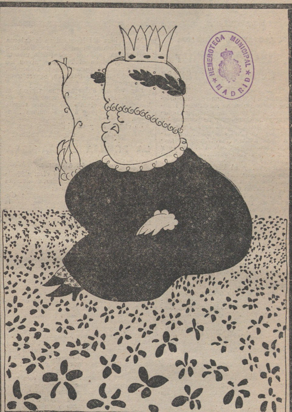
LA CONDESA DE PARDO BAZAN , a la que próximamente se tributará en Galicia un gran homenaje.