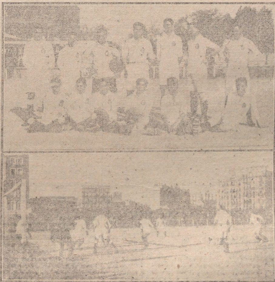
EL PARTIDO DE FOOT-BALL DE ESTA TARDE.—Arriba, el equipo del Real Club Fortuna, de Vigo, que ha jugado con el Madrid F. C.—Debajo, un momento interesante del partido.

Ministerio de Hacienda, de 9 a 14. Biblioteca Nacional, de 8 a 14.