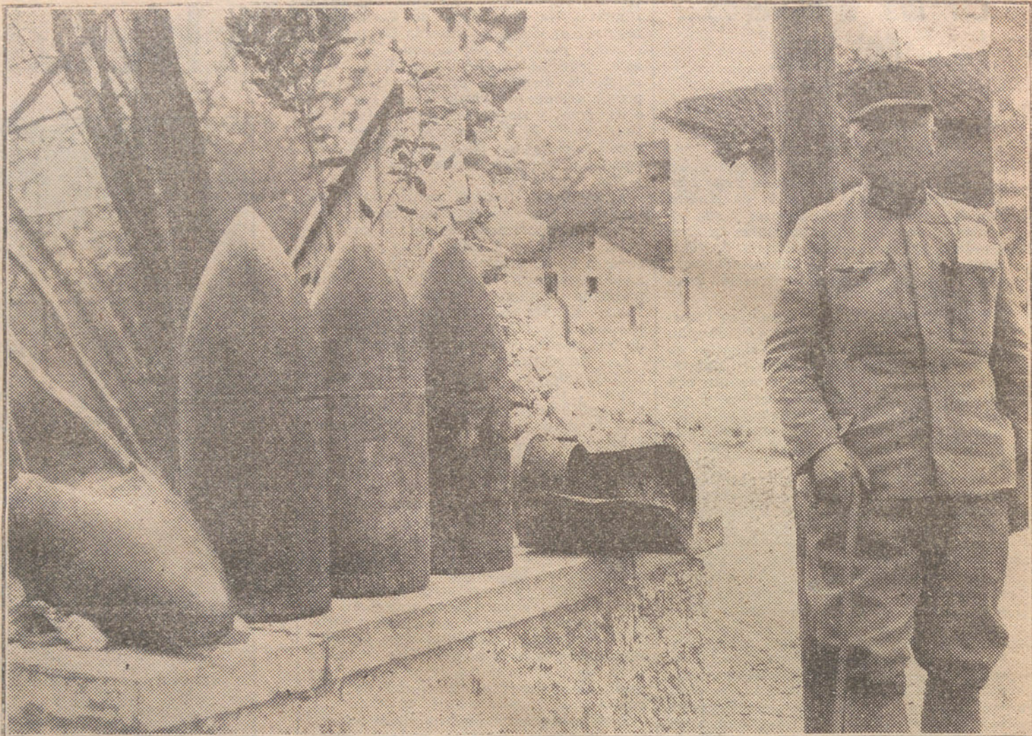
LA LUCHA EN EL FRENTE ITALIANO.—Colección de granadas italianas, sin estallar, recogidas por los austrohúngaros.