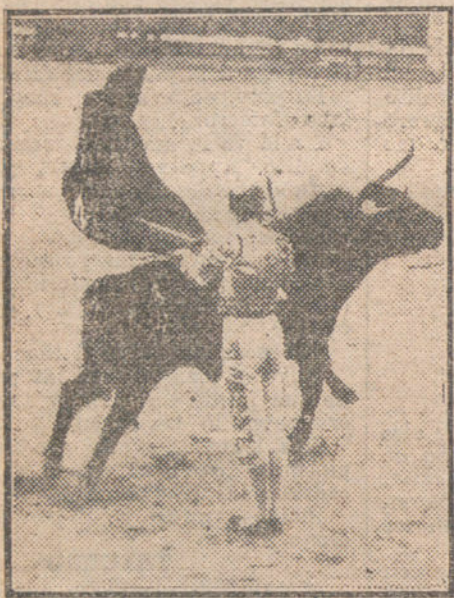
El Gallo en la magnífica faena de muleta a su primero.

Al salir la tanda de picadores la patrioquia protesta, y se mete con el honrre Camero.