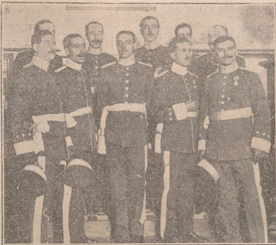
Los nuevos capitanes de Estado Mayor, á los que ayer tarde fué impuesto el fajín.

Yo recuerdo, en los días más amargos para Francia, haber visto un hermoso dibujo; no era la burla amenazadora, ni el odio encarnizado...; un engranaje recogía en el campo de batalla heridos de ambos Ejércitos; sus horribles muecas, sus