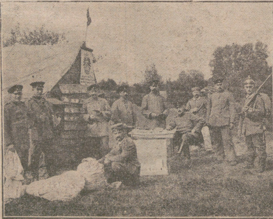
Estación del correo alemán de campaña, establecida en el frente occidental.

La Policía busca a las personas que en el hotel de Roma comieron con Grau el pasado miércoles.