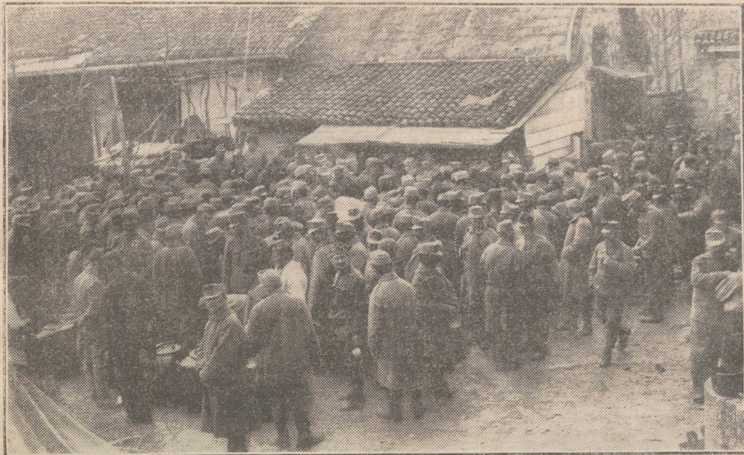
LA LUCHA EN EL FRENTE ITALIANO.—Reparto del rancho a las tropas austrohúngaras de las primeras líneas del Isonzo.