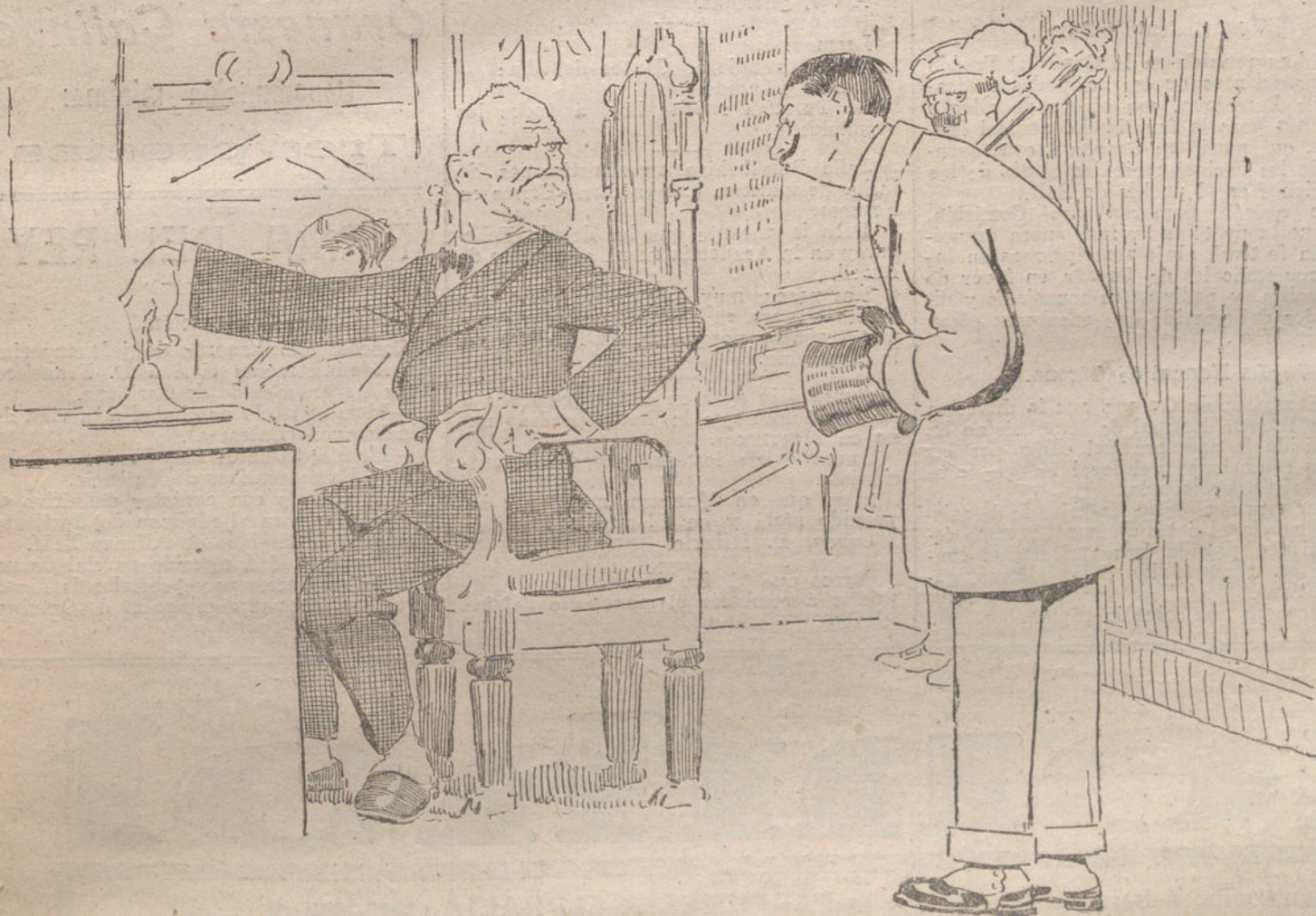
LAS ECONOMIAS EN EL CONGRESO

Los proyectos serán debatidos con amplitud, meticolosa y razonadamente; pero si prosperan los consejos del Sr. Alba y los demás oradores secundan la actitud del Sr. Cambó, de este Parlamento podrá salir una obra nacional completa.