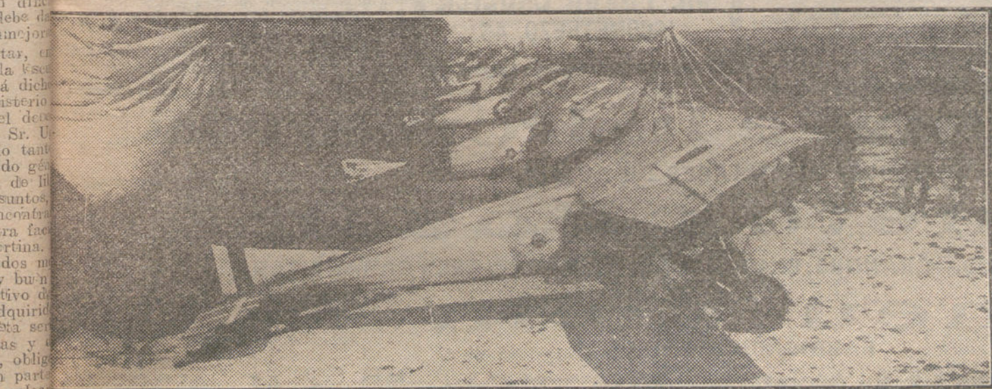
Aeródromo inglés de campaña en el frente occidental de operaciones.

El trofeo principal de esta carrera es una preciosa copa, la cual la obtendrá la sociedad a que pertenezca el corredor que se clasifique en menor tiempo, descontada la ventaja que se le haya concedido, cuyo corredor ganará una medalla de oro. Además se conceden varias medallas de oro, plata y bronce, donadas