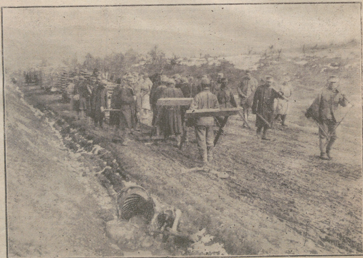
LA LUCHA EN ORIENTE.—Tropas austrohúngaras construyendo un ferrocarril militar en la región de Galicia.