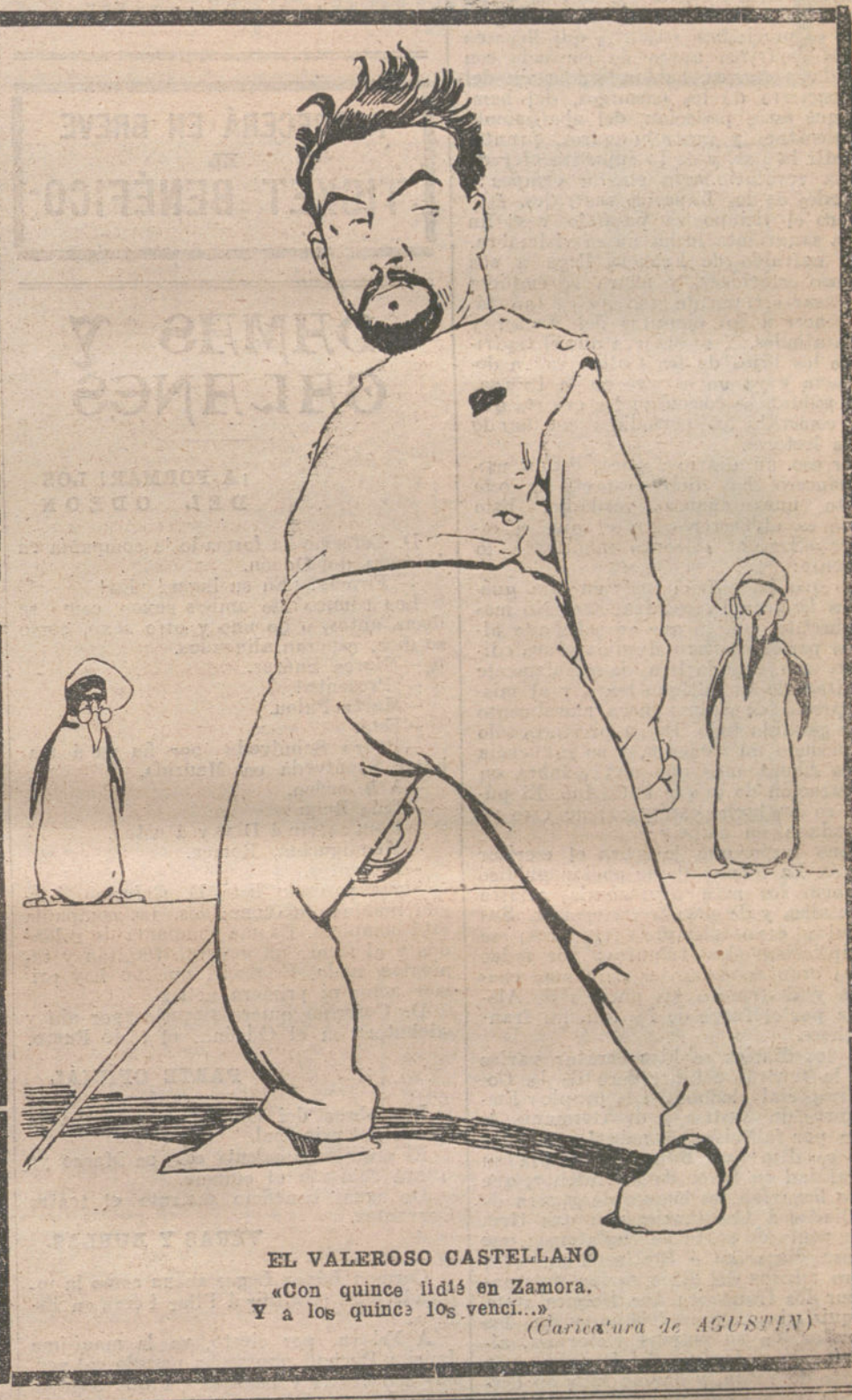
EL VALEROSO CASTELLANO

—Enséñeselo, pues, desde ahora á los que prefieren un vocablo francés escueto y sin imagen alguna para los españoles, á vuestras voces, que todas nacieron en el horno brillante y encendido de la fantasía. Y cuando le