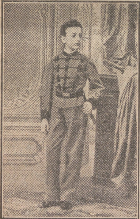
GABRIEL D'ANNUNZIO a los diez años, cuando estudiaba en Prato.