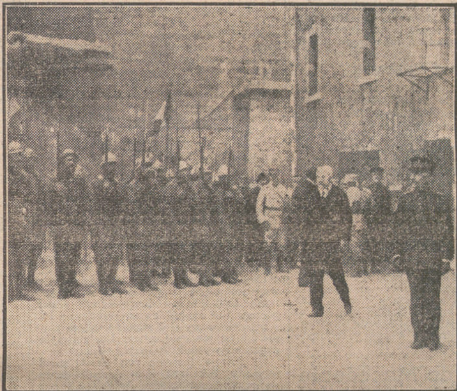
LA LUCHA EN VERDUN.—El Presidente de la República francesa revistando la guarnición de los fuertes.

Hay que confesarlo, porque es la realidad de la hora actual, que Alemania, toda Alemania, está estrechamente unida á su Emperador en una docilidad obediencia y cordial. Debemos estar convencidos de que en la Alemania del día todo es «imperial», absolutamente todo, hasta en la nueva oposición liberal que el Kaiser nos hace ver y comprender.»