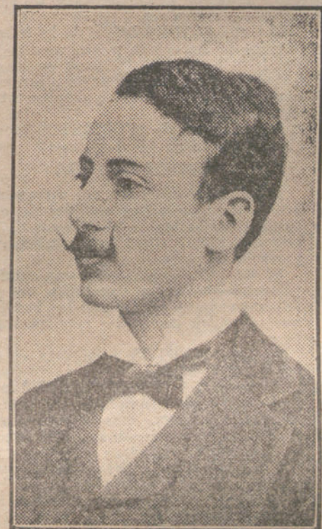
El poeta á los veinticinco años.

Esta obra, adaptación de un «vaudeville» de Athis, no fué del agrado del público, el cual cometió toda clase de injustificadas groserías durante la representación. Nos parece bien la protesta y nos hubiera parecido mejor que la gente la exteriorizase de una manera educada, con el silencio ó con el abandono del local, y no con la coñ y el relincho. El espectador debe respetar á los autores, aunque se equivoquen; á los artistas, al resto de los espectadores y á sí mismo.