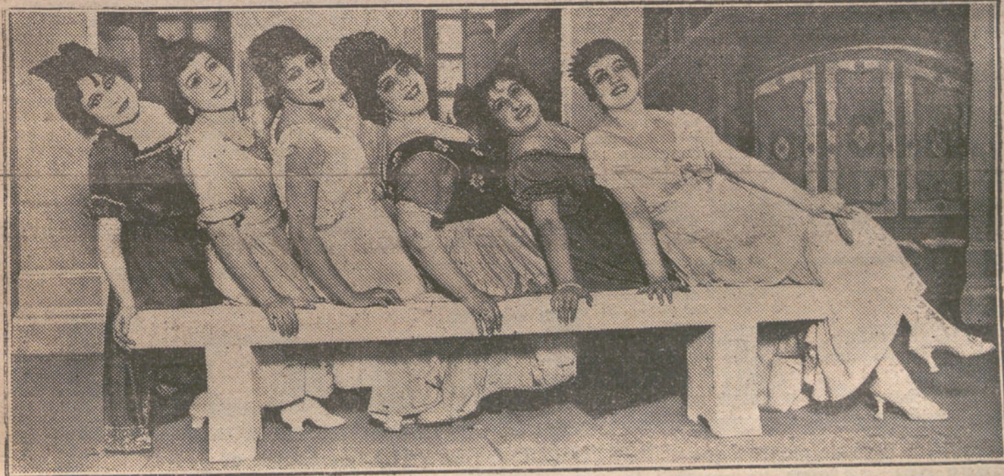
Una escena de «Marcia Hotel», de Gonzalez del Tero y Padilla, que se estrenó esta noche en Martín.

digan que para qué detenerse en quisquillas de galicismos y de purismos, les pregunta usted: ¿No se trata de ser artista de la palabra, esto es, de jugar con ella, de evocar imágenes? Pues por eso se condenan los galicismos, porque son voces que ni dicen nada á los ojos de los españoles; ni tienen raíz española á la cual los ojos de la imaginación los reduzca hallando en ella alguna imagen y obra de la fantasía. Julio Cejador.