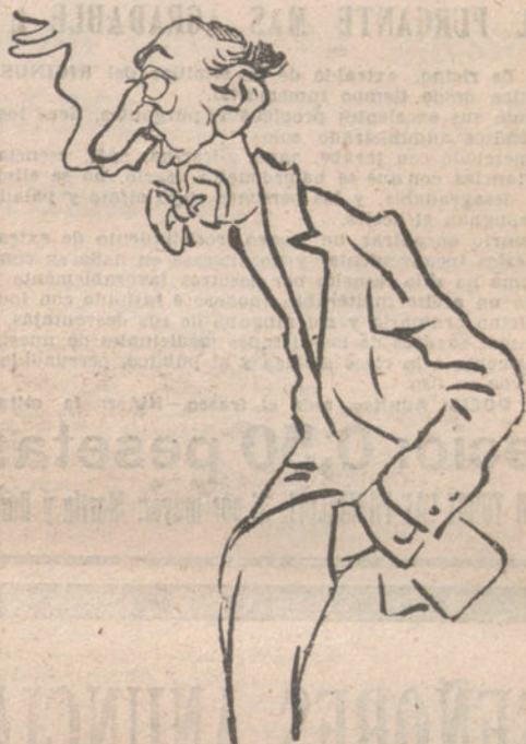
EL CONDE B. NEGRONI, uno de los mejores directores artísticos italiano para las grandes films. (Caricatura publicada por «Excelsior».)

En vista de que todas las ofertas eran rechazadas por Charlot, la Essanay pensó