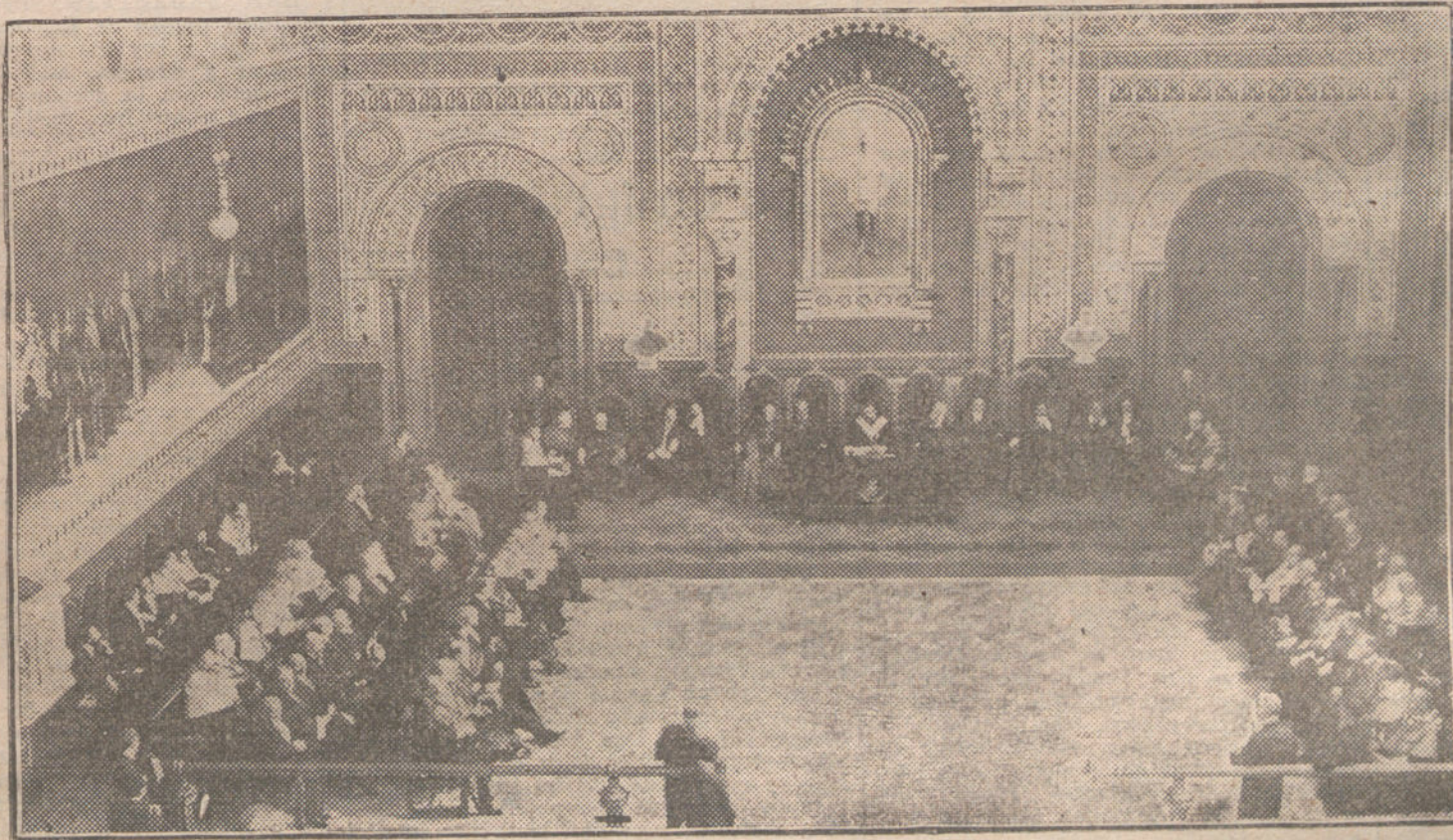
EL NUEVO CURSO.—Aspecto del paraninfo de la Universidad de Barcelona durante la solemne apertura del curso.