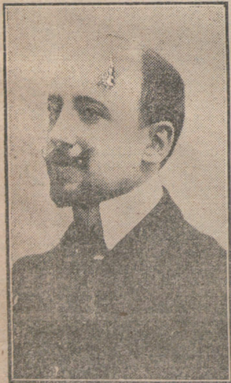
GABRIEL D'ANNUNZIO en la actualidad.

Te enviaré, pues, una breve noticia de mi traducción, y empezaré por decirte que nunca quise traducir, unas veces, las más, por respeto a mí mismo, otras, por sagrada veneración hacia el original y siempre por creer que nuestro teatro—el más vivo del mundo—no ha menester de traducciones. «La figlia di Yorio» ha sido una excepción: se trata, en primer lugar, de una obra mundial, digna de ser conocida en todos los idiomas, como algunas de nuestro teatro clásico y aun del contemporáneo (por allí andan unos dramas de Galdós, de Benavente y de Valle Inclán que no me dejan mentir); después, si yo no me atrevía, iba a verse defraudada la buena voluntad de Margarita Xirgu, entusiasta de la protagonista, ya que otros, menos locos que yo, renunciaron a la empresa, que la notable actriz decidió a confiarme, acaso reparando en mi apellido y en mi familiaridad con el italiano, lengua de mi padre, en la que pedí las primeras golosinas y los primeros juguetes durante la época de mi niñez, que hoy tan lejana y tan dulce me parece. No quiero decirte con esto que conozca el idioma del Dante; me es, eso sí, tan cómodo para hablar y mal-escribir como el castellano; pero ni el castellano conozco, y el estilo de esta carta es ya buen botón de muestra. No hay, pues, vanidad en mi declaración: saber francés ó italiano está al alcance de cualquier mozo de hotel, y no son idiomas para gentes superiores, como el alemán, que es habla excelsa de ateístas, filósofos y coroneles.