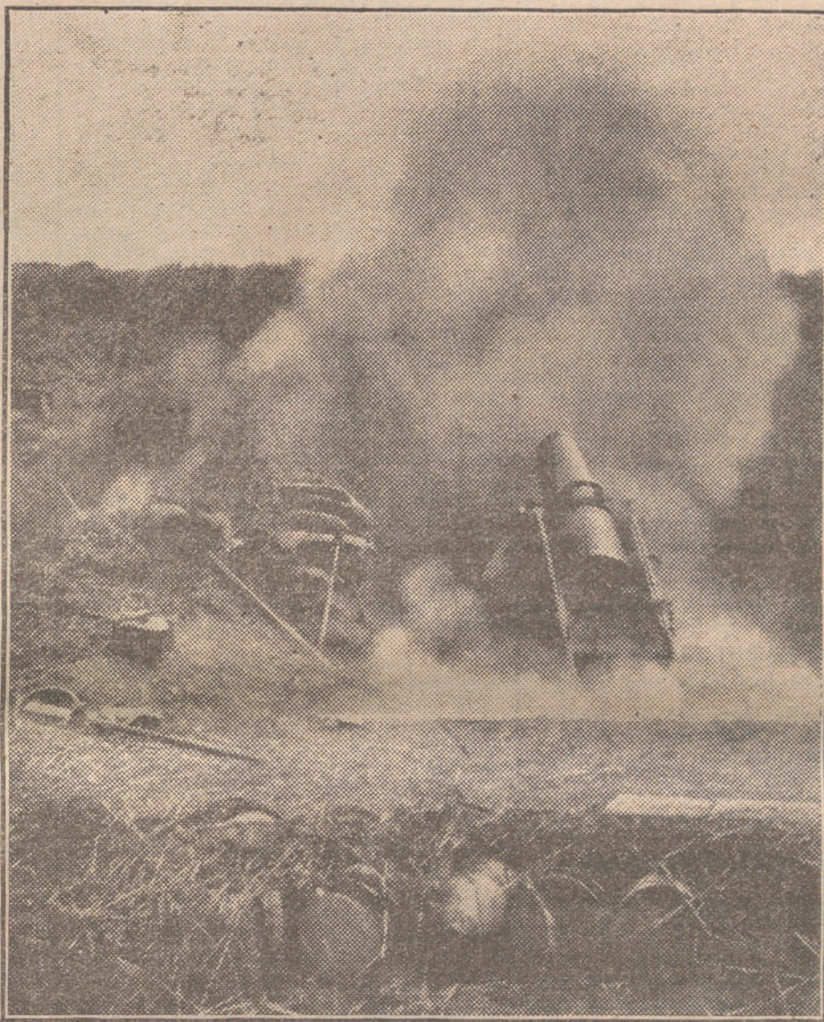
EN EL FRENTE OCCIDENTAL. — Mortero francés disparando.

NUMERO DEL TELEFONO DE LA ADMINISTRACION DE «LA TRIBUNA» (PLAZA DE CANALEJAS, 6): 5.551