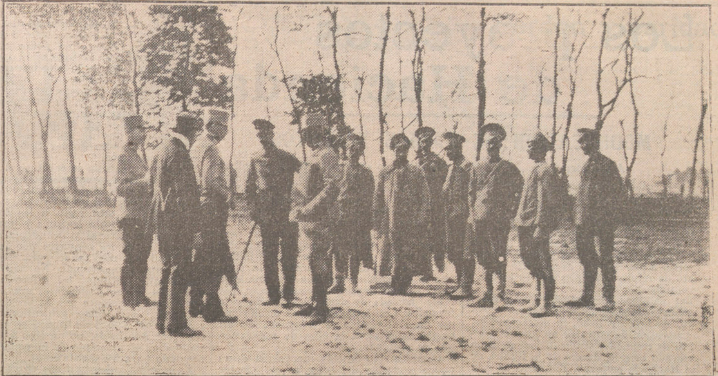
LA LUCHA EN ORIENTE.—Cosacos de Oremburgo y Tonar hechos prisioneros por los austrohúngaros.

Varios periódicos piden que se extremen las medidas para el hallazgo de los autores del crimen del berranco de Angaitura y otros, que la opinión teme que queden impunes.