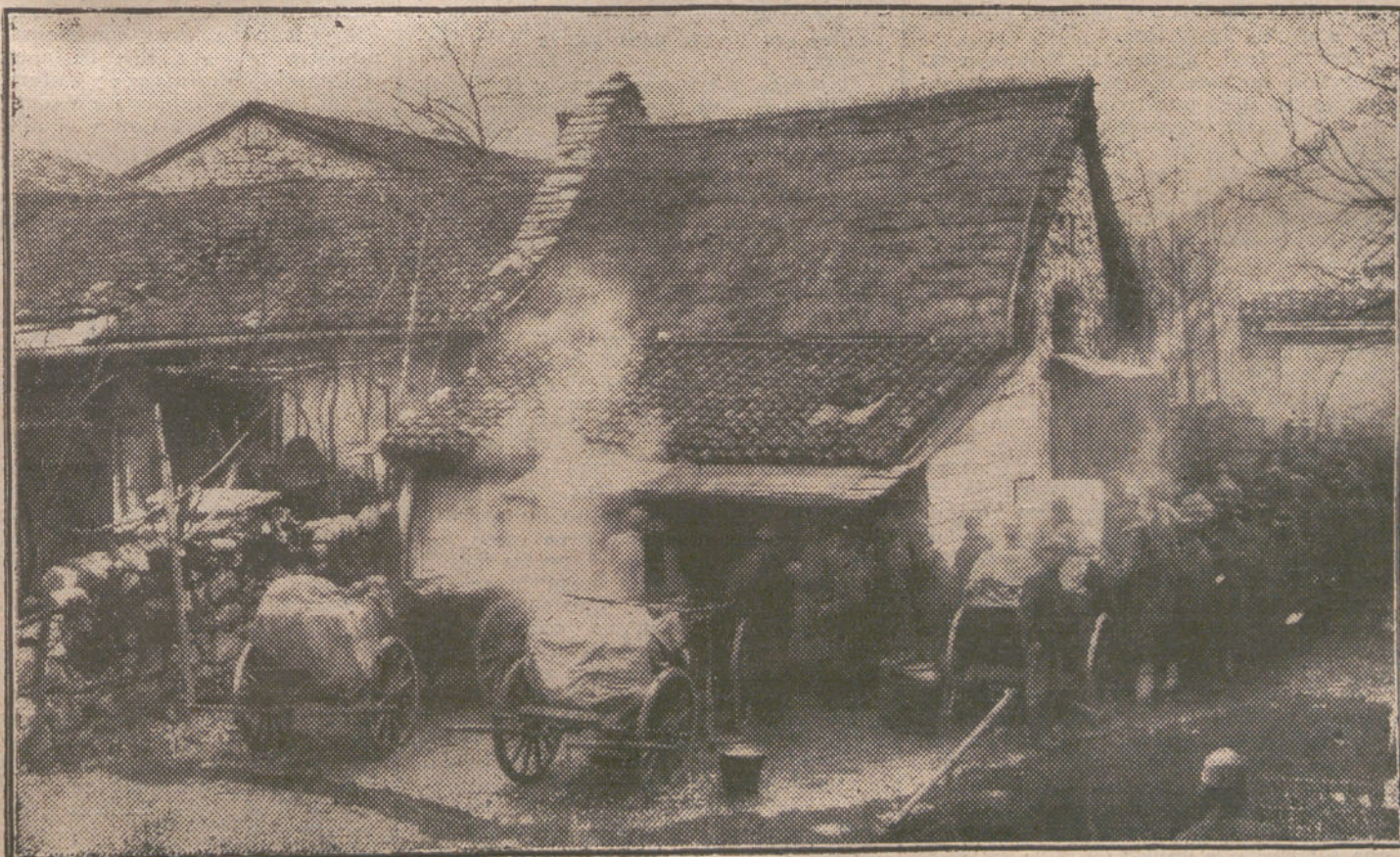
LA LUCHA EN LA FRONTERA AUSTROITALIANA.—Barracones con cocinas de campaña establecidos en los campamentos austrohúngaros del frente italiano.