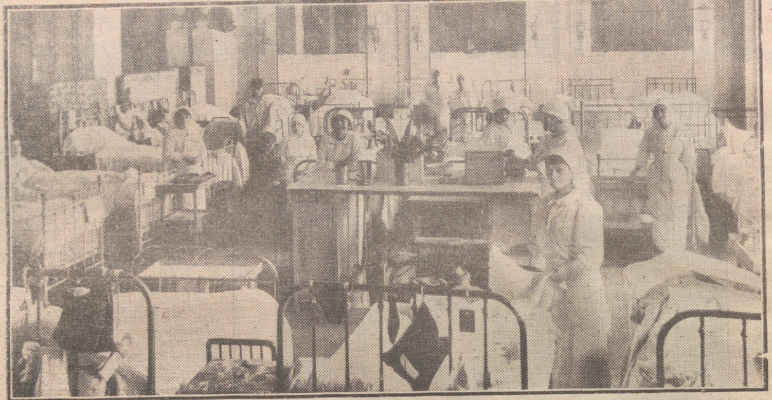
LA GUERRA DESDE PARIS.—Hospital militar instalado en uno de los más populares y suntuosos hoteles de París.

Se piensa en una nueva ley preventiva contra esta clase de huelgas; se piensa