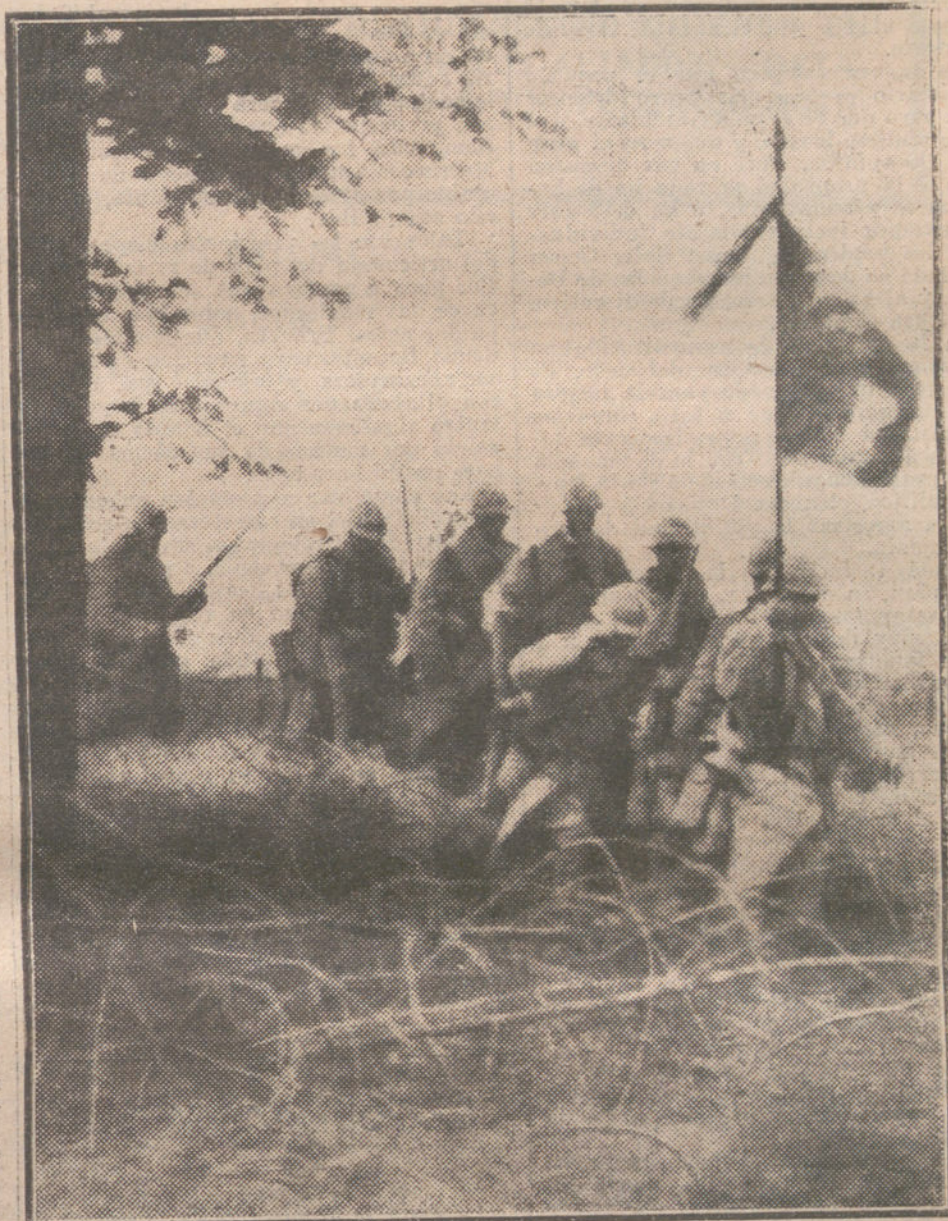
LA LUCHA EN OCCIDENTE.—Tropas francesas siguiendo á la bandera de los regimientos que tomaron parte en la acción del 4 de Septiembre en el Somme.

nia, apaciguó los ánimos de los ansiosos colonistas, y se entremetió en las discusiones diplomáticas para que no se olvidaran de sacar á salvo los intereses británicos en el Estrecho de Gibraltar... Y hoy, en este tremendo trance de la guerra de Europa, Inglaterra, siguiendo su tradicional política, su plan diabólico de la «convención militar» contra Alemania, nos halaga para separarnos de la amistad de sus enemigos y nos amenaza al mismo tiempo para arrancarnos la soberanía de nuestras defensas que ella necesita para amparar sus intereses... Siempre encontramos á Inglaterra en mitad de nuestro camino.