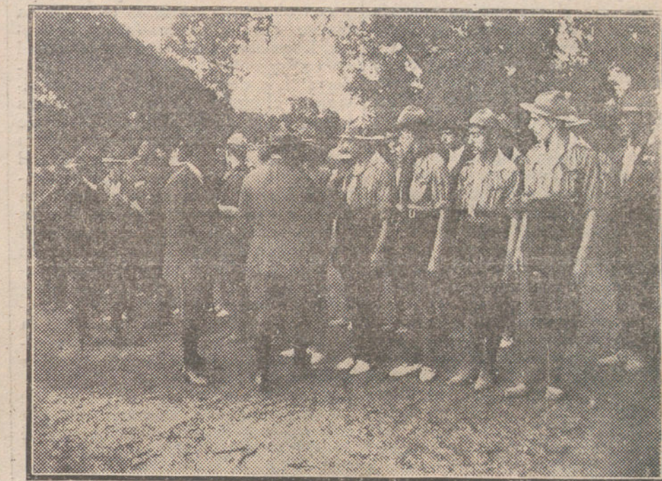
Los exploradores durante el reparto de premios, verificado ayer en El Pardo.

¿Qué pide la Entente? ¿Qué conducta, qué actitud observan respecto de España Alemania y Austria-Hungría? Para que el juicio público se forme—y es necesario que se forme, porque en este problema de decidir sobre su propia vida, la soberanía popular, además de legal es santa—se