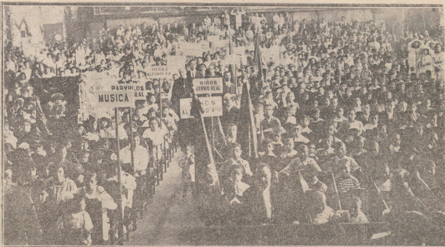
EL NUEVO CONCURSO. —Los niños de las diferentes escuelas de Melilla, reunidos en el Salón Kursaal, oyendo el discurso del general Monteverde, presidente de la Junta de Arbitrios.

Se acordó telegrafiar al ministro de Hacienda en demanda de que sea retirado el proyecto de ley sobre el monopolio de alcoholes.