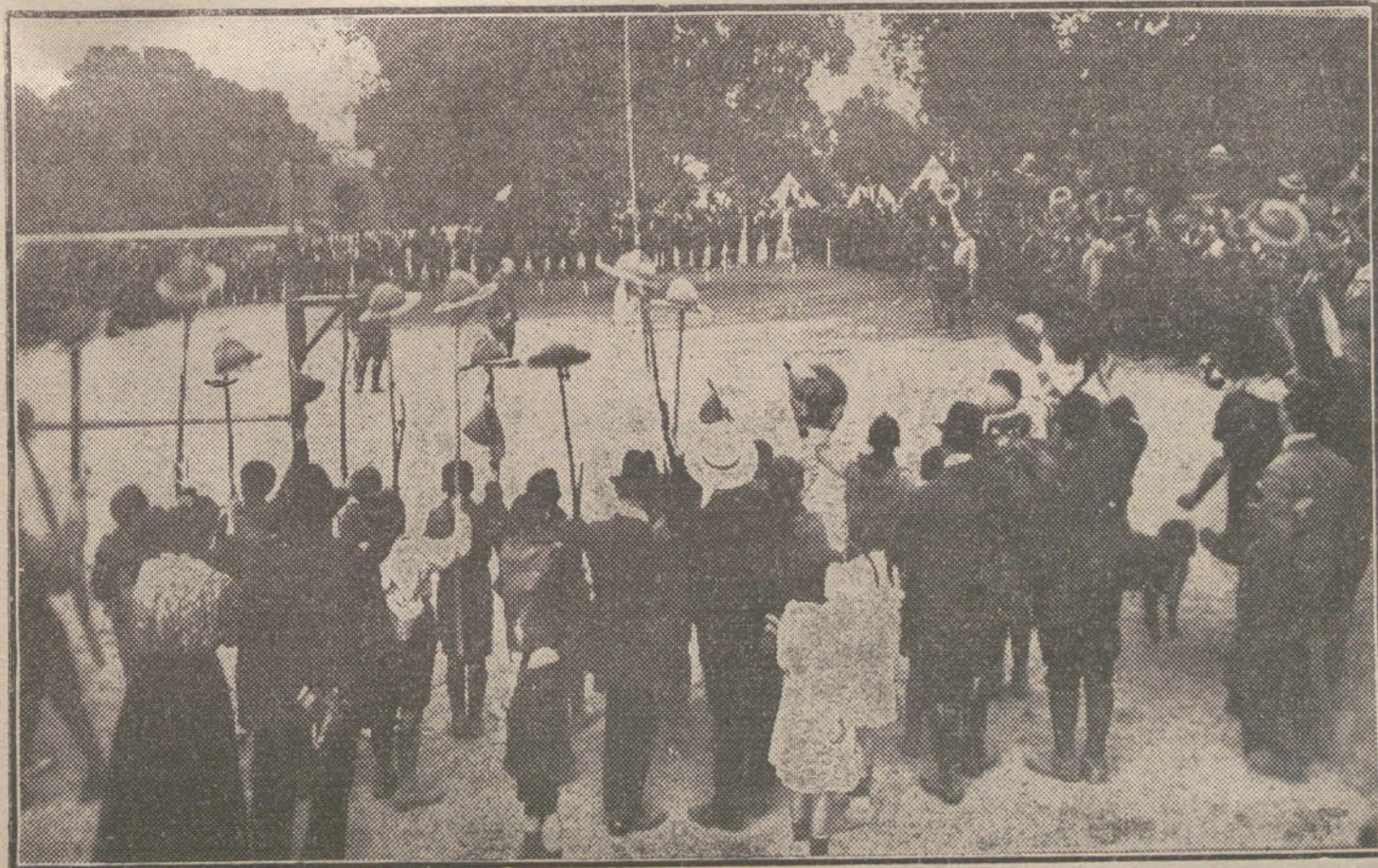
Aspecto general del campamento de los exploradores, establecido en El Pardo, durante la fiesta celebrada ayer tarde.

El Sr. Francos Rodríguez ha marchado muy satisfecho de su estancia en ésta.