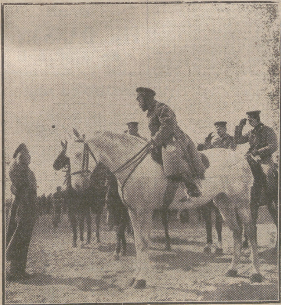
LOS JEFES DE ESTADO EN EL CAMPO DE BATALLA.—El Zar de Rusia con versando con los oficiales de su Ejército.

La opinión quiere luz, y es fuerza dársela. Las sombras son el amparo seguros del mal. ¿Aprendizos de mago, arriba se conspira, nadie se extraña que abajo se conspire a la par, de una manera sorda y violenta, pero salvadora para el país.