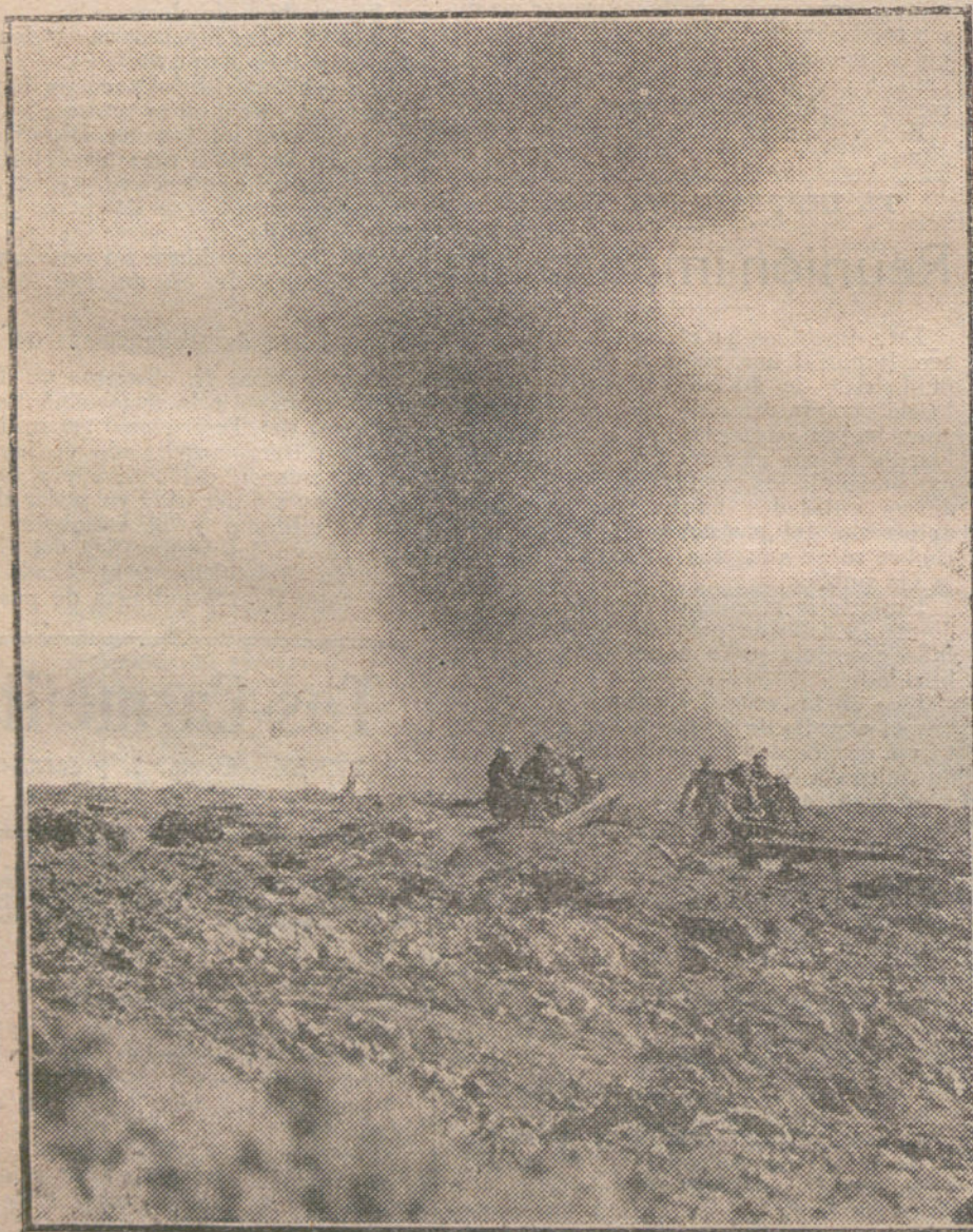
LOS DAÑOS DE LA GUERRA.—Explosión de una granada junto a uno de los campamentos de la Cruz Roja.

Leyendo todos los días la Sección de COMPRA-VENTA de LA TRIBUNA, encontrará usted ocasión de adquirir cuantos objetos necesite en buenas condiciones.