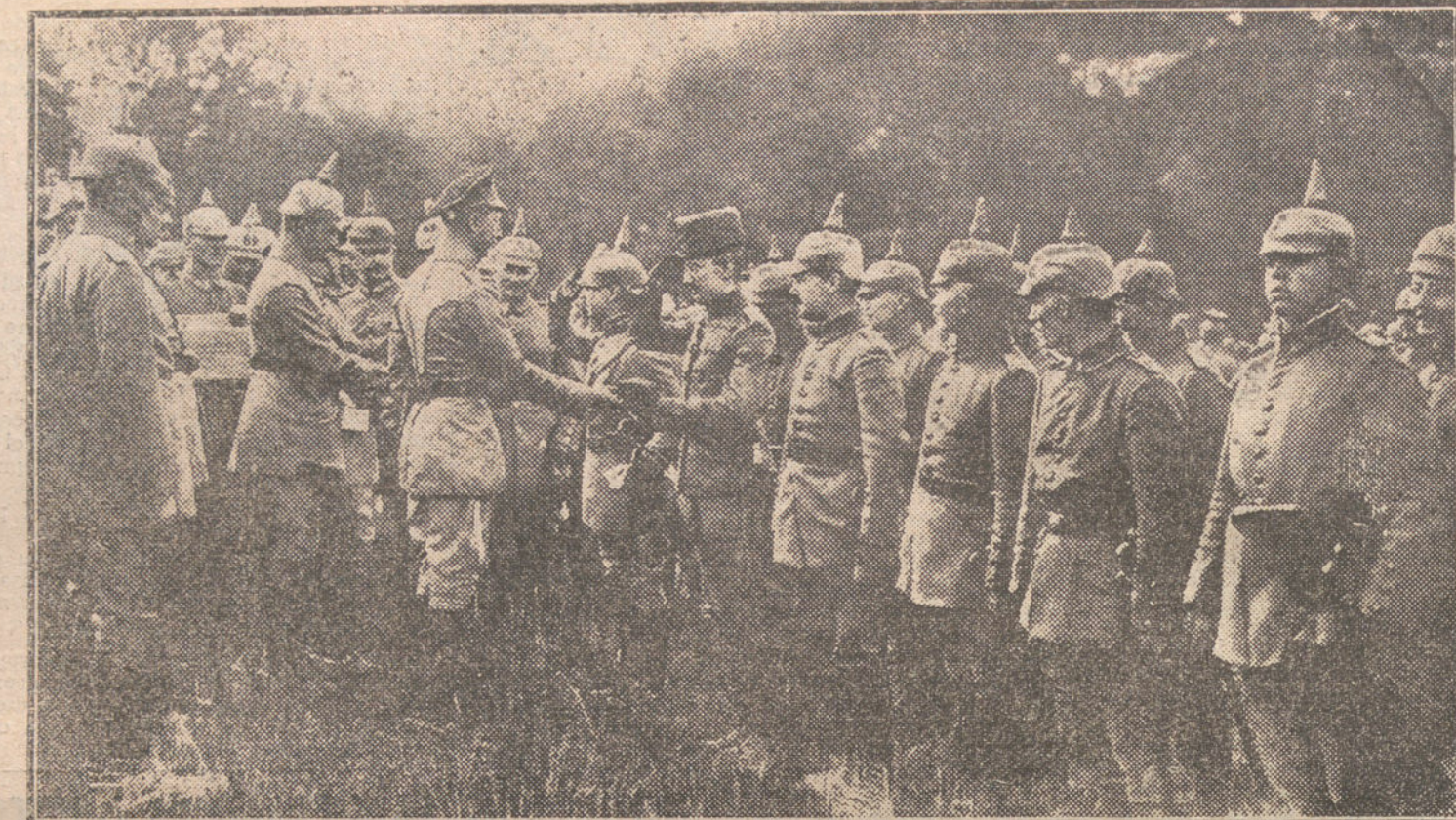
LA LUCHA EN OCCIDENTE.—El Kronprinz entregando condecoraciones a los soldados alemanes que se han distinguido en los últimos ataques a Verdun.

Parece no haberse decidido que Enrique Borras vaya al circo de Price a dar una se-