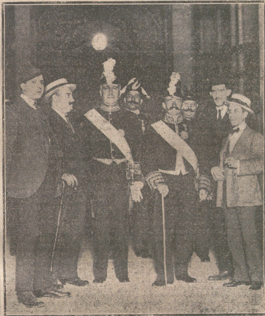
El nuevo ministro de Gracia y Justicia, acompañado del presidente del Consejo, saliendo de Palacio después de la jura.

Es ridículo el argumento de «El Liberal» de que todo Estado debe impedir medidas belicasas dentro de sus aguas jurisdiccionales. Esto es elemen-