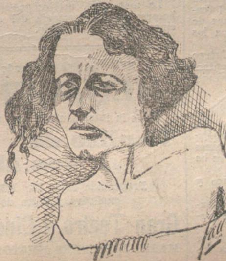
FRANCESCA BERTINI, la gran trágica de la cinematografía. (Por GALLARDO.)