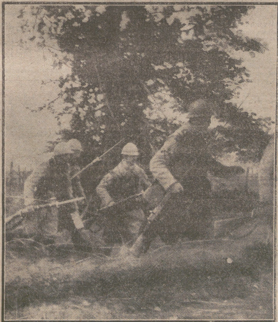
LA LUCHA EN OCCIDENTE.—Patrulla francesa durante un reconocimiento.

tal, pero no reza en modo alguno con las visitas de submarinos alemanes a puertos españoles. ¿O es que el colega se refiere a la flagrante violación del territorio marítimo español, cometida por un crucero inglés en aguas territoriales españolas de nuestra factoría de Río de Oro, ensañándose con una «valentía» sin ejemplo, en el «Kaiser Wilhelm Der Grosse»? Porque los submarinos de Alemania han respetado siempre nuestras costas, y no han cometido ningún acto hostil, como el que acaba de citarse. Parodiando la frase de Maura de que «la libertad se ha hecho conservadora», podríamos decir que la ley del embudo es una ley republicana o reformista.