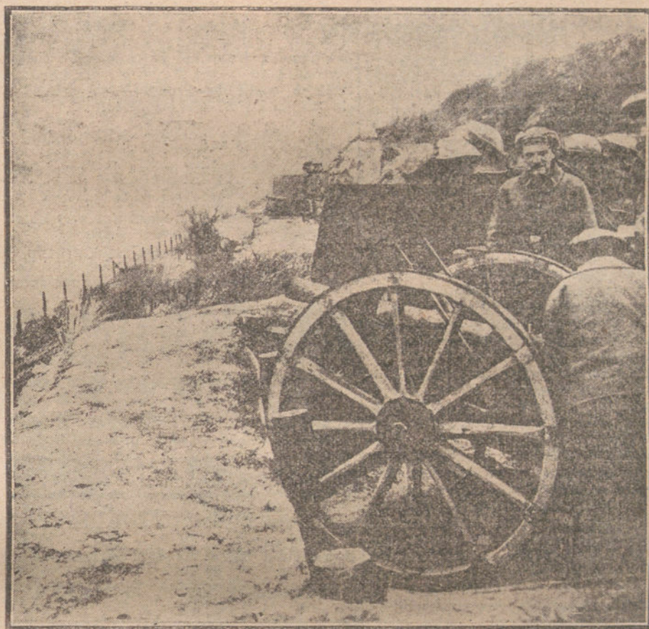
LA LUCHA EN BELGICA.—Posiciones de cañones de escampavías, instaladas por el Ejército alemán en las costas flamencas.

ta del colega. francamente lo decimos: ¿Cómo se cohonestá su nueva actitud con el decreto de 14 de Junio de este Real decreto de 14 de Junio de este año, que prohíbe «anunciar», emitir, poner en circulación y en venta, pignorar é introducir en el mercado de España títulos de Deuda y demás efectos públicos de los Gobiernos extranjeros?