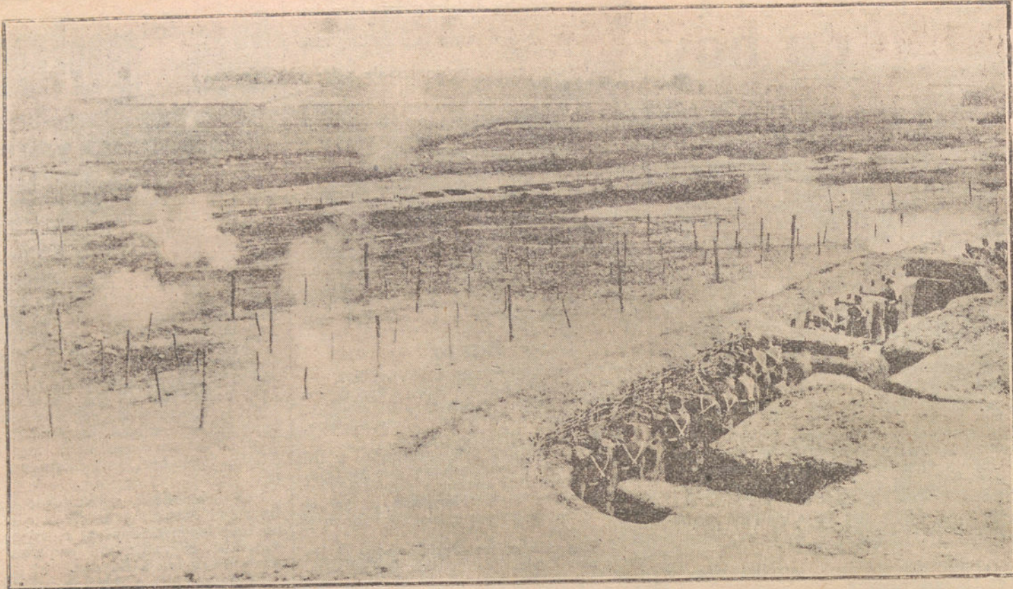
PRACTICAS DE INGENIEROS MILITARES EN BARCELONA.—Trincheras construidas según las técnicas modernas.