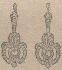
Núm. 11.—Cuatro brillantes y diamantes. Ptas. 550.