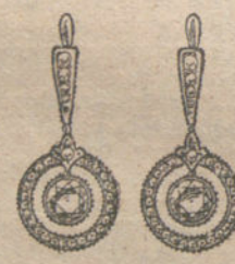
Núm. 14.—8 brillantes y diamantes. Ptas. 850.