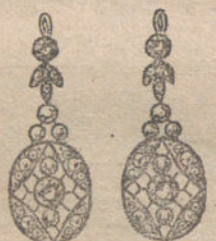
Núm. 7.—14 brillantes y diamantes. Ptas. 375.