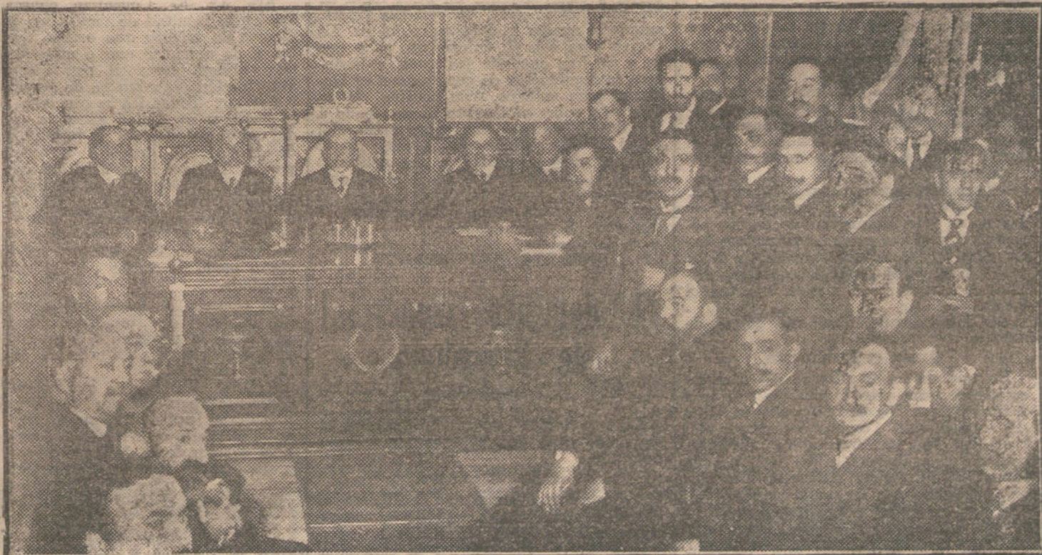
Solemnísima sesión inaugural de la IV Asamblea Farmacéutica, acto verificado esta mañana, bajo la presidencia del ministro de la Gobernación.