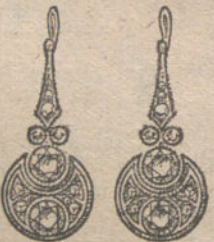
Núm. 13.—Cuatro brillantes y diamantes. Ptas. 700.