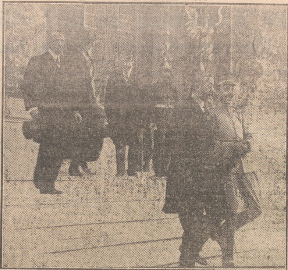
SS. M. los Reyes saliendo del palacio del Retiro después de inaugurar la Exposición del proyecto de monumento al Sagrado Corazón de Jesús.

Hasta mañana no se harán públicas estas modificaciones, sin duda por el