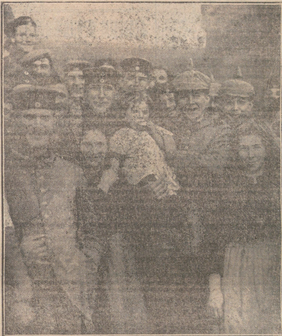
EN LAS REGIONES INVADIDAS.—Soldados alemanes fraternizando con parianos de las regiones invadidas del Norte de Francia.

más en el caso adverso que en el própero le será necesaria la asistencia de la opinión del país, para proceder con energía.