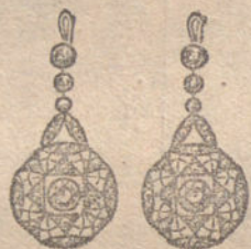
Núm. 2.—Seis brillantes y diamantes. Ptas. 225.