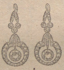
Núm. 12.—Ocho brillantes y diamantes. Ptas. 625.