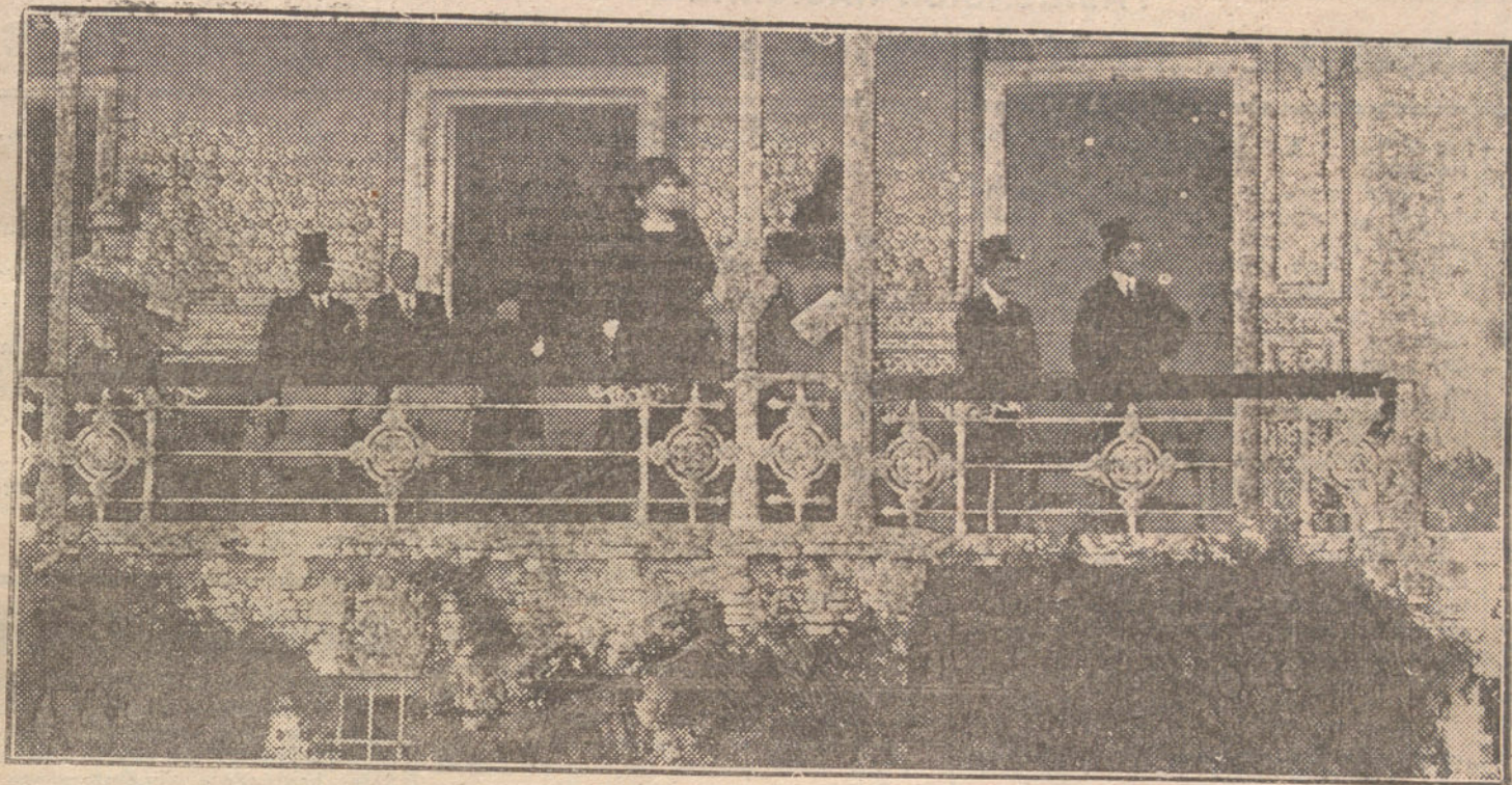
LAS CARRERAS DE CABALLOS. —La familia Real en la tribuna regia presenciando las pruebas del pasado domingo.

Ganaron los escorialenses por dos tantos contra uno. Distinguióse de un modo notable el «goal-keeper» madrileño Bertrán de Lis, que tuvo una tarde capaz de acreditar a cualquier portero.