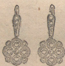
Núm. 8.—10 brillantes y diamantes. Ptas. 425.