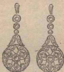
Núm. 4.—14 brillantes y diamantes. Ptas. 275.