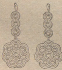
Núm. 10.—22 brillantes. Ptas. 500.