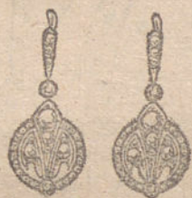
Núm. 3.—Ocho brillantes y diamantes. Ptas. 250.