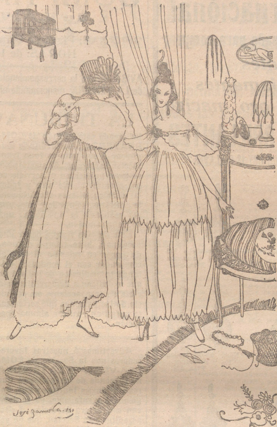
(Modelos de la casa ZAMORA)