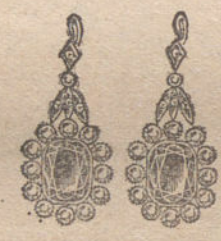
Núm. 9.—26 brillantes, diamantes y zafiros. Ptas. 450.