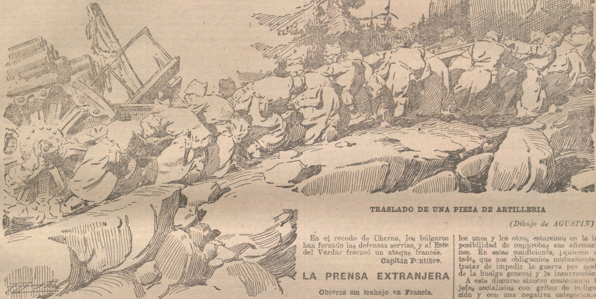
TRASLADO DE UNA PIEZA DE ARTILLERIA

LOS ALEMANES SACAN DE TURQUIA NUEVOS CUERPOS DE EJERCITO.—SANGRIENTAS PERDIDAS DE LOS ALIADOS EN EL SOMME.—LA ESCUADRA ALEMANA EN EL MAR.—GRECIA CONTINUA SIENDO VICTIMA DE LOS ALIADOS.—PREOCUPACION EN RUMANIA.—ACTIVIDAD DE LA LUCHA AEREA.—ENCUENTRO ENTRE AVIONES E HIDROAVIONES.—PREPARANDO UN NUEVO ATAQUE CONTRA RUSIA.—EN LOS DEMAS FRENTE.—LOS TURCOS EN LA GUERRA.—LAS TROPAS DE MACKENSEN SIGUEN OPERANDO CON EXITO.—LA DIPLOMACIA DE LAS NACIONES BELIGERANTES.