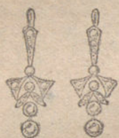
Núm. 1.—Cuatro brillantes y diamantes. Ptas. 200.

MONTURAS DE PLATINO Y ORO DE LEY 18 QUILATES