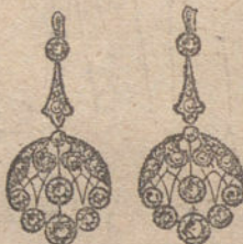
Núm. 6.—16 brillantes y diamantes. Ptas. 325.