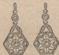
Núm. 5.—Cuatro brillantes y diamantes. Ptas. 300.