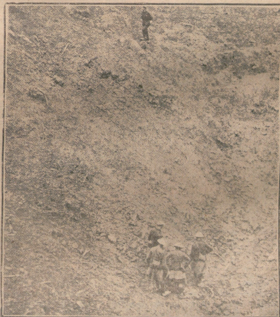
LAS ARMAS DE GUERRA. —Soldados ingleses inspeccionando el cráter abierto por la explosión de una mina.