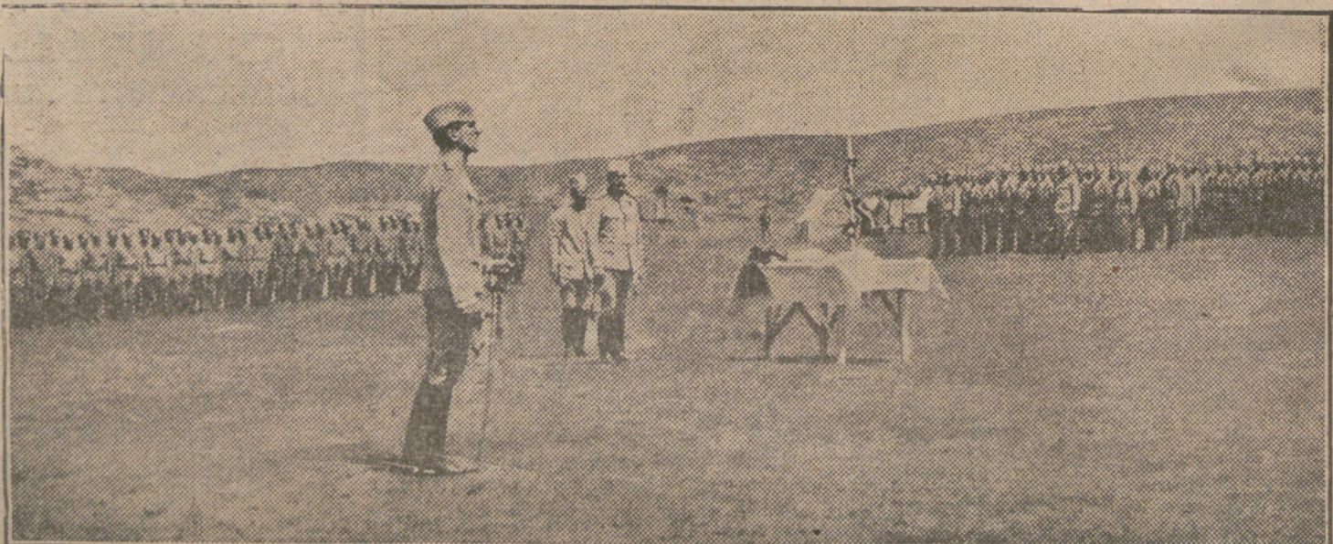
LOS SOBERANOS SIN TRONO.—El Príncipe Regente de Servia dirigiendo una alocución a las tropas servias en los campos de batalla de la Moglenitz.

El Gobierno norteamericano tributó al cadáver del doctor Núñez grandes honores militares al ser embarcados sus restos en el crucero de guerra cubano que lo condujo a su Patria.