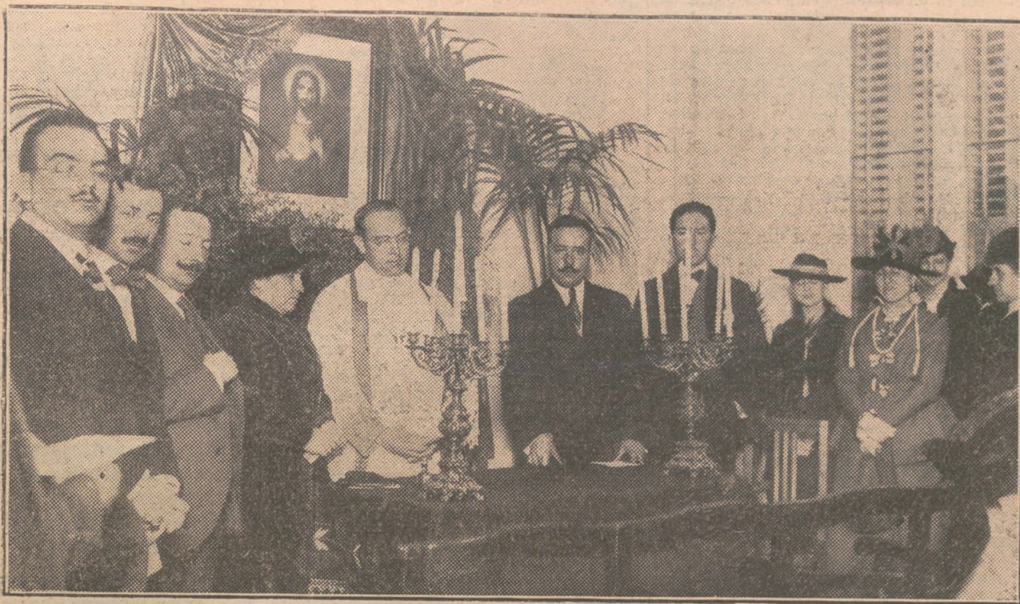
Solemne inauguración de curso y entronización al Sagrado Corazón de Jesús en el Centro Católico Universitario.