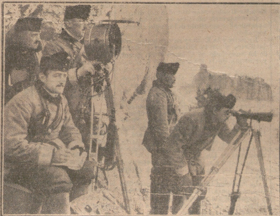
LAS NECESIDADES DE LA GUERRA.—Patrulla de señales de un regimiento de caballería, cerca de Skaroyce.

Esto dirigió a los alumnos, que llenaban por completo el salón, un breve y elocuente discurso.