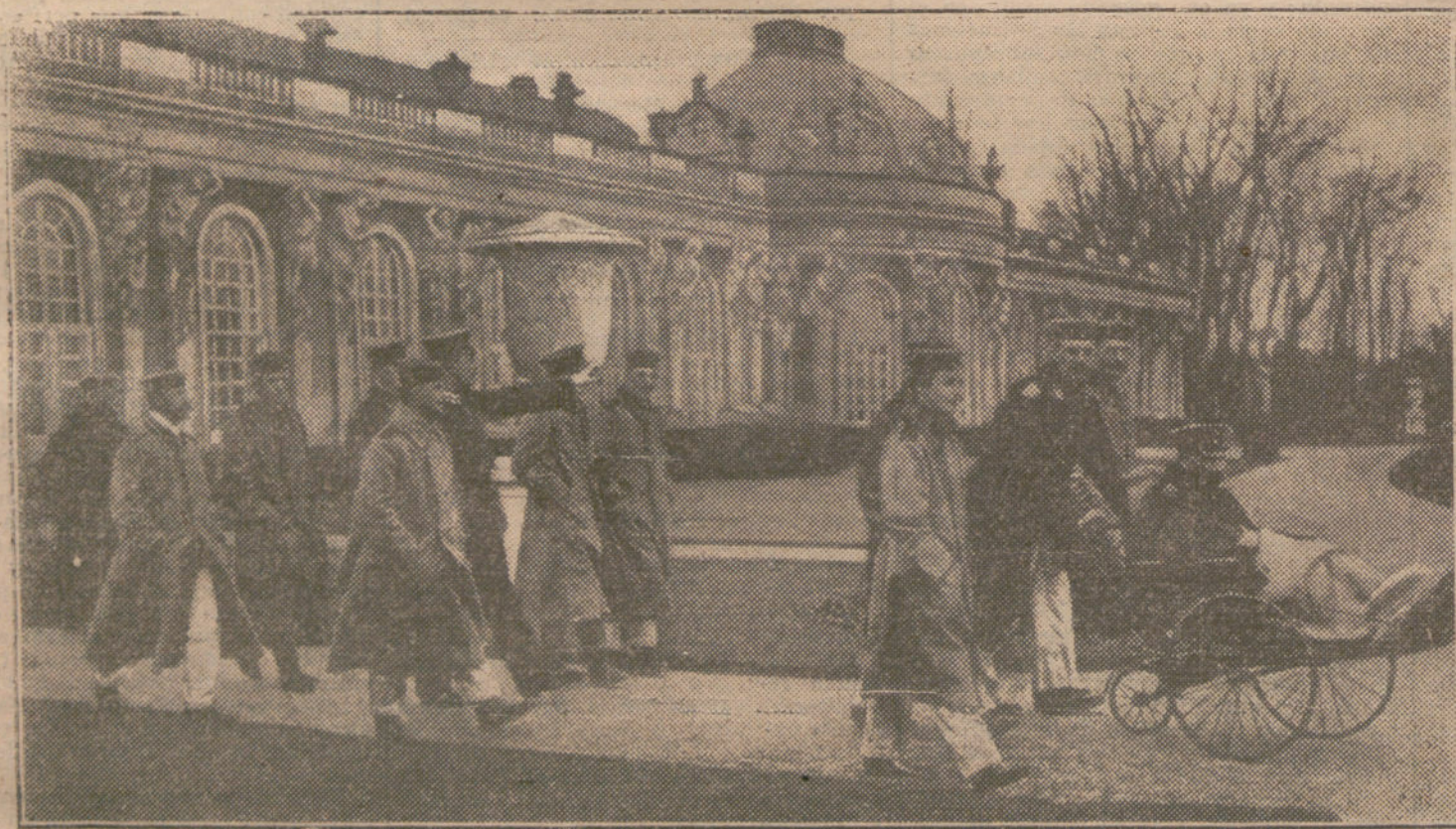
LAS VÍCTIMAS DE LA GUERRA.—Heridos alemanes paseando por el parque de Sanssouci, junto a Potsdam.

«Los agentes municipales ó cualquier vecino denunciará ante el alcalde los solares existentes para que dicha autoridad obligue a los propietarios a que inmediatamente los cerquen y a edificar sobre ellos en el plazo de un año, a contar desde la fecha de la notificación».