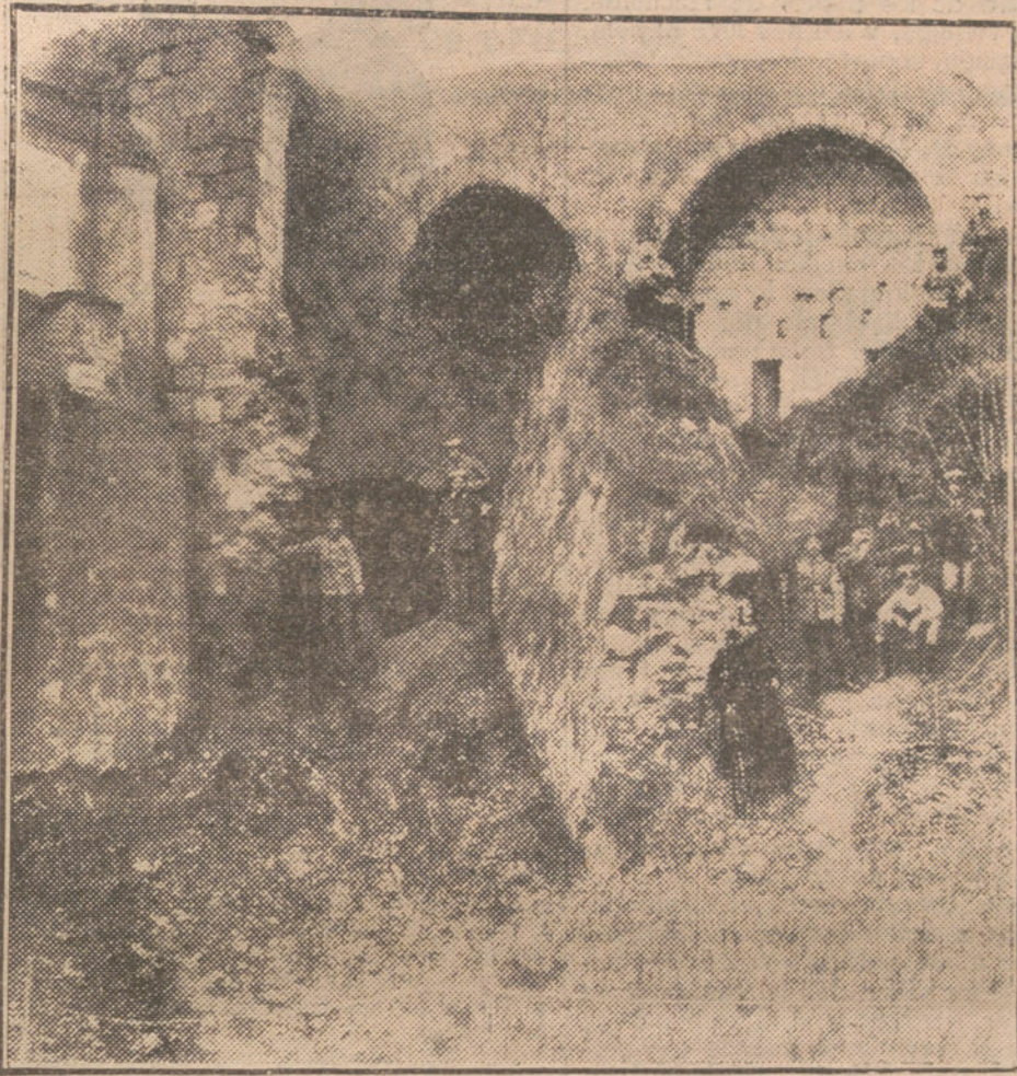
DESPUES DEL COMBATE.—Soldados alemanes en las ruinas del fuerte de La n.

Pero les sedujo mucho á los navieros españoles la codicia de la elevación desmesurada de los fletes, que, por consecuencia de la guerra submarina, vienen rigiendo entre los puertos españoles y los ingleses y franceses del Canal y el mar del Norte; y renunciaron «generosamente» á las primas concedidas á la navegación española que trafica con mercancías españolas, para dedicarse al tráfico ilícito con el extranjero y entre puertos de salida y llegada extranjeros; y hasta ha habido quien al extranjero vendió parte de su flota ó hizo como que la vendía, arriando la bandera de la Patria y sustituyéndola por un extraño pabellón... sin perder la propiedad, para reincor-