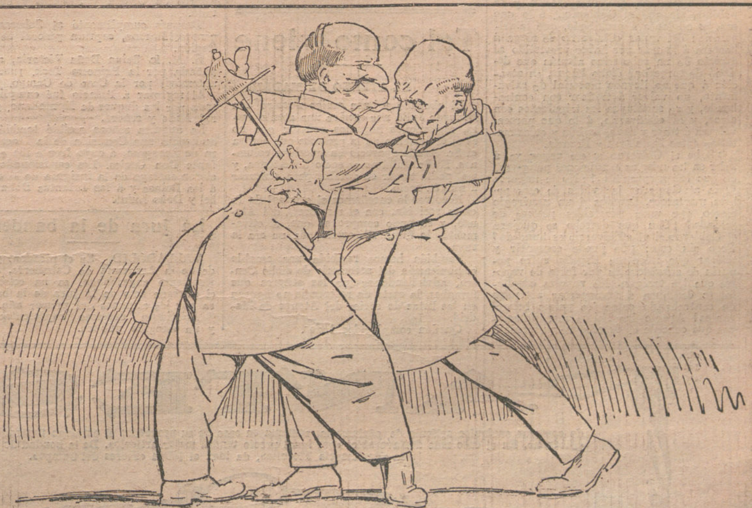
LAS SORPRESAS DE LA POLITICA