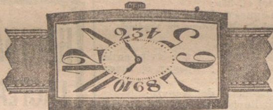
Núm. 5.—Forma rectangular, alargada, áncora de precisión, con pulsera de cuero. En oro de ley 18 quilates, pesetas 150. En plata de ley, pesetas 65.