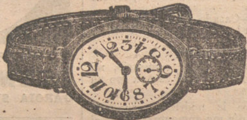
Núm. 3.—Forma ovalada, áncora de precisión, con pulsera de cuero fino. En oro de ley 18 quilates, pesetas 125. En plata de ley, pesetas 55.