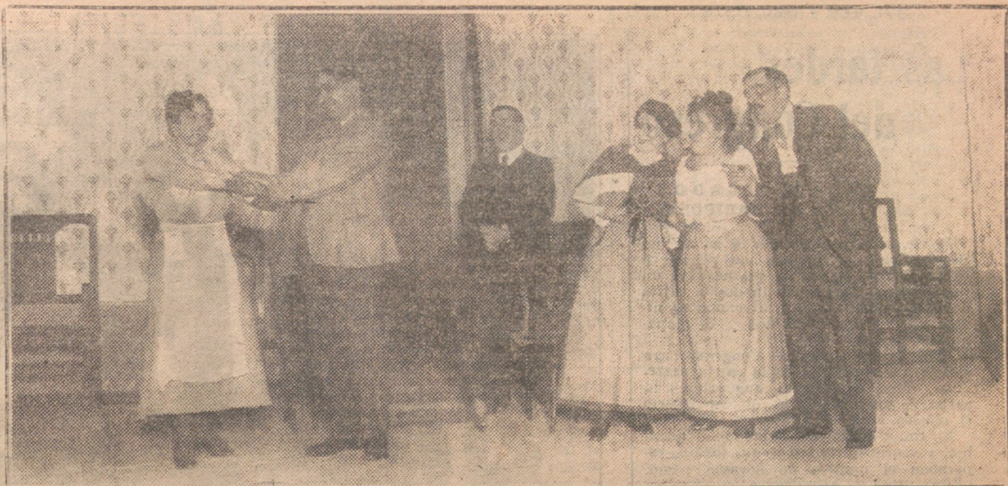
Escena final del primer acto del sainete «Salud y pesetas», estrenado anoche en el teatro Cómico.

El galanteador, elegante y buen mozo, que a los cincuenta años tiene una aureola, pero muchas canas y la tristeza mortal del amor, que cada vez es más difícil de conseguir, fue transformada por el Sr. Vilches en su amigo Teddy, peque-