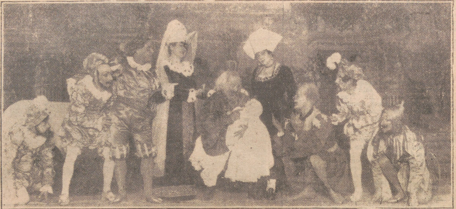
Una escena de la obra «La bella Riseta», estrenada esta tarde en el teatro de la Reina Victoria.