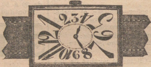
Núm. 4.—Forma rectangular, áncora de precisión, con pulsera de cuero fino. En oro de ley 18 quilates, pesetas 140. En plata de ley, pesetas 60.