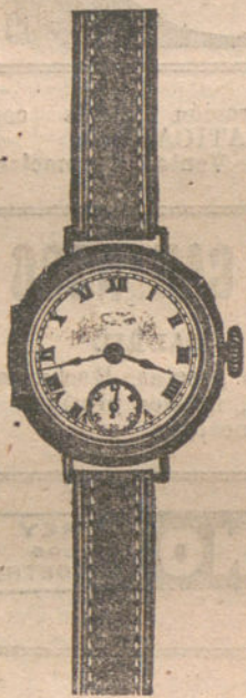
Núm. 1.—Forma París, bisel plano, áncora de precisión, 15 rubíes, con pulsera de cuero ó moiré. En oro, 18 quilates, pesetas 70. En plata de ley, pesetas 40.

Garantía efectiva de buena marcha por cinco años