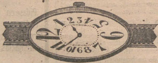
Núm. 6.—Forma ovalada, alargada, áncora de precisión, con pulsera de cuero. En oro de ley 18 quilates, pesetas 165. En plata de ley, pesetas 70.