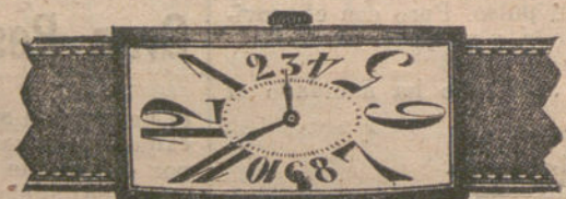
Núm. 7.—Forma rectangular, áncora de precisión, ocho y media líneas, con pulsera de cuero. En oro de ley 18 quilates, pesetas 200. En plata de ley, pesetas 85.

Factura de garantía en todas las compras