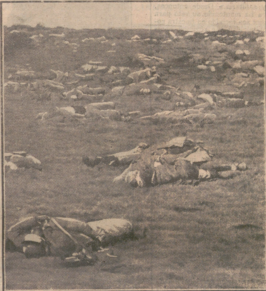
EL CAMPO DE BATALLA.—Aspecto de uno de los campos de la Champaña, después de un violento combate.

Y esta es la madre del cordero. Inglaterra no tenía ni tiene intereses en el Imperio marroquí, aunque siempre