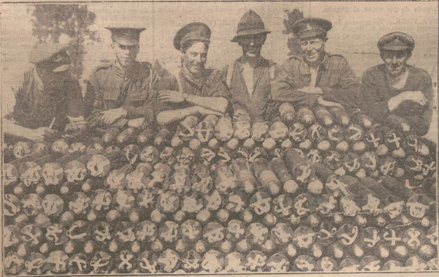
LA VIDA EN CAMPANA.—Soldados ingleses en un parque de granadas de mano.