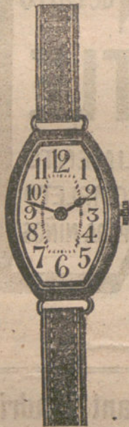
Núm. 2.—Forma «tonneau», extraplano, máquina especial, de precisión, con pulsera de cuero ó moiré. En oro, 18 quilates, pesetas 100. En plata de ley, pesetas 55.