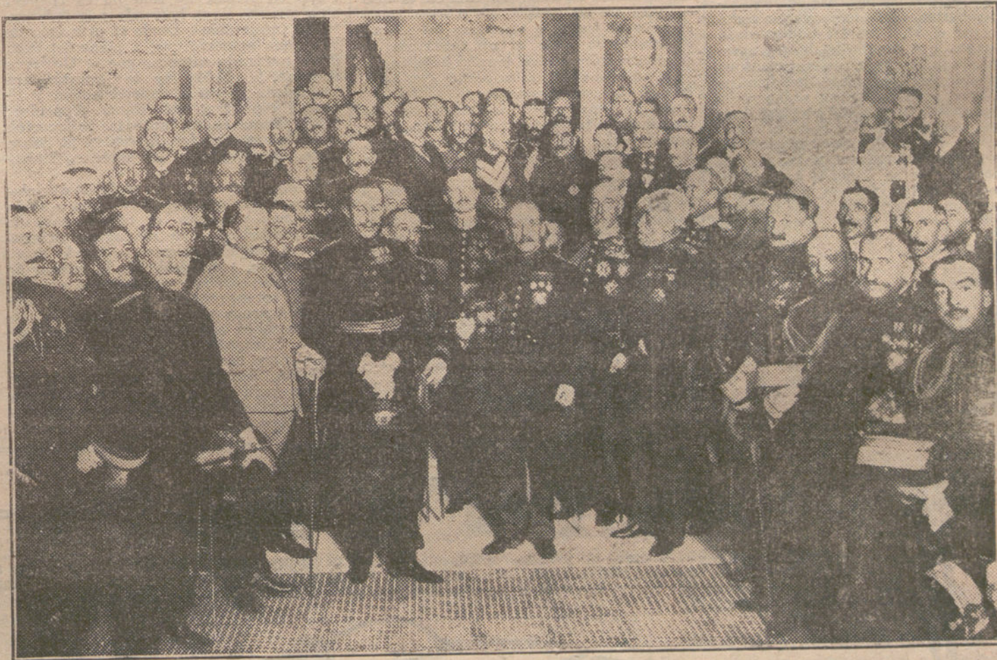
S. M. el Rey, el Infante Don Fernando, el obispo de Sión, el ministro de la Guerra y los jefes y oficiales que asistieron anoche a la inauguración del nuevo edificio del Centro del Ejército y de la Armada.

Las operaciones para la compra de la naranja con destino a la exportación están paralizadas.