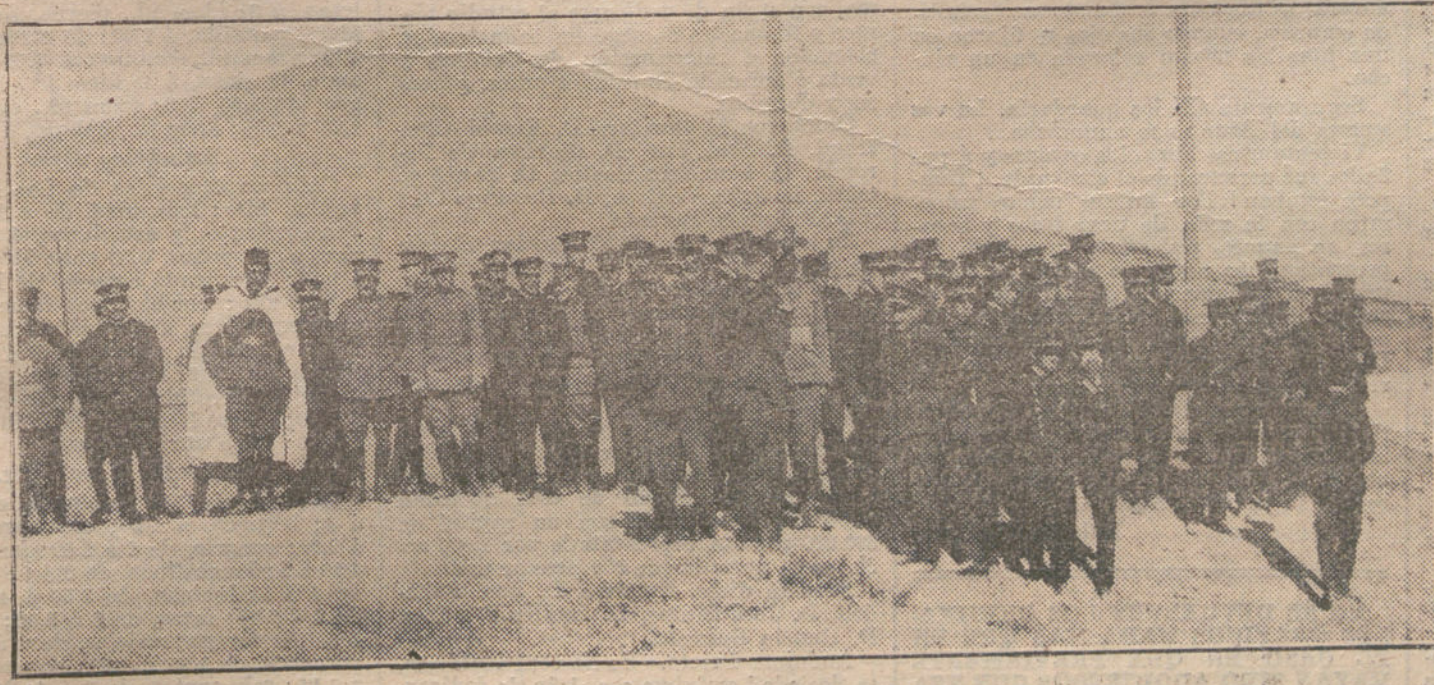
LOS MARINOS DEL «REINA REGENTE» EN MELILLA.—Los profesores y alumnos, acompañados del comandante general, viendo maniobrar a las fuerzas regulares indígenas.

Se levantó, notando que atroces náuseas subían a su garganta. Cruzó por la