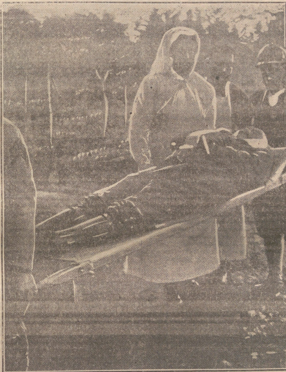
LA GUERRA EN FRANCIA.—Transporte del cadáver del general Ancein desde el fuerte de Douaumont a las ambulancias.

Los rusos, que hace días permanecían inactivos, han intentado desesperados saltos en la orilla derecha del Nírojov;