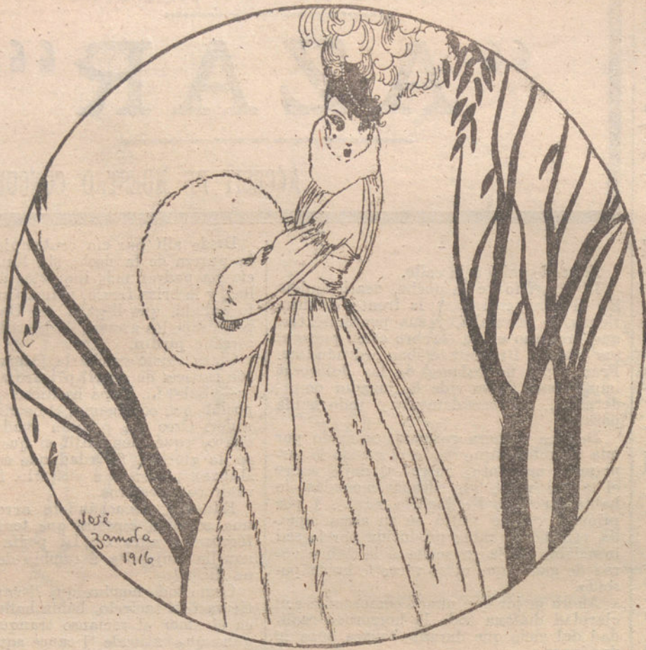
Modelos de la CASA ZAMORA