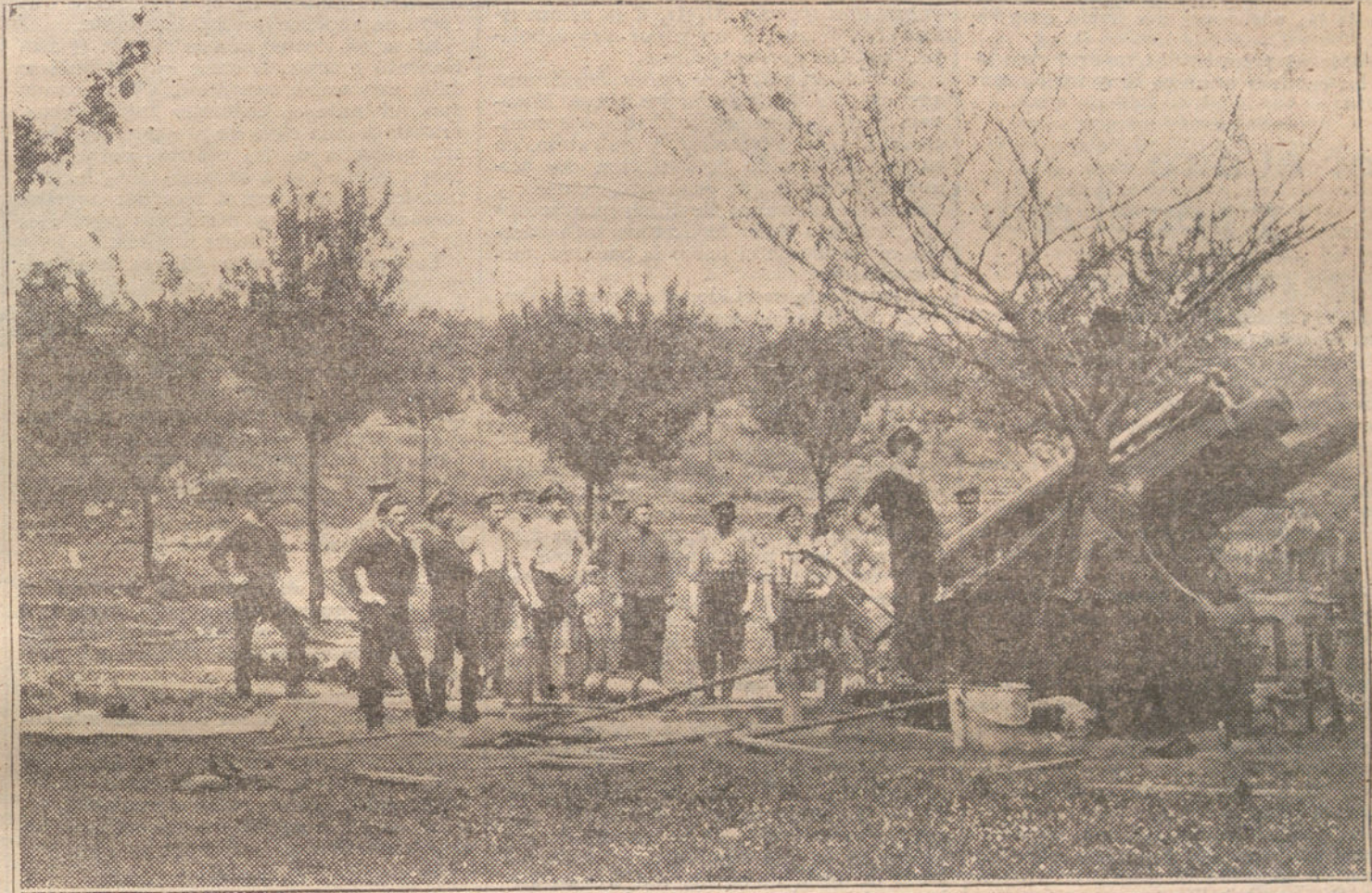
LOS INGLESES EN LA GUERRA.—Un cañón gigante al ser puesto en situación durante un combate.