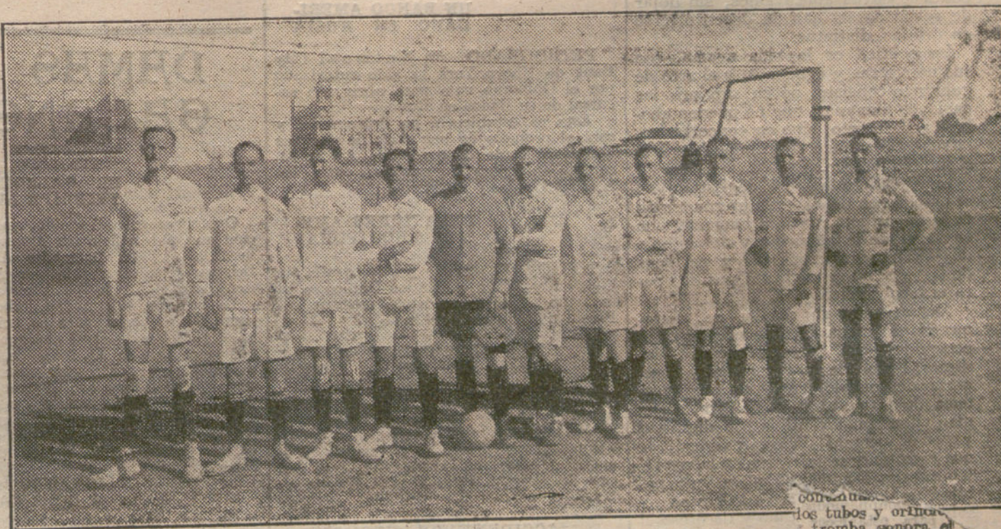
EL FOOT-BALL.—Primer equipo de la Sociedad Gimnástica Alemana, que hoy ha competido con

Partió la manifestación de la Casa del Pueblo, y al llegar al Gobierno civil, una Comisión subió á entregar las conclusiones. El gobernador salió al balcón y prometió elevarlas á los Poderes públicos. Durante el acto hubo completo orden.