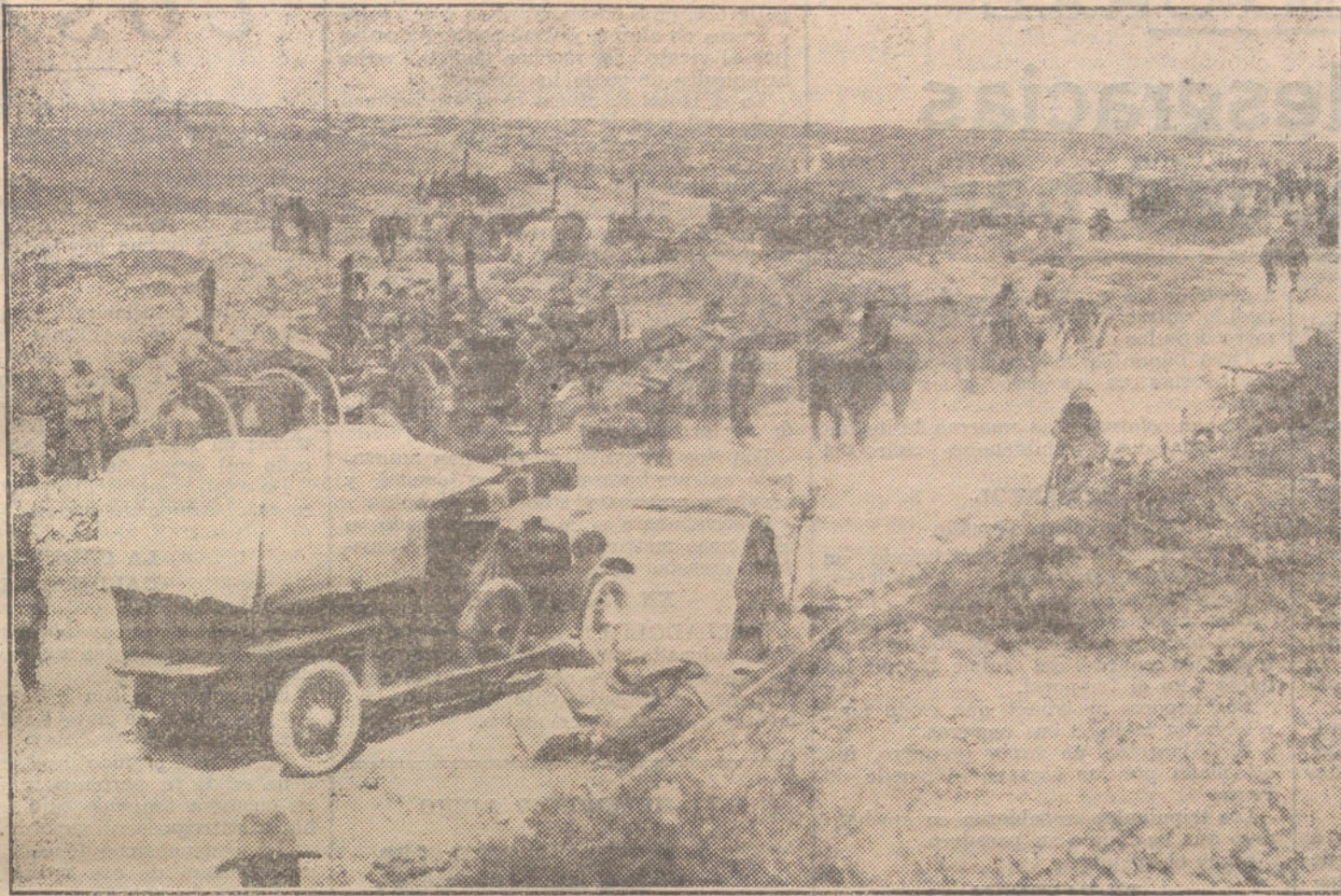
LOS INGLESES EN LA GUERRA.—Un campamento australiano cerca de la línea de Flandes.

Si desea usted consultar alguna cosa sobre nuestra Sección de COMPRA-VENTA, dirijase á la plaza de Canalejas, núm. 6, primer izquiera, sin preguntar en la portería. (Hay ascensor.)