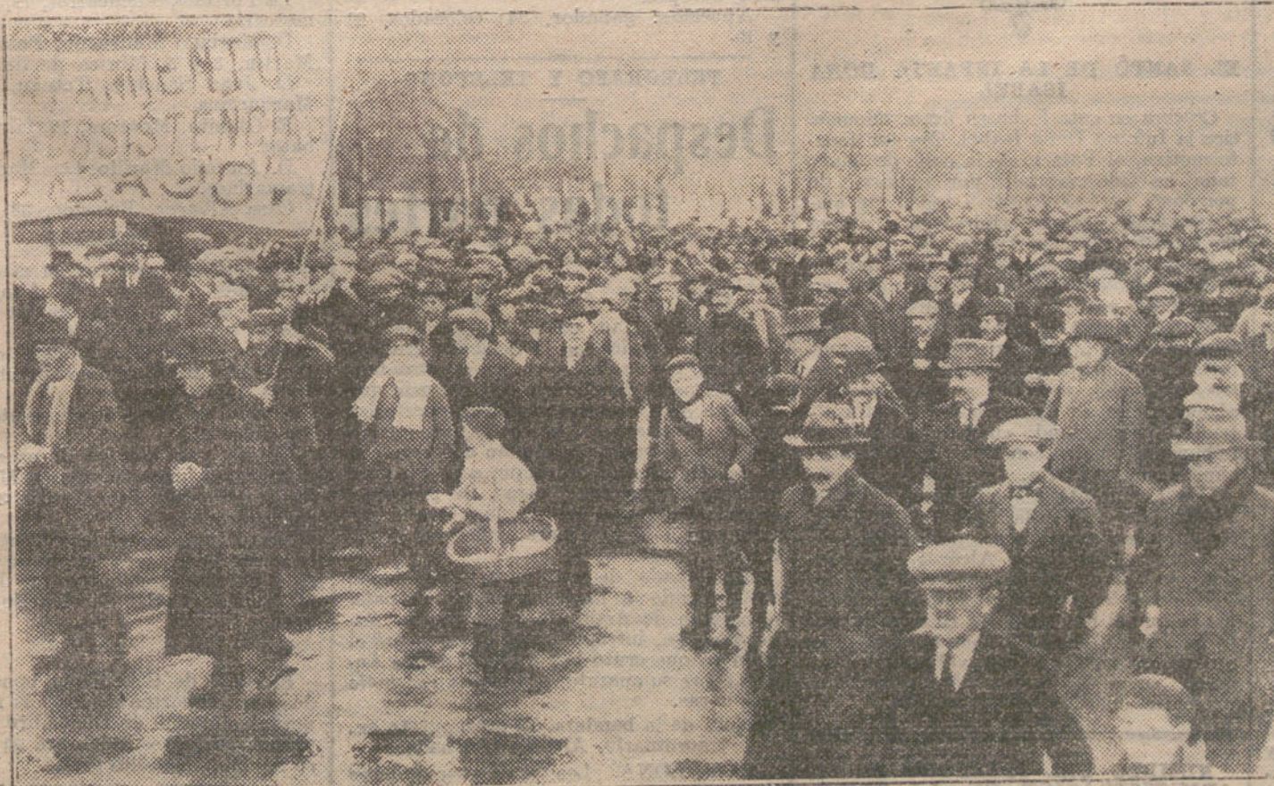
LA MANIFESTACION DE HOY.—Un aspecto de la misma, al pasar por la Castellana.

En el caserío, el perro lúgubre aullaba. Pedro Pengo.