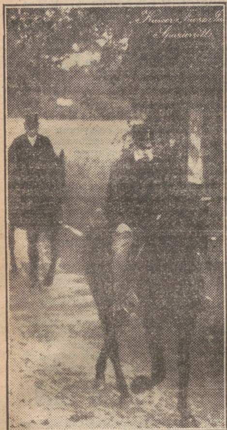
El Emperador Francisco José paseando a caballo por los jardines de Schönbrunn.