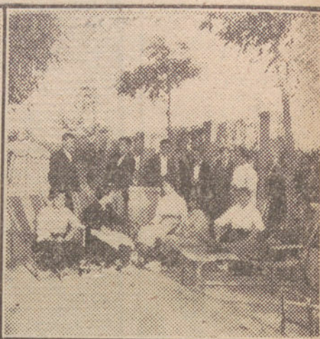
Grupo de enfermos durante las horas de descanso.

Como una isla de reposo en medio de la ondulada meseta, se alza el blanco Sanatorio de Húmera. A lo lejos, Madrid se envuelve en vaho neblinoso. Frente a él azulea la difusa masa del Guadarrama. El Sanatorio—un caserío y un pequeño jardín—, aislado entre campos en barbecho, trigales segados y eriales amarillos, está como sumergido en la caliente luz solar que rever-