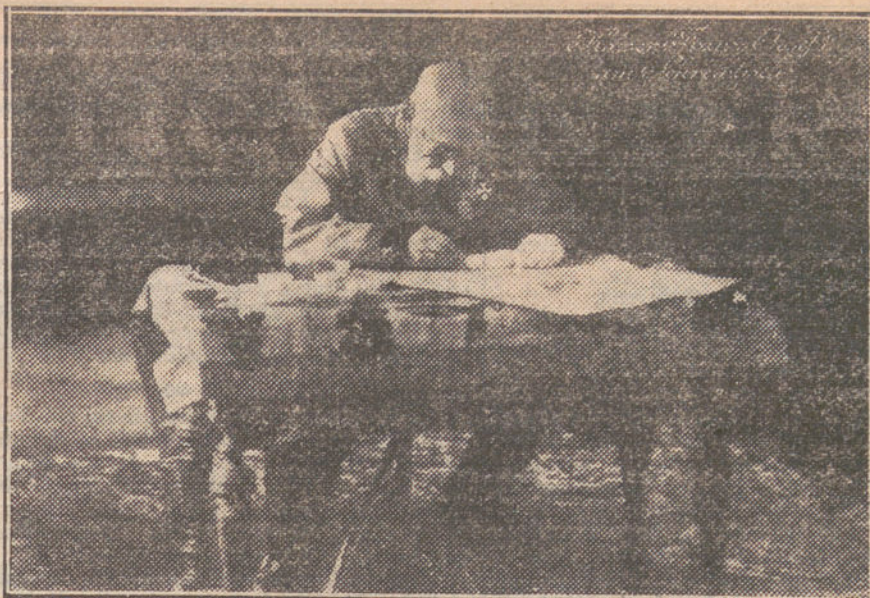
El Emperador Francisco José en su despacho, estudiando un plano de la guerra. (Fotografía obtenida en 1915.)

Francisco José era Emperador de Austria, Rey Apostólico de Hungría, Rey de Bohemia, Dalmacia, Croacia, Eslovenia, Galitzia, Lodomeria, Iliria; Rey de Jerusalem, Archiduque de Austria, gran duque de Toscana y de Cracovia, duque de Lorena, Salzburgo, Stiria, Carintia, Carniola y de Bukovina; gran Príncipe de Transilvania, Margrave de Moravia; duque de la Alta y Baja Silesia, Módena, Parma, Plasencia, Guastalla, D'Auschwitz y Zator, Teschen, Friul Ragusa y Zara; conde