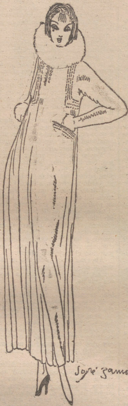
ARIADNA.—Traje de terciopelo «marrón glacé», adornado con bordados y vivos de terciopelo amarillo. Cuello y puños de marmota.