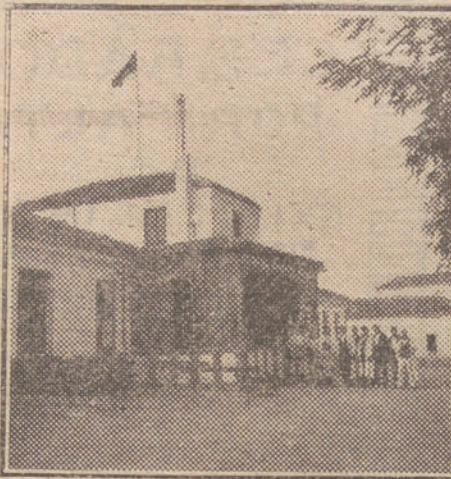
Los enfermos saliendo del Sanatorio para dirigirse al campo.