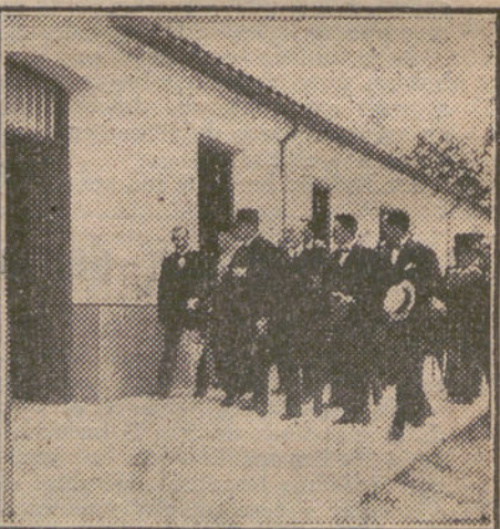
S. M. la Reina, acompañada del ministro de Estado, en su visita al Sanatorio.