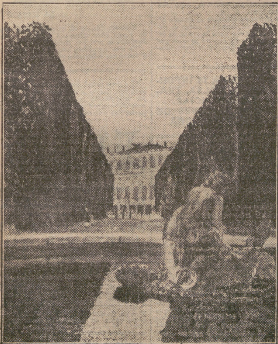
Cas. llo de Schönbrunn, donde ha muerto el Emperador.

principal de Habsburgo y Tirol, Ouburgo, Gorizia y Gradisca; Príncipe de Trento y de Brixen, Margrave de la Alta y Baja Lusatia y en Istria; conde de Hohen-