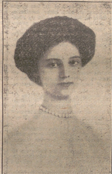
La Archiduquesa Zita, esposa del nuevo Emperador.

Ignoraba al mediodía el conde de Romanones si regresará inmediatamente Su Majestad el Rey a Madrid.