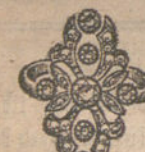
Núm. 17.—Siete brillantes y diamantes. Pesetas 325.