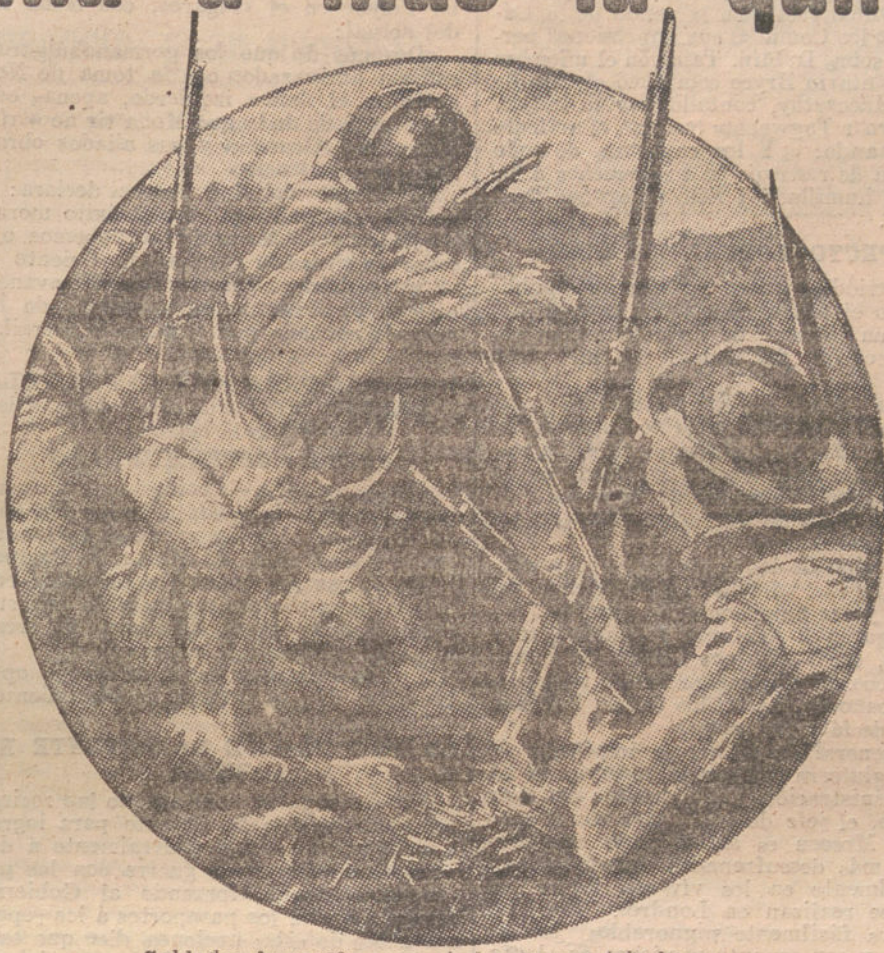
Soldados franceses parapetados en una trinchera

NO OBSTANTE LA OPOSICION DEL GOBIERNO GRIEGO, LOS FRANCESES EXPULSAN DE ATENAS A LOS REPRESENTANTES DIPLOMATICOS DE LOS IMPERIOS CENTRALES. — LOS ESTUDIANTES PATRIOTAS TIROTEAN A LOS VENIZELISTAS EN LA UNIVERSIDAD DE ATENAS