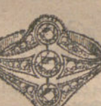
Núm. 22.—Tres brillantes y diamantes. Pesetas 440.