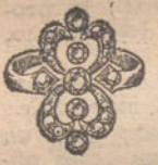
Núm. 11.—Cinco brillantes y diamantes. Pesetas 200.