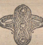
Núm. 14.—Tres brillantes y diamantes. Pesetas 250.