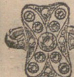
Núm. 23.—Nueve brillantes y diamantes. Pesetas 475.