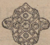
Núm. 20.—Cinco brillantes y diamantes. Pesetas 375.