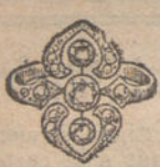
Núm. 13.—Tres brillantes y diamantes. Pesetas 240.