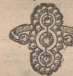
Núm. 15.—Tres brillantes y diamantes. Pesetas 275.