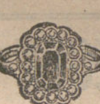
Núm. 18.—Diez y ocho brillantes y diamantes. Pesetas 340.