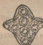
Núm. 21.—Cinco brillantes y diamantes. Pesetas 400.