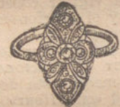
Núm. 12.—Cinco brillantes y diamantes. Pesetas 225.