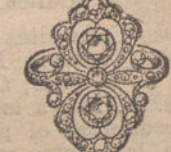
Núm. 24.—Tres brillantes y diamantes. Pesetas 500.

Factura de garantía en todas las compras