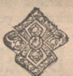
Núm. 10.—Tres brillantes y diamantes. Pesetas 175.