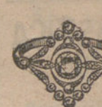
Núm. 19.—Trece brillantes y diamantes. Pesetas 360.