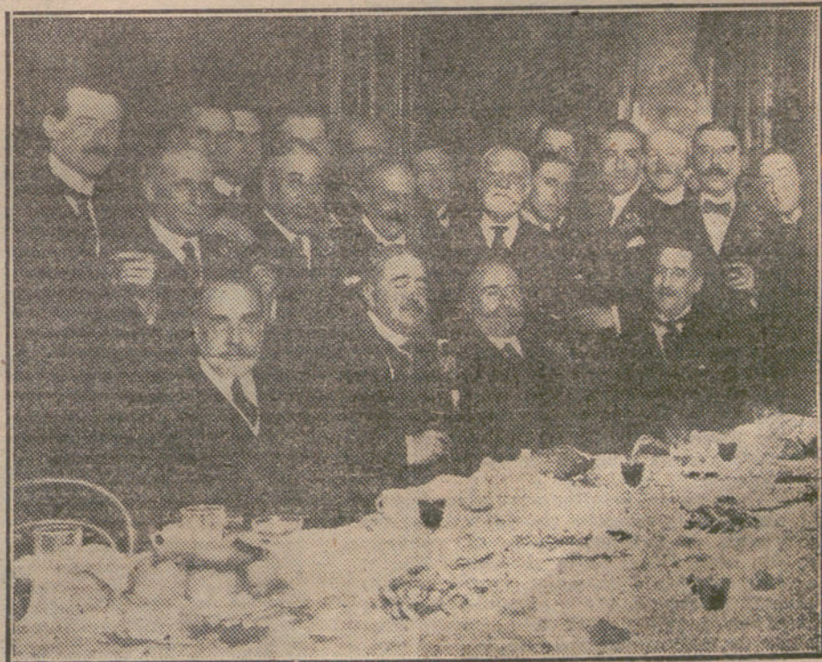
Banquete celebrado esta tarde por los ex alumnos de la Universidad de Bolonia.

Primera. Ningún agente podrá ser suspendido de empleo y sueldo, rebajado en categoría y separado del servicio sin previa formación de expediente, en el cual tendrá intervención para la transmi-