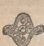
Núm. 9.—Tres brillantes y diamantes. Pesetas 165.