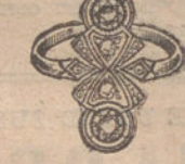
Núm. 16.—Cuatro brillantes y diamantes. Pesetas 300.