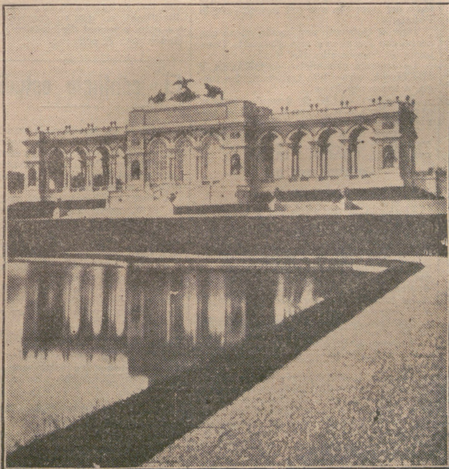
Entrada a la glorieta del Palacio de Schönbrunn, donde ha muerto el Emperador de Austria.

La huelga de carreteras ha quedado solucionada.