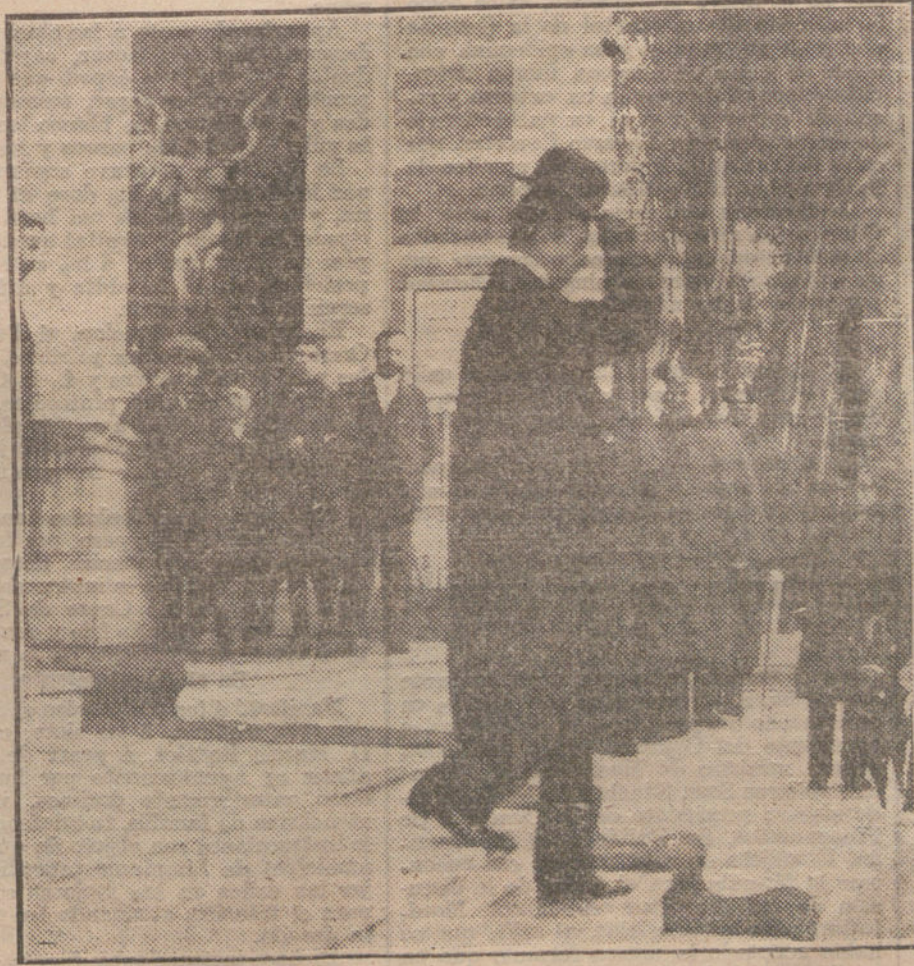
S. M. el Rey saliendo de Palacio del Retiro de visitar la Exposición benéfica de Artistas Belgas.

Por estos hechos es acusado de un delito de falsedad en documento privado,