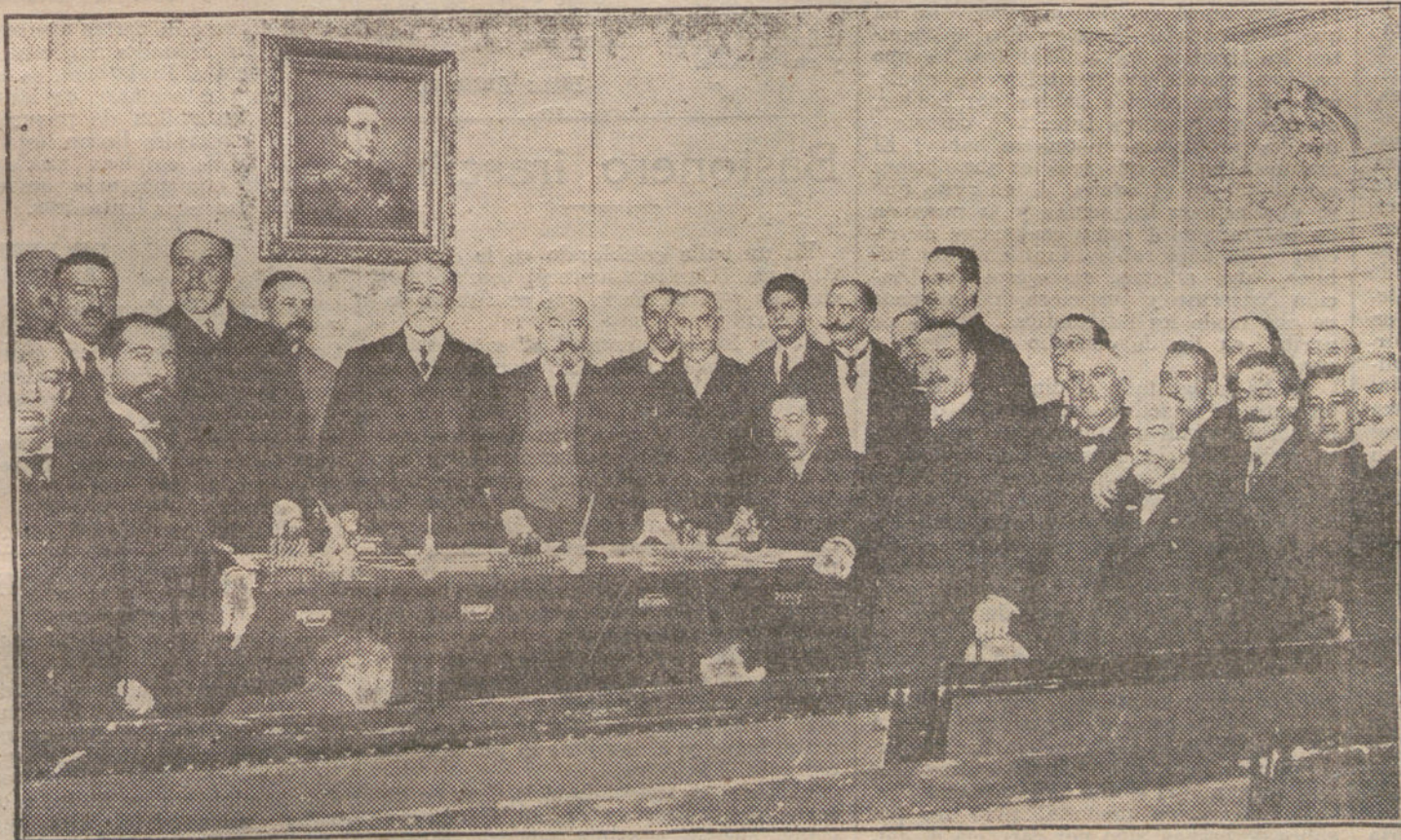
El ministro de la Gobernación, Sr. Ruiz Jiménez, presidiendo la Asamblea de inspectores provinciales de Sanidad, cuyo acto inaugural se ha celebrado esta mañana. (Fot. VIDAL.)

Por último, el señor ministro de la Gobernación pronunció breves y elocuentes frases ensalzando el acto que se celebraba y poniendo de relieve la trascendencia práctica que para una nación deben tener cuantos servicios se refieren a la Sanidad pública.