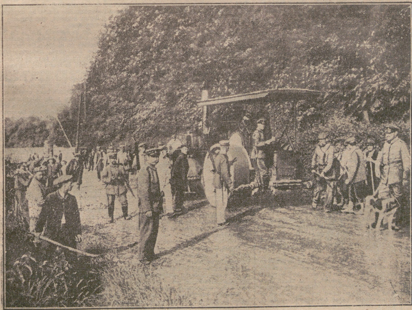
LAS NECESIDADES DE LA GUERRA. —Soldados alemanes construyendo una carretera estratégica en territorio francés.