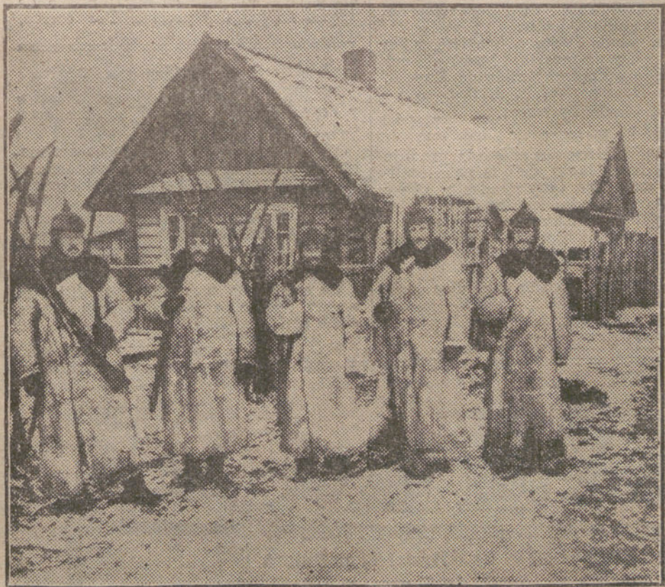
LA GUERRA EN ORIENTE.—Centinelas alemanes en equipo de invierno.