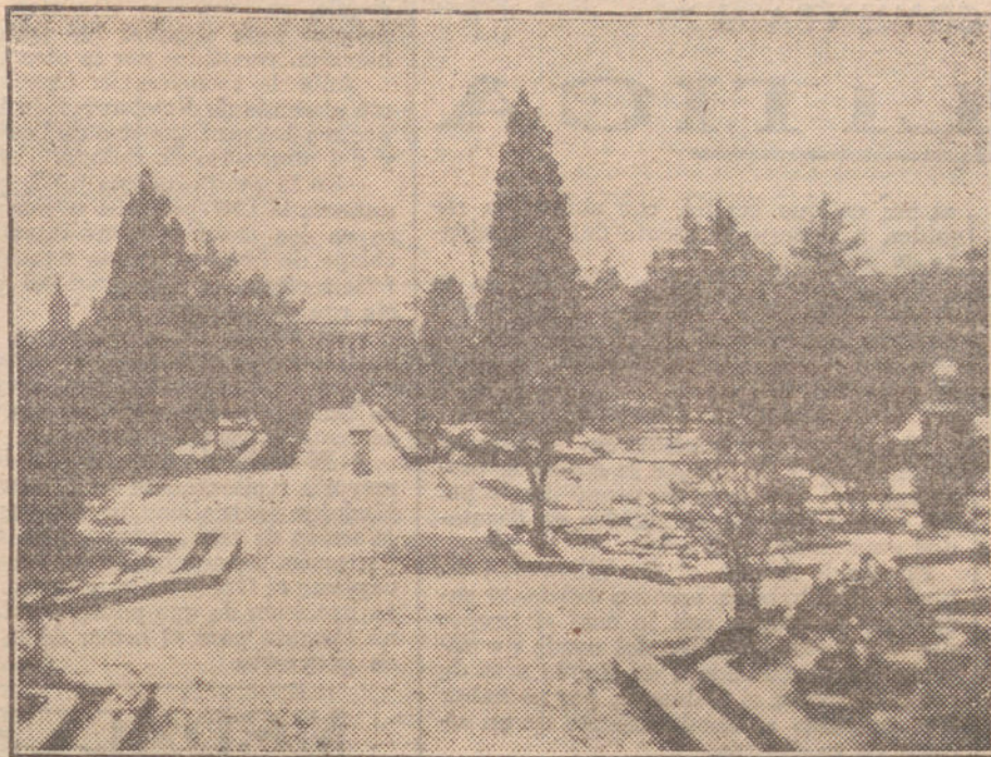
LA NEVADA DE HOY.—Aspecto que presentaba esta mañana el parterre del Retiro después de la nevada.

Cuarto. Que el espíritu de este movimiento es pacífico, siendo ajeno a los elementos extraños que perturban el orden, y que las manifestaciones y mítines que se celebran y han de celebrarse en toda España para abogar por nuestras peticiones han de responder a la cultura y justicia de ellas.»