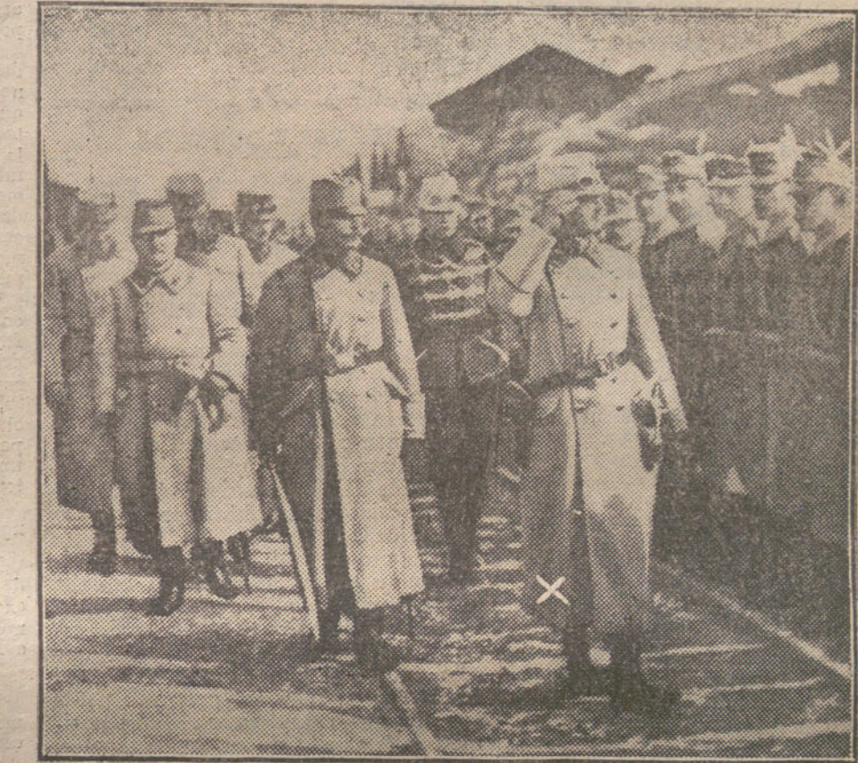
El nuevo Emperador de Austria-Hungria, Carlos VIII (X), revistando las tropas en el frente balkánico.

Nuestra política colonial africana ha tenido que trocarse en una acción meramente defensiva. Y el protectorado es hoy un campo donde se enseñorean los odios de la guerra de Europa... En estas condiciones, la gestión del general Jordana ha de vencer obstáculos