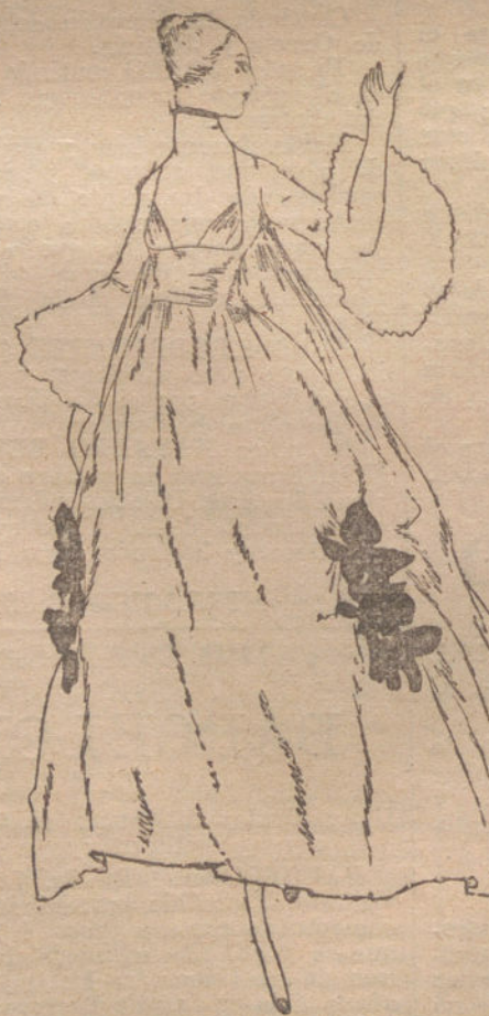
Modelo de la CASA ZAMORA.