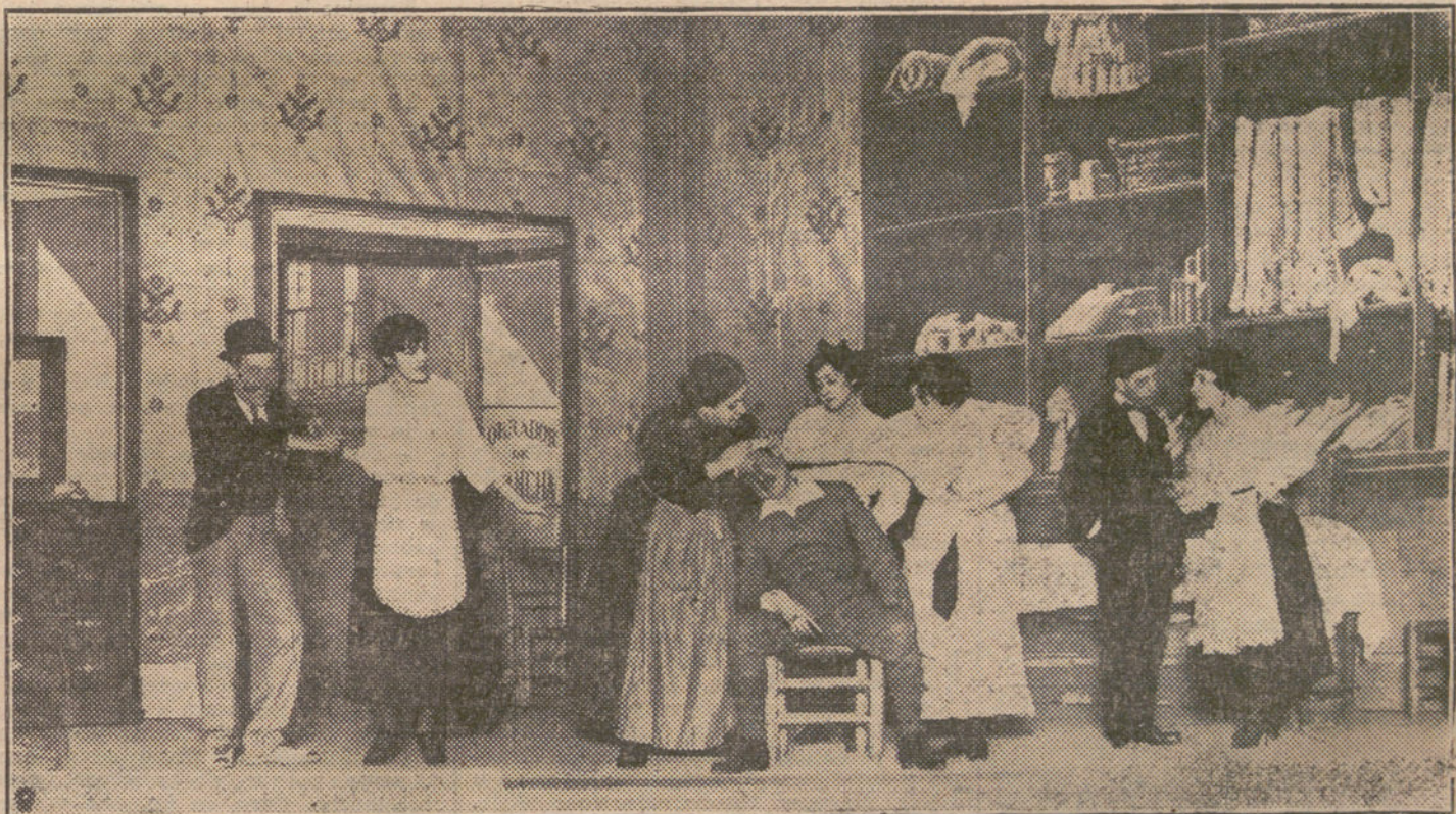
Una escena de «La mujer del héroe», arreglo de la comedia de Martínez Sierra, que se estrena esta noche en el teatro de Apolo.

—Y bien, salgamos—dijo el barón—. El inglés pasó primero, y en cuanto llegó a mitad de la terraza, hizo alto, dió frente a su adversario y se mantuvo firme. El húngaro avanzó resueltamente hacia él; pero apenas llegó al alcance del oficial, recibió en pleno rostro un formidable puñetazo, que le hizo caer redondo. Lanzando rugidos de dolor y de coraje, se levantó rápido, y, como un toro furioso, se precipitó sobre su enemigo. Bien pronto ambos rodaron por tierra, y tras breve lucha, bien pronto ambos estuvieron de pie. De nuevo frente a frente, el húngaro vió al inglés inmóvil, en guardia y pronto a seguir el boxeo. Pero el barón, avergonzado por haberse dejado arrastrar a aquel cuerpo á cuerpo brutal, lo que menos podía