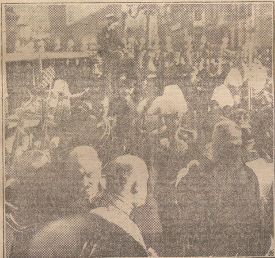
S. M. el Rey á su llegada á la iglesia de San Francisco el Grande.

La Sección de COMPRA-VENTA de LA TRIBUNA tiene sus oficinas en la plaza de Canalejas, número 6, primero izquierdo.