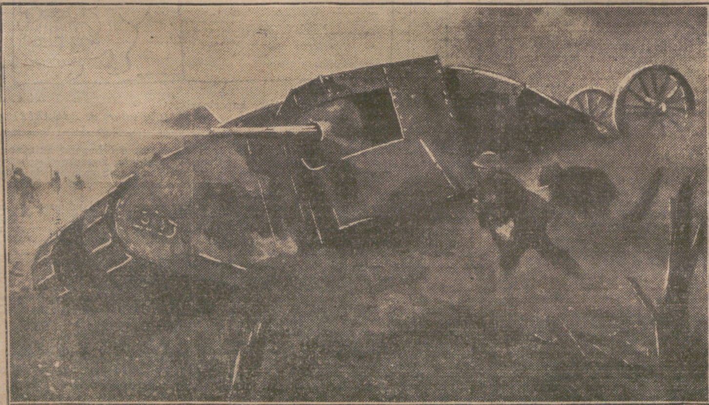
LAS ARMAS DE GUERRA.—Uno de los famosos «Tanques», utilizados por los ingleses en la campaña de Flandes.

Por este lado tampoco se encontraba salida, y en vista de la obstinación