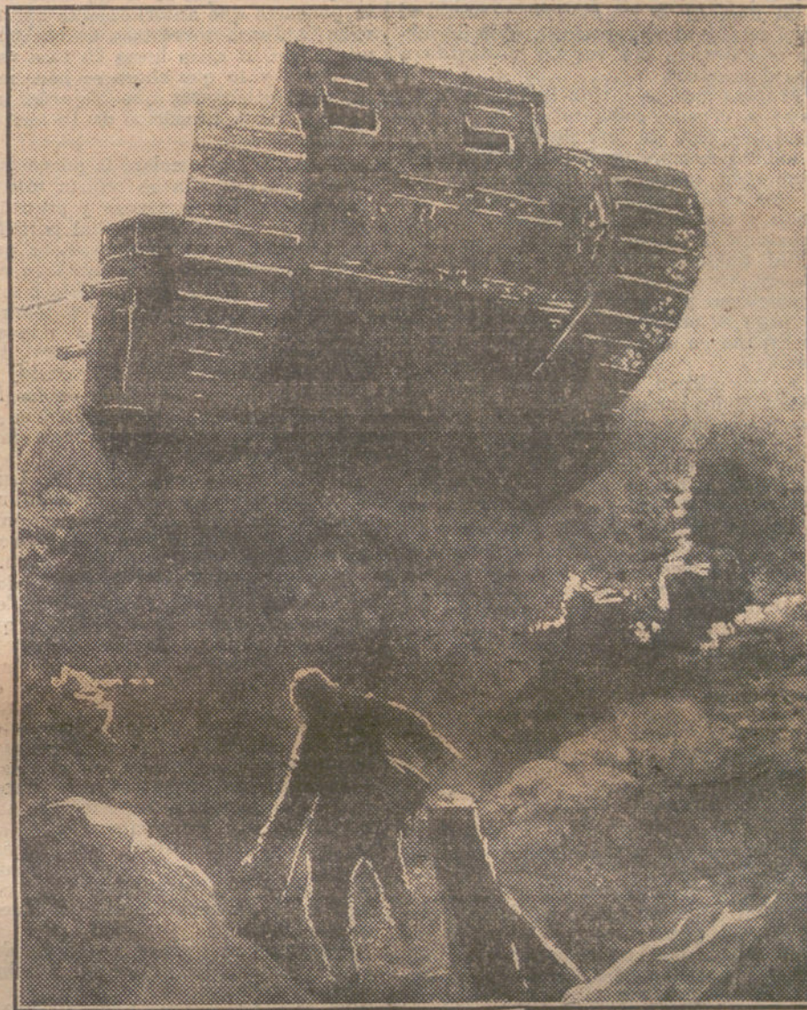
LAS ARMAS DE GUERRA.—Los modernos acorazados terrestres, conocidos por «Tanks», que están utilizando los ingleses en el frente belga.

Sólo en este orden de ideas, y no por los reparos de poca monta que expone el ilustre anónimo, nosotros vemos con buenos ojos que no se suscite el debate sobre la neutralidad, y aun-