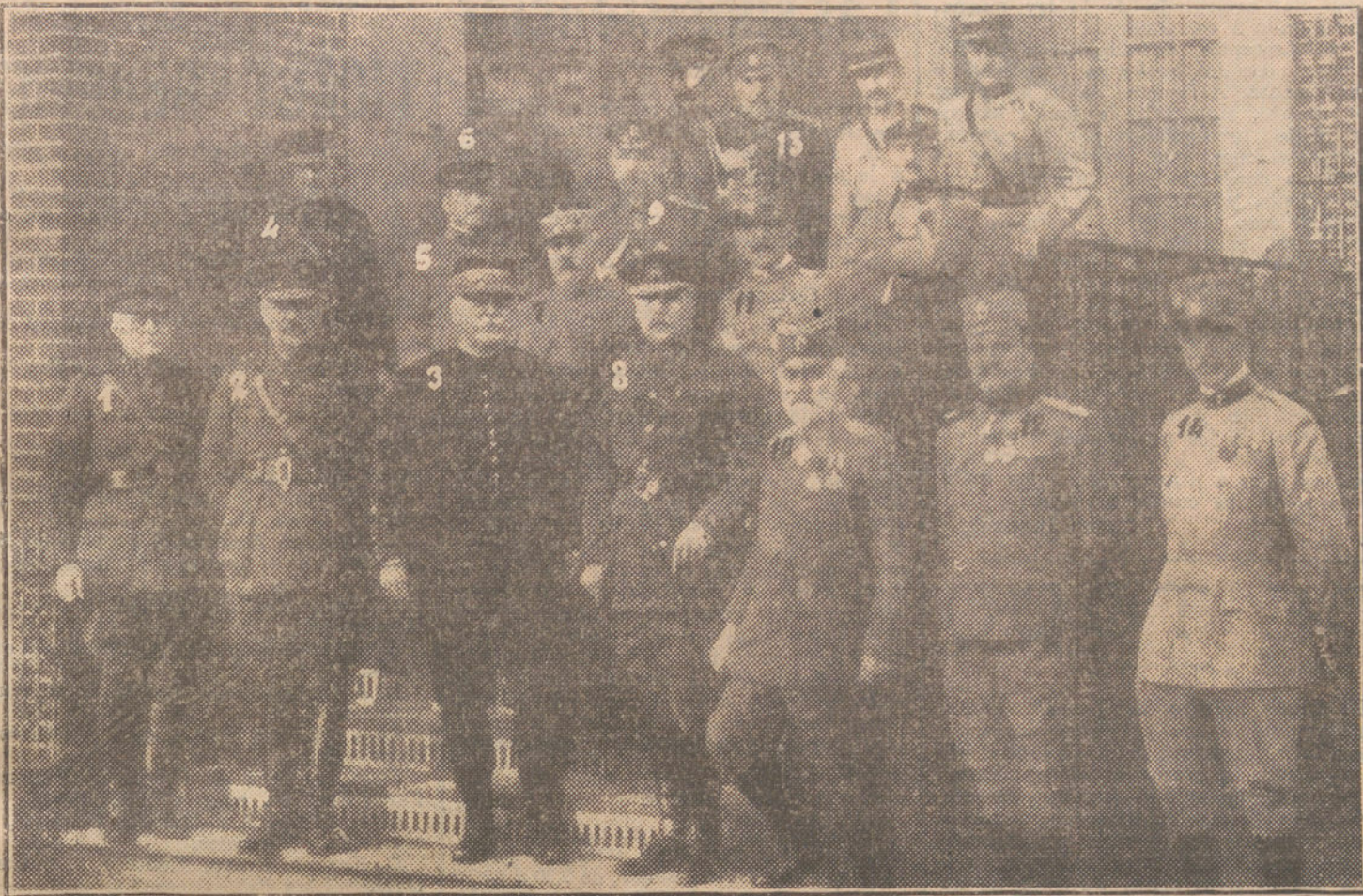
EL ÚLTIMO CONSEJO DE GUERRA DE LOS ALIADOS.—1, general Wilemans (belga); 2, Sir William Robertson (inglés); 3, general Joffre; 4, general Maurice (inglés); 5, coronel Nagai (japonés); 6, general Pellé; 7, general De Castelnau; 8, Sir Douglas Haig (inglés); 9, general Dessine (ruso); 10, general Ratchitch (servio); 11, general Porro (italiano); 12, coronel Pechitch (servio); 13, coronel Rudeanu; 14, coronel Tellini (italiano).

británica, el tribunal se conformaba ya con que se dieran satisfacciones por escrito. El inglés, impasible, denegó rotundamente con la cabeza. Por lo menos excusas verbales. Segunda negativa del oficial.