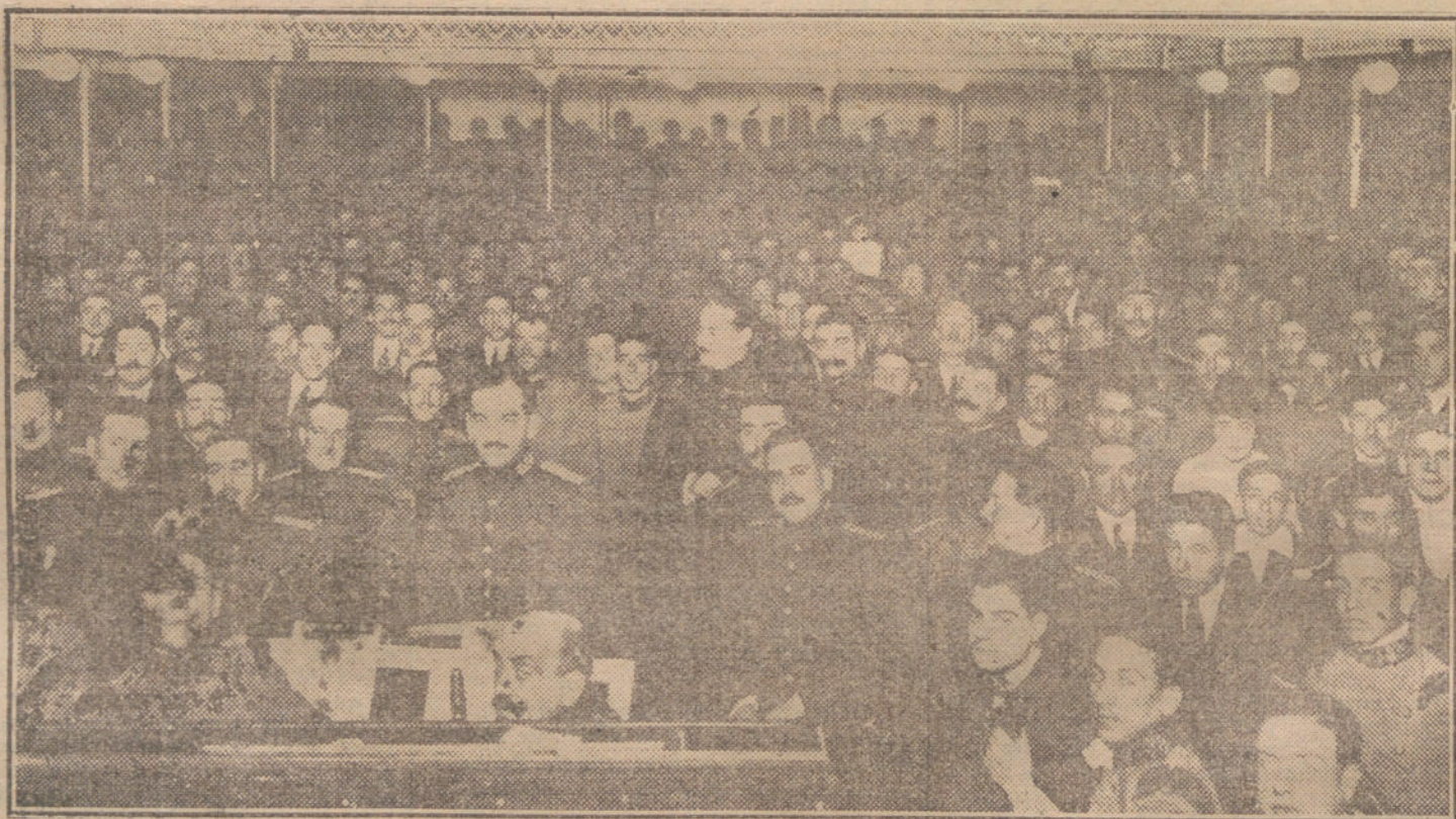
Aspecto del teatro Barbieri durante la función celebrada esta tarde y organizada por el regimiento de León, como principio de los festejos de la Patrona de la Infantería.

Si lo intenta, le preguntaremos qué sistema de prelación establecerá en la discusión de los proyectos; si van á la per-