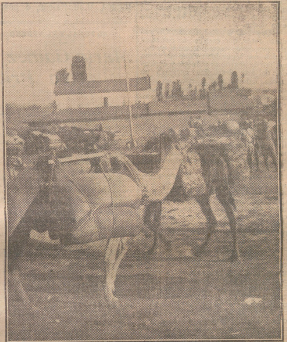
LA GUERRA EN FRANCIA.—Camellos utilizados en el frente occidental para el aprovisionamiento de los campamentos franceses.

Los más interesantes efectos de las proposiciones imperiales de paz hemos de verlos en los mismos Gobiernos de