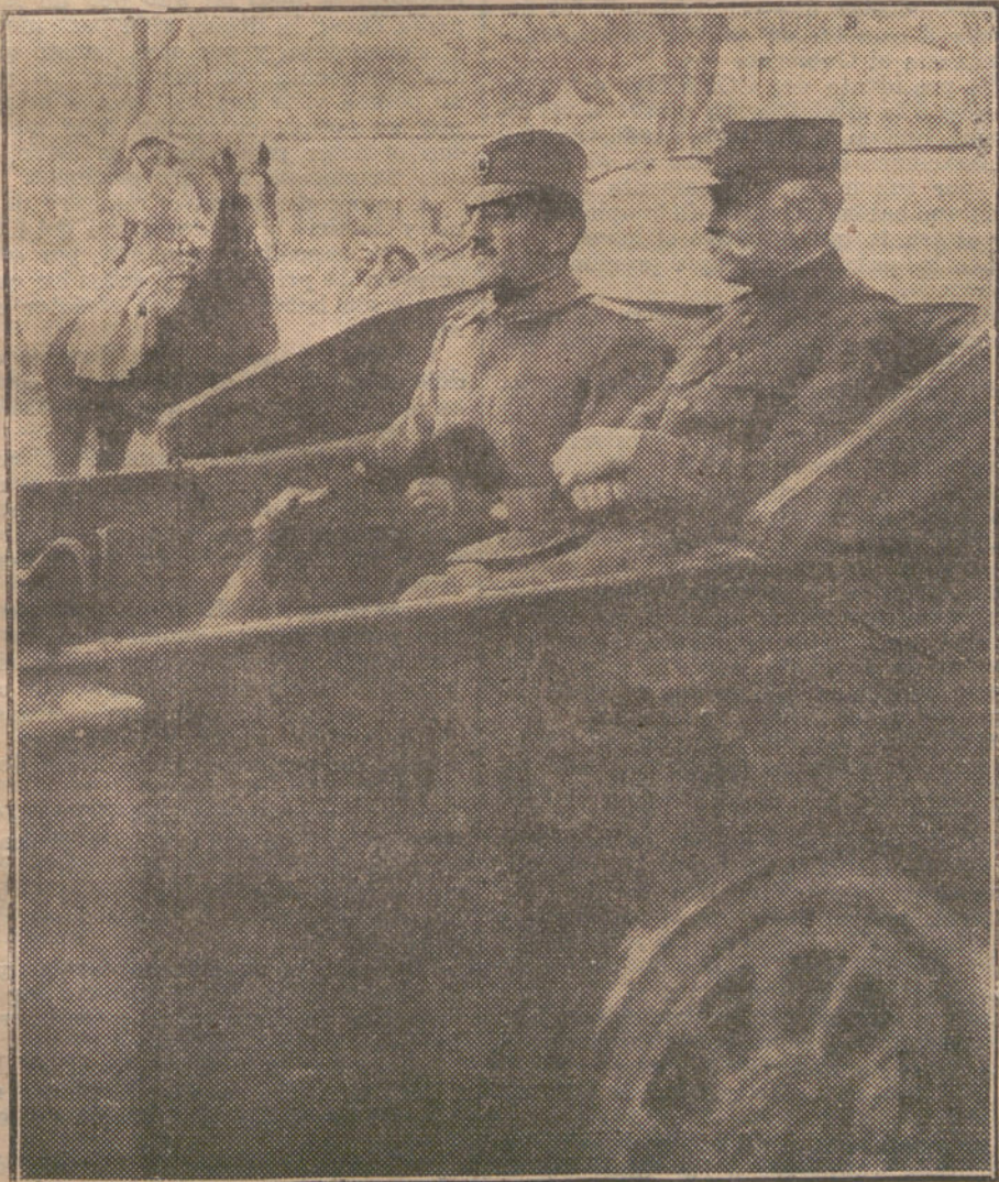
LA GUERRA EN LOS BALKANES.—El Príncipe heredero de Serbia, acompañado del general Sarrail, entrando en Monastir.

NUMERO DEL TELEFONO DE LA ADMINISTRACION DE «LA TRIBUNA» (PLAZA DE CANALEJAS, 6): 5.551