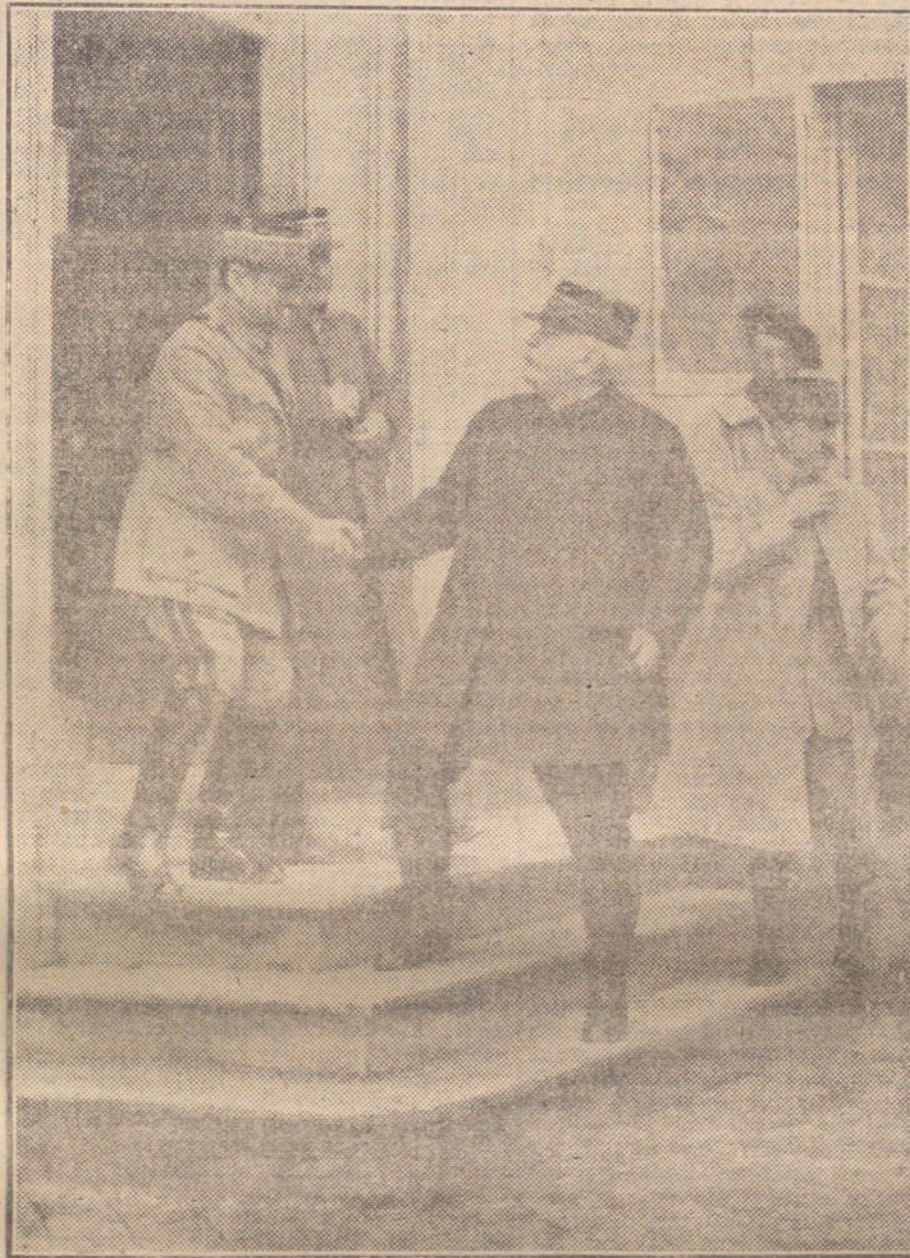
Los generales NIVELLE y JOFFRE, saludándose. El primero, que mandaba las fuerzas defensoras de Verdun, ha sido nombrado comandante en jefe de los Ejércitos del Norte y Nordeste, y el segundo ha sido designado consejero técnico de la dirección de la guerra. Estos nombramientos, que implican una modificación de funciones y mandos, han dado lugar a muchos comentarios entre los aliados.

«El rasgo de Alemania, calculado como todas las bribonadas tótonas, es a la vez insinuante y amenazador y no apartará