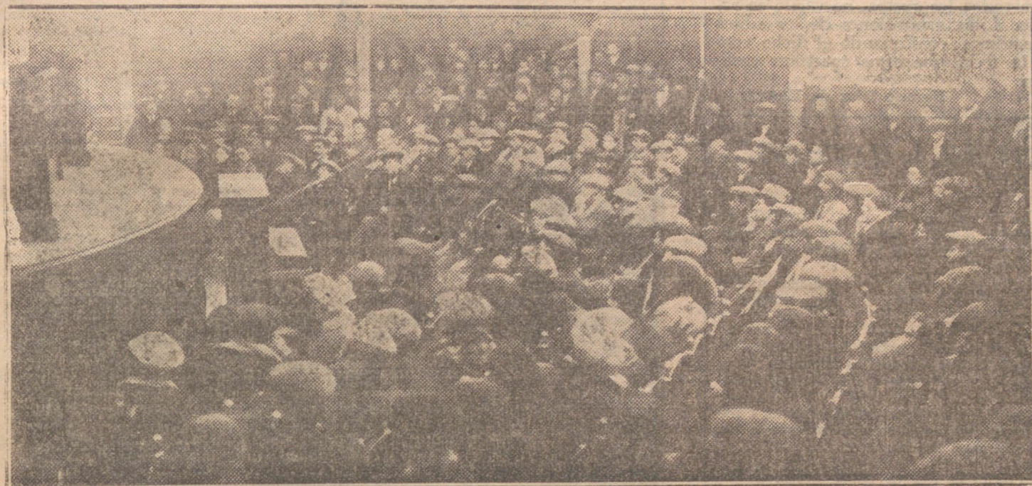
Aspecto del salón de actos de la Casa del Pueblo, durante el mitin celebrado anoche.