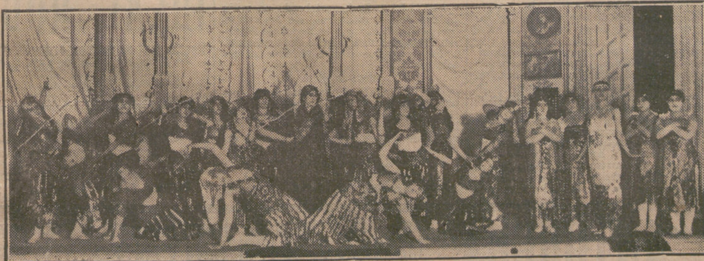
Una escena de «El botón de nácar», zarzuela de magia, original de Sinisio Delgado y el maestro Luna, estrenada ayer en el teatro de Apolo.

En los alrededores continúa nevando, y según comunican de los pueblos, los estragos causados por el temporal son de mucha consideración.