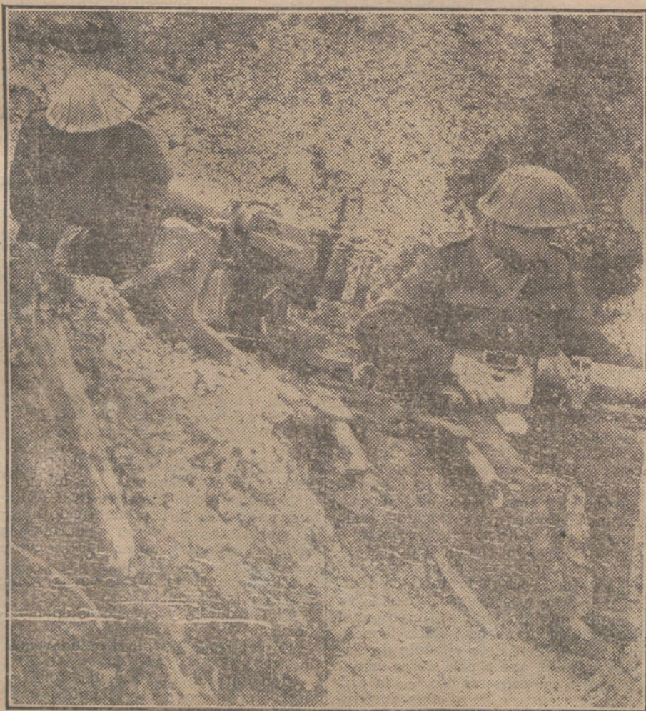
Soldados ingleses arreglando una ametralladora, deteriorada en un combate.

«Fuerzas del mariscal de campo Príncipe Leopoldo de Baviera. Cerca de Augustovka atacaron los rusos repetidas veces las trincheras que nuestros cazadores conquistaron anteaer, y fueron rechazados. Al Oeste de Luck, cazadores austrohúngaros asaltaron a tropas de reserva rusas, dispersándolas y haciendo prisioneros.»