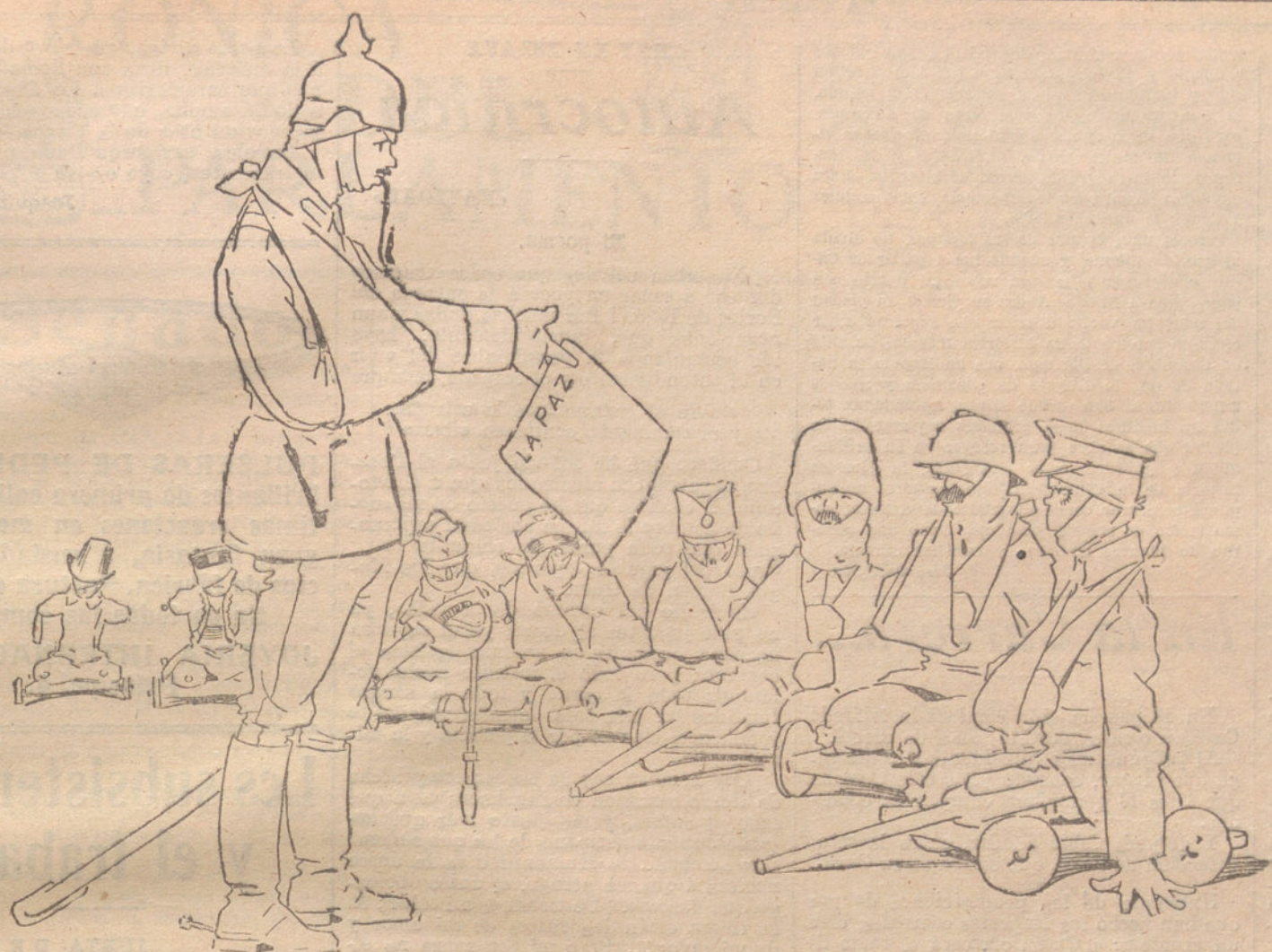
El alemán.—El que quiera puede firmar... —Los inválidos.—¡También son ganas: dé gastar saliva!