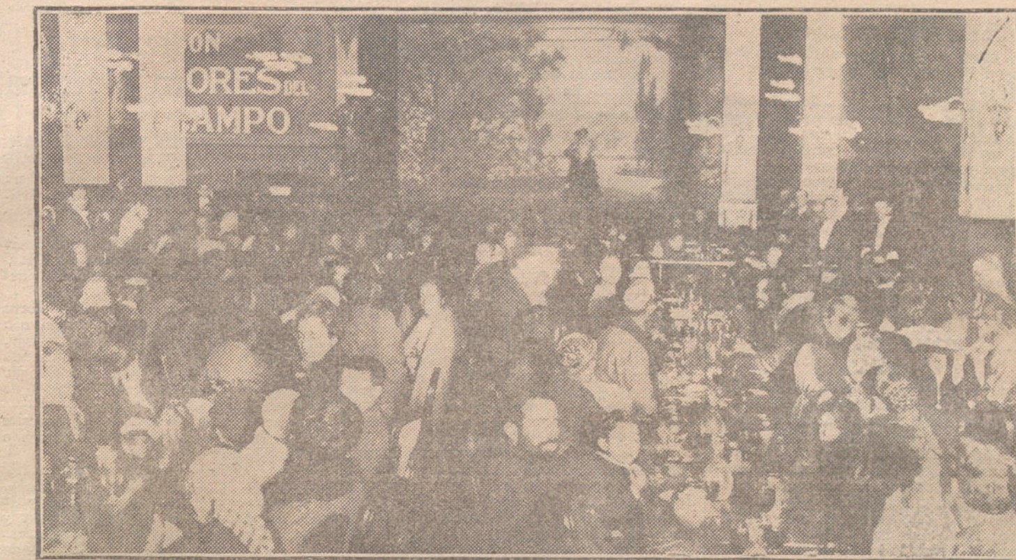
Grupo de pobres del distrito del Congreso presenciando una función de varietés en el Palace Hotel después de la comida ofrecida por dicho restaurant.

En otro orden de cuestiones hay que decir que Colombia se encuentra en pleno centenario de las glorias de su independencia, el cual se coronará en 1919, celebrando la conmemoración de la batalla de Boyacá, con la cual el pueblo colombiano afirmó definitivamente su libertad. A menudo se celebran homenajes a sus próceres o sus hechos, que la mayoría del pueblo considera aun como actos de oposición a España. Conviene, pues, una intervención diplomática en estos actos, que permita a la colonia