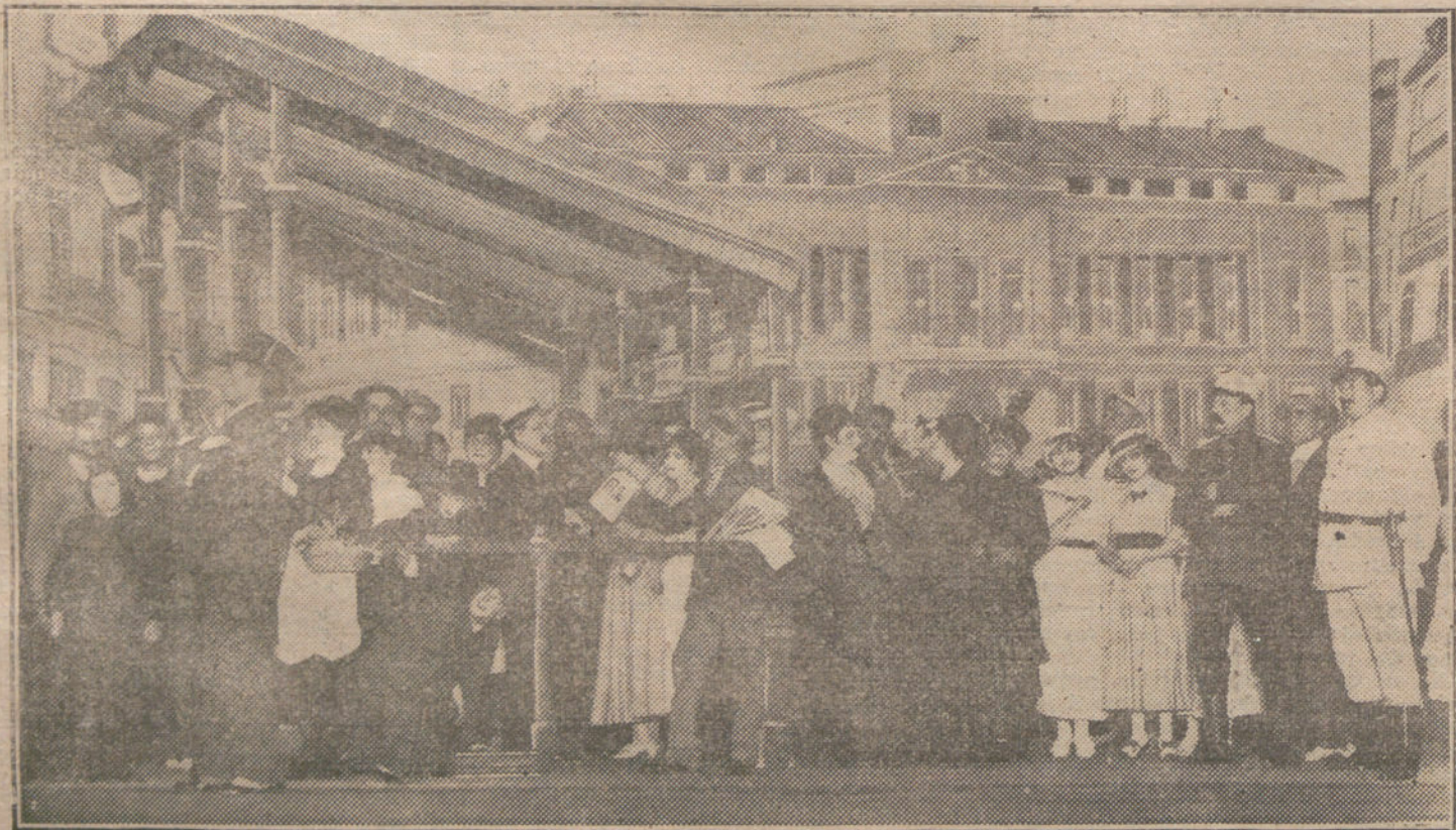
Una escena del sainete de Torres del Alamo y Asensio «Las paralelas», estrenado anoche con feliz éxito en el teatro de la Infanta Isabel.

Tuvo un perro de Terranova, que la salvó de la muerte, y en recuerdo de él, todos los años cuelga un árbol de Navidad con peces, chuletas, bistecs, longanizas, etc., etc., e invita a todos los perros de la vecindad, que se dan un gran banquete en honor de su valeroso compañero.