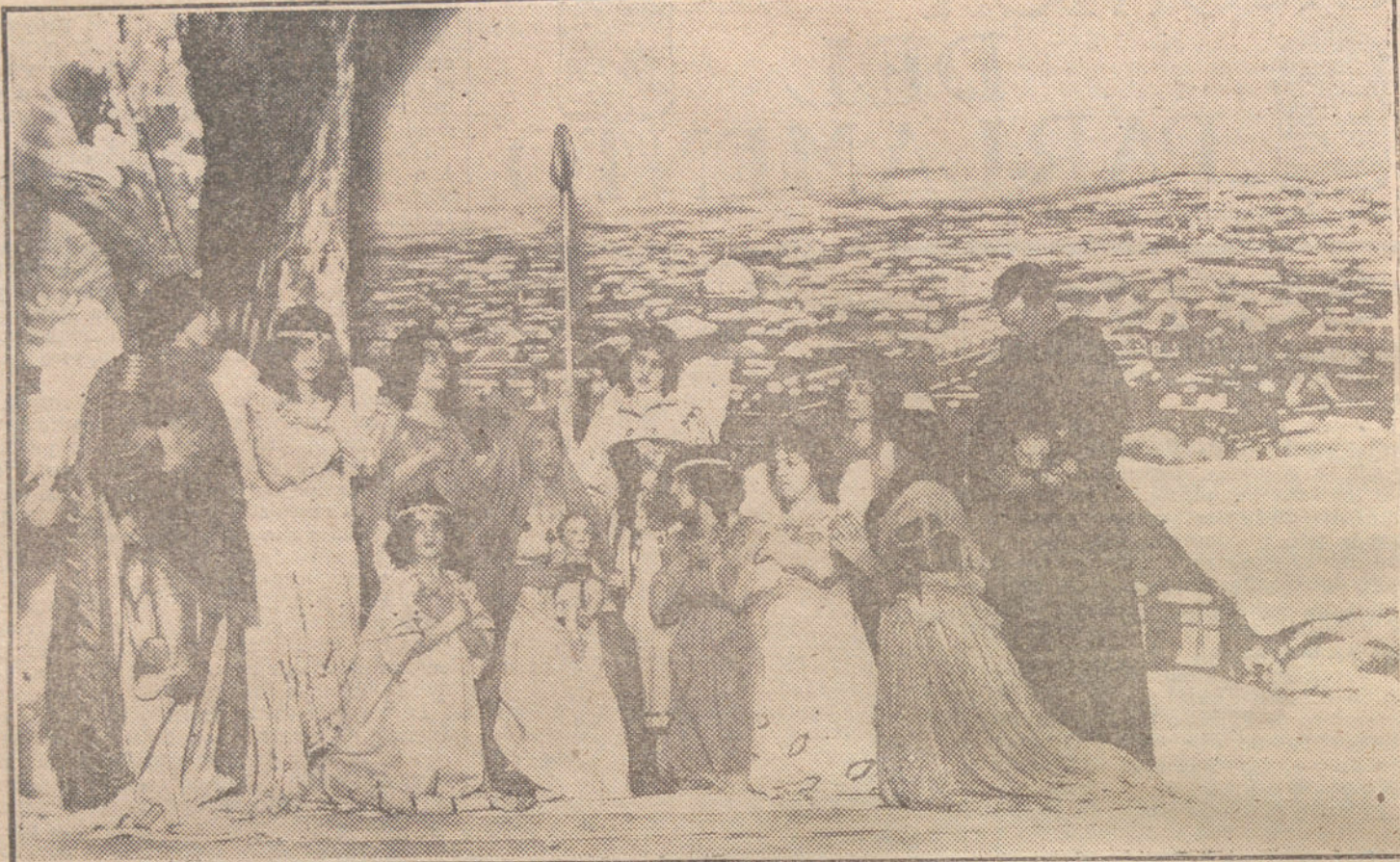
Una escena de la obra de Martínez Sierra y el maestro Turina «Navidad», estrenada esta tarde en el teatro de Eslava

Le dejaba hablar; su oratoria brillante y la fluidez del lenguaje me cautivaban.