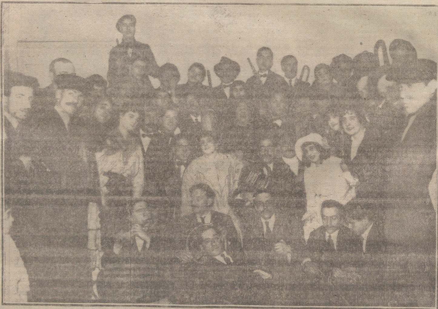
LA COLA DEL SORTEO.—Artistas de la compañía del teatro de Novedades favorecidos con participaciones del segundo premio.

The Foxtrot de SEIS a OCHO Souper a la salida del teatro