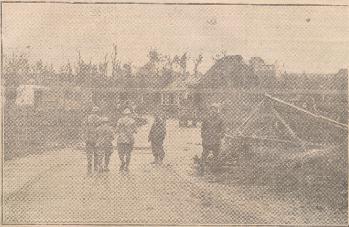
LOS COMBATES DEL SOMME. —Estado de una aldea ocupada por los franceses después de un cañoneo.

para asegurar la paz futura del mundo, el pueblo y el Gobierno de los Estados Unidos están interesados de un modo tan vital y tan directo, como los Gobiernos actualmente en guerra.