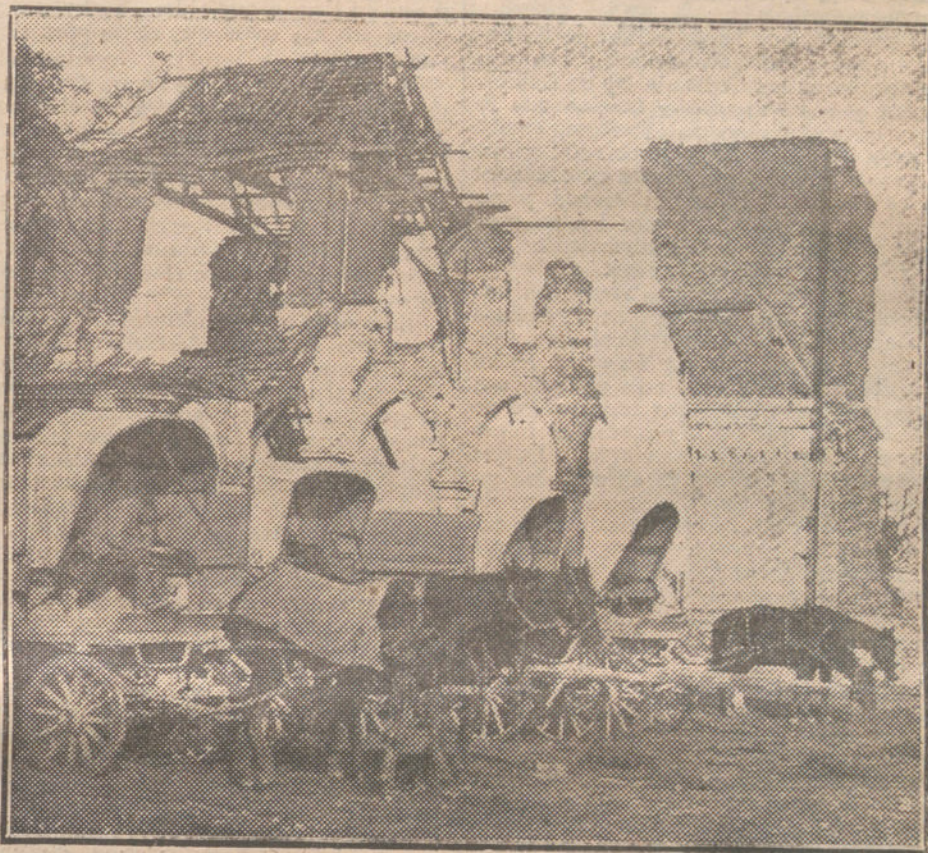
LA LUCHA EN EL SOMME.—Carros de aprovisionamiento para el Ejército francés, junto á un edificio destruido por los bombarderos.

En los tremendos choques, por su radio de acción, por la índole de su combustible, es seguro que los submarinos no habrán de necesitar aprovisionarse en los puertos neutrales, y, en cambio, los buques armados ingleses, sí. Estos, por su nuevo armamento, tendrán la condición de cruceros auxiliares; serán, pues, buques de guerra. ¿Puede un buque de guerra atiborrarse de cosas que no sean los víveres y el carbón necesarios para seguir su travesía? ¿Puede cargar mineral y