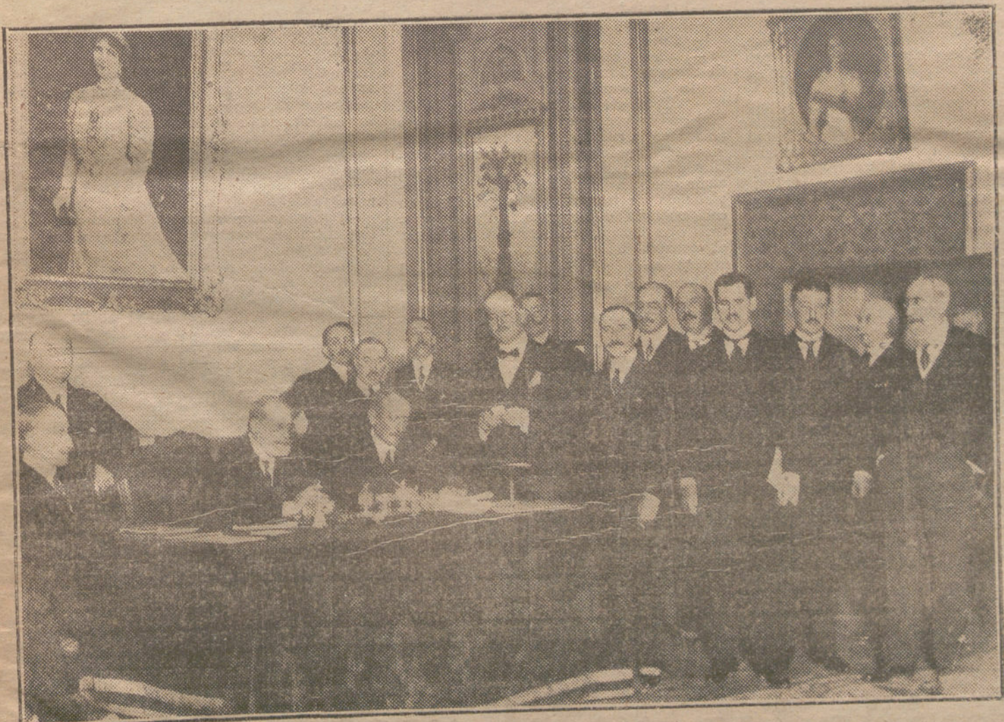
Personalidades que asistieron ayer tarde a la Junta general de la Gran Logia de España, celebrada en el salón de la Cámara de los Diputados.

El número de éstas celebradas en Estados Unidos se eleva a 35.136, tras que en 1914 sólo fueron 34.667 y en 1915, 32.827.