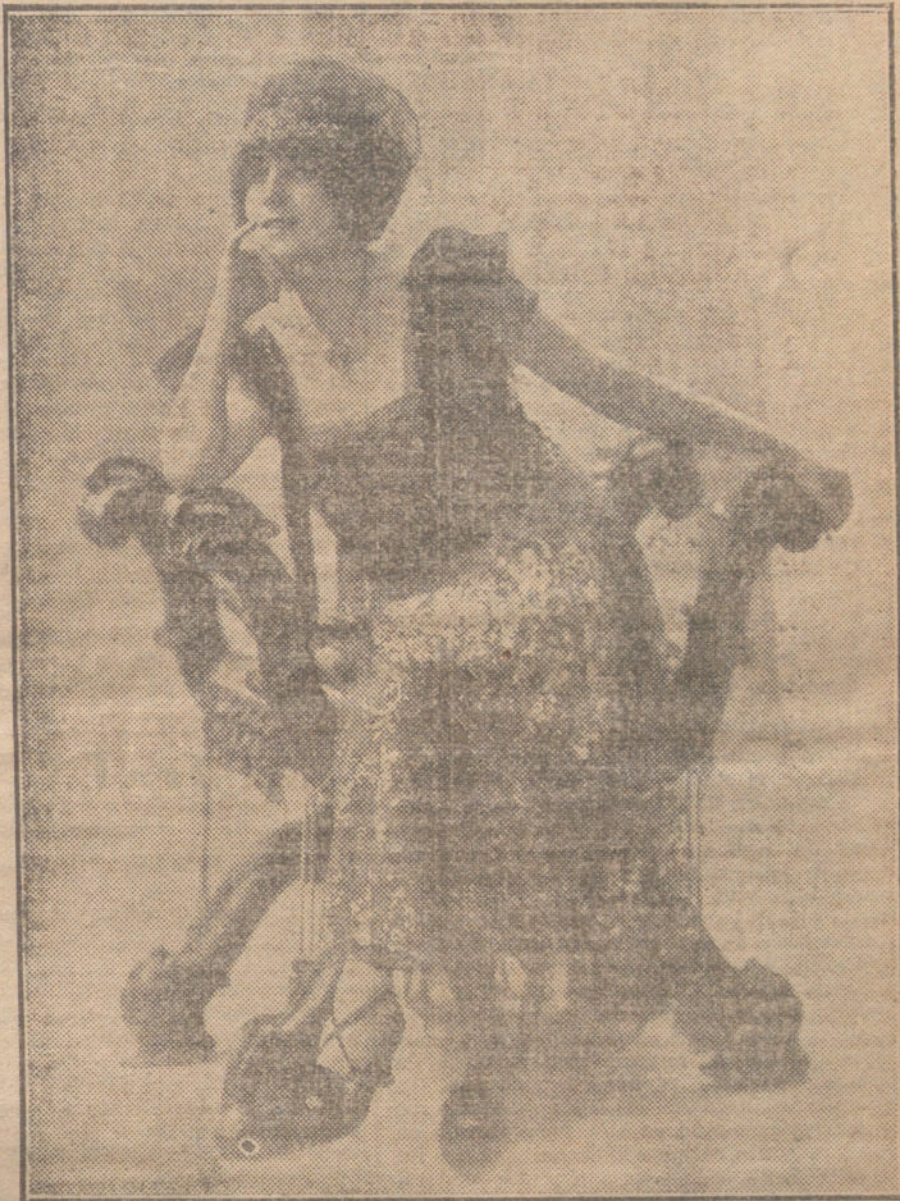
Traje de «soirée», presentado por la notable artista Mlle. Inés Pottier.