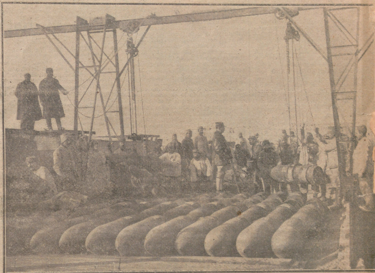
LAS NECESIDADES DE LA GUERRA.—Soldados franceses trasladando balas de cañón a la línea de fuego.

Destitución del comandante del primer Cuerpo de Ejército y del general responsable de las órdenes dadas el día 1 de Diciembre. Desagravios del Gobierno griego