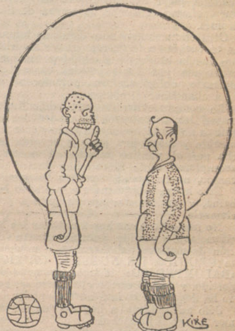
FOOT-BALL EN SEVILLA.—¿Como tires un «goal» te muerdo en la pierna!