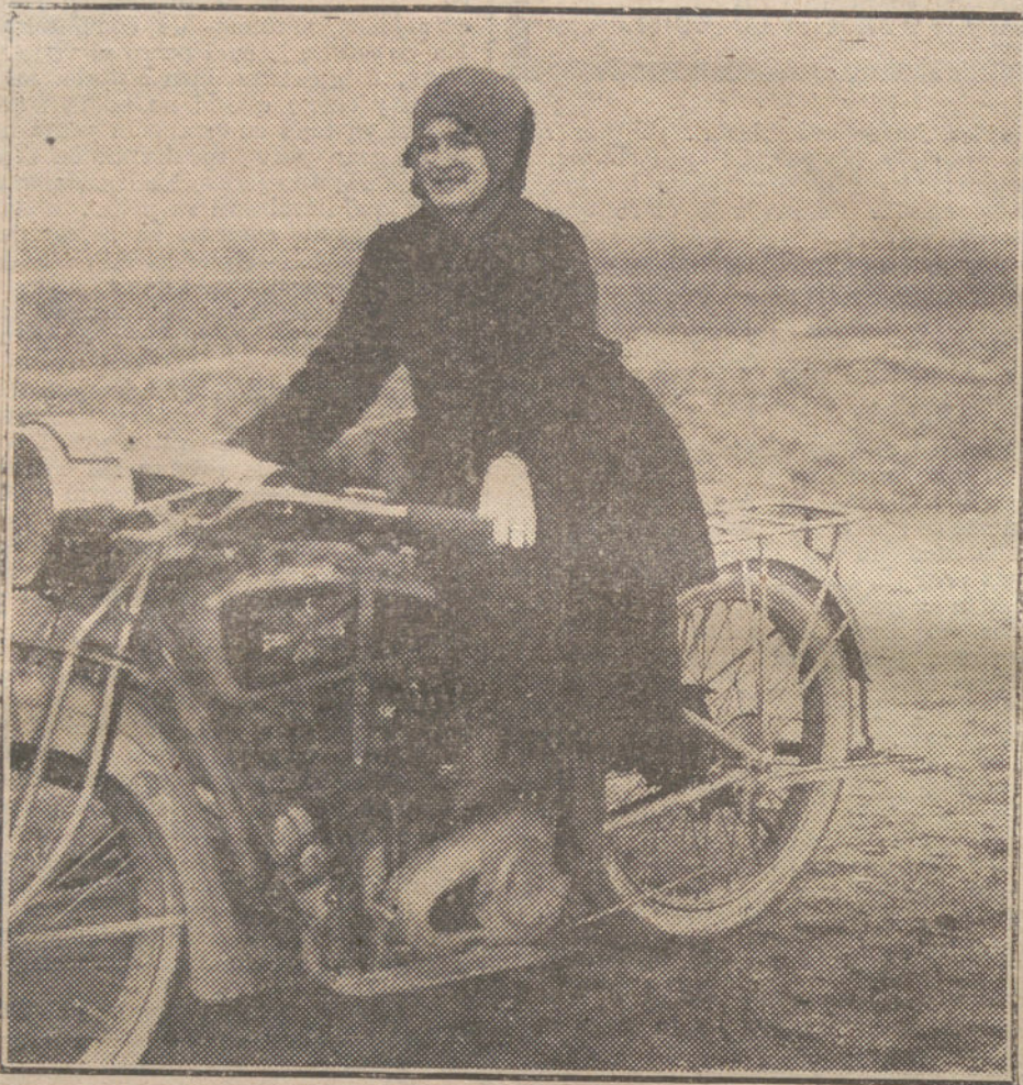
MOTORISMO FEMENINO.—Señorita madrileña que ha llevado a cabo en el año 1916 importantes «raids» motoristas, en su sidecar.

Muy señor mío y amigo: Acudo a usted hoy rogándole que en el citado diario tenga la bondad de hacer algunas aclaraciones que nosotros creemos necesarias y que