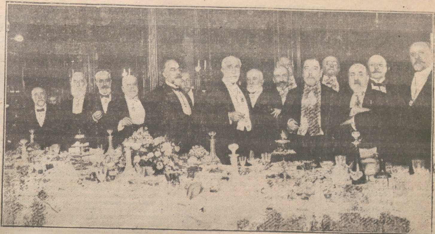
Banquete ofrecido a los académicos de la Lengua por su presidente, D. Antonio Maura, acto verificado anoche en el restaurant de Lhardy.

La administración del cuarto y el "gordo" de Navidad dejó hoy, cual siempre,